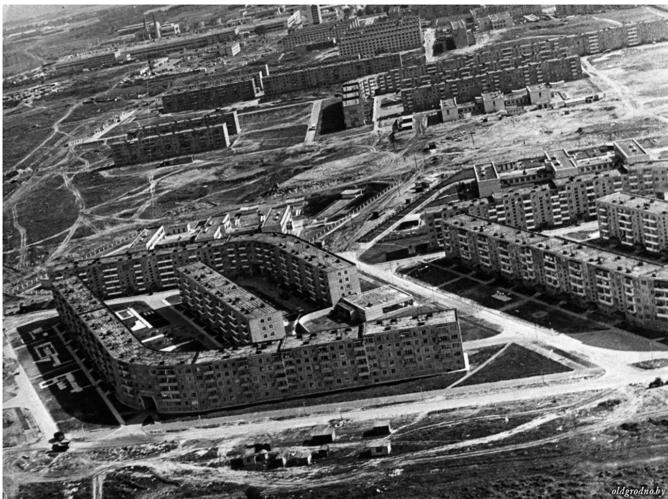
Новые микрорайоны БЛК-Врублевского, 1974 год: