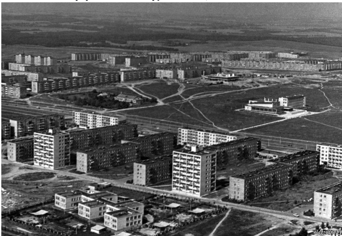
Новые дома по ул. Домбровского, БЛК и Врублевского. 1975 год: