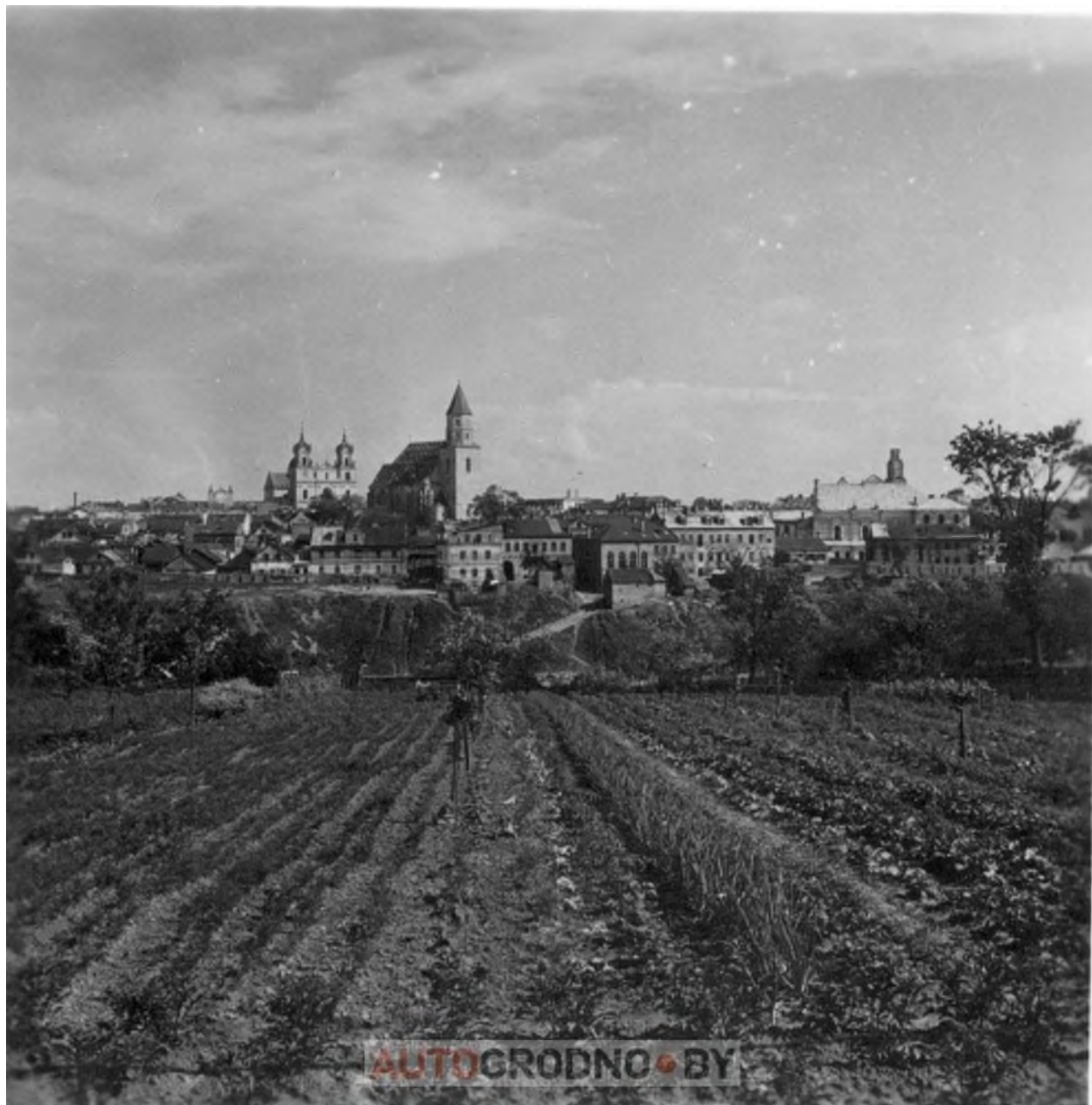
Вид на центр Гродно из Коложского парка. Ориентировочно с того места, где сейчас стоит здание «Дворца творчества и молодежи»