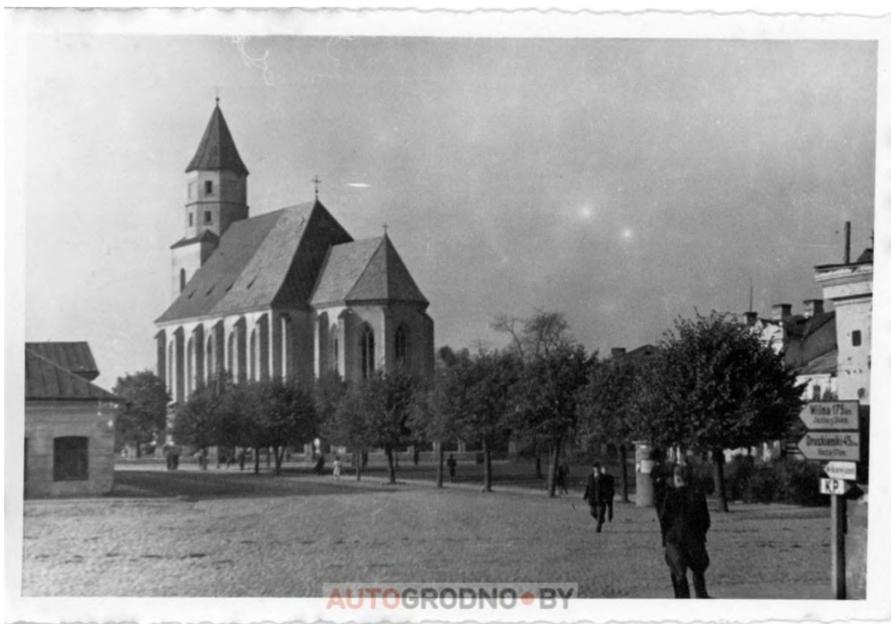
Фара Витовта. На переднем фоне заметен знак с немецкими указателями: Вильнюс 175 км, Друскининкай 45 километров