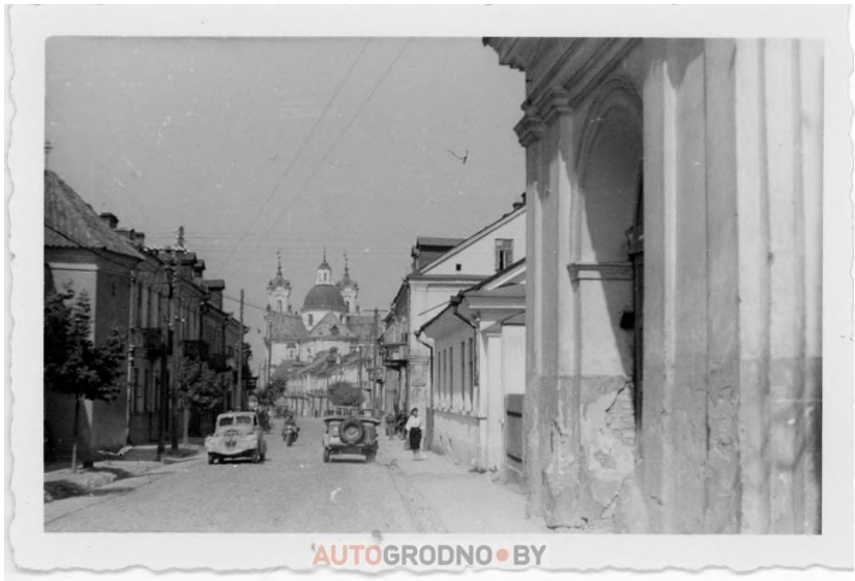
Нынешняя улица Карла Маркса