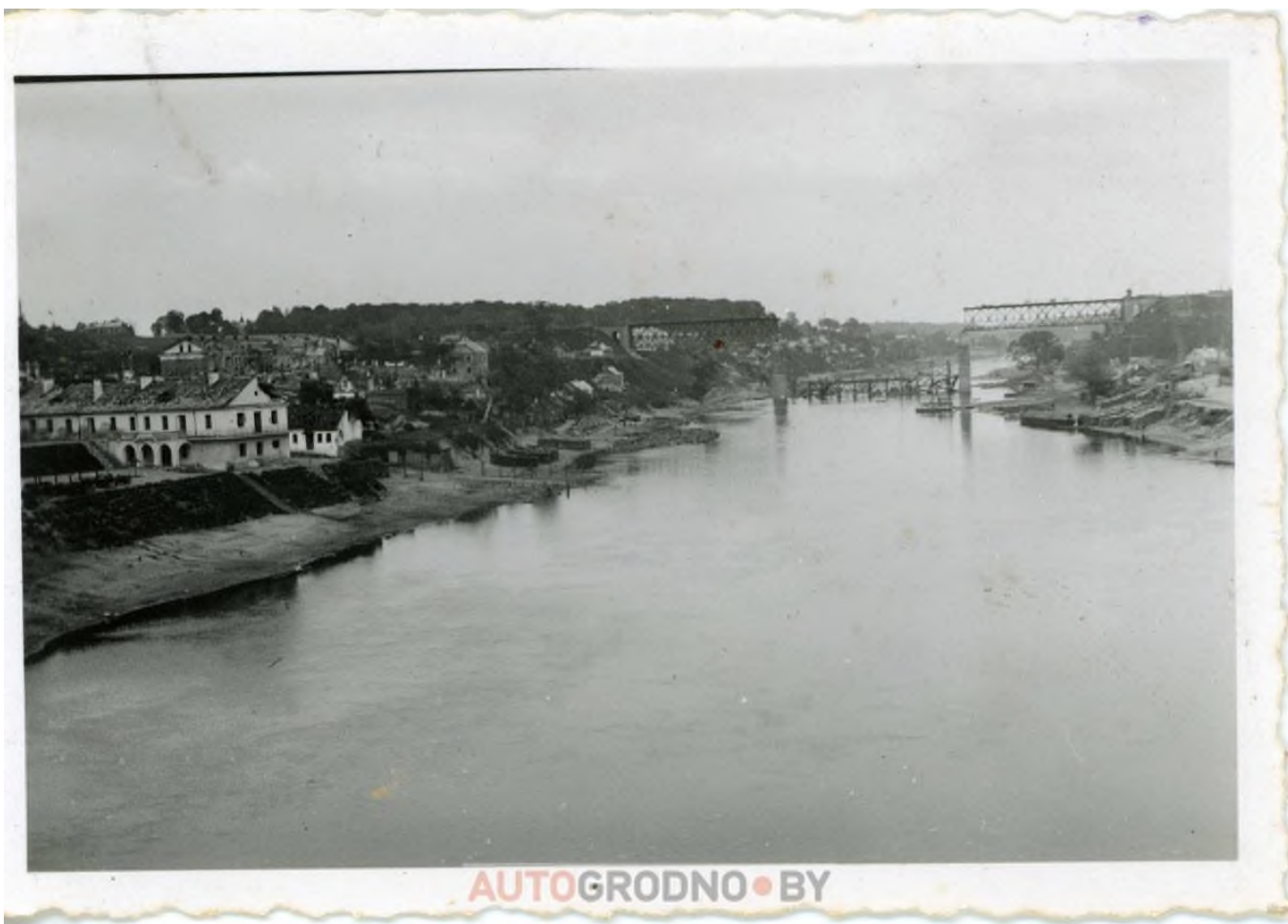
Взорванный железнодорожный мост