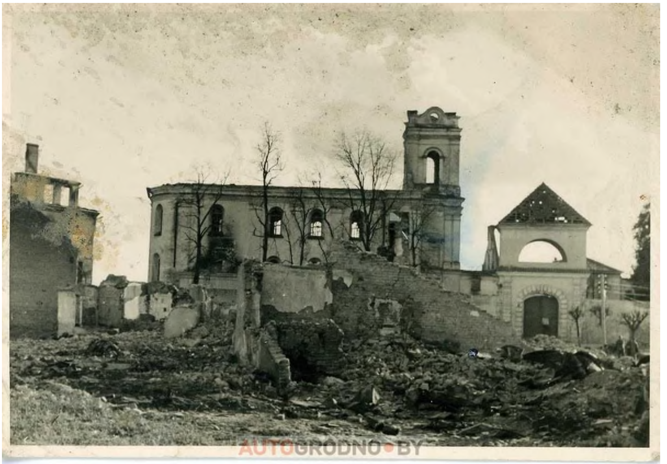
Разрушенный костел и монастырь, который ранее стоял на месте драмтеатра