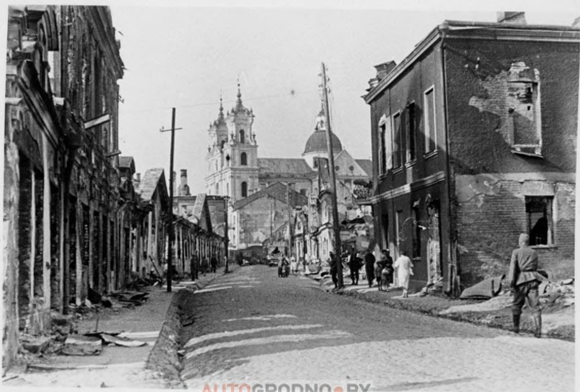
AUTOGRODNO • BY