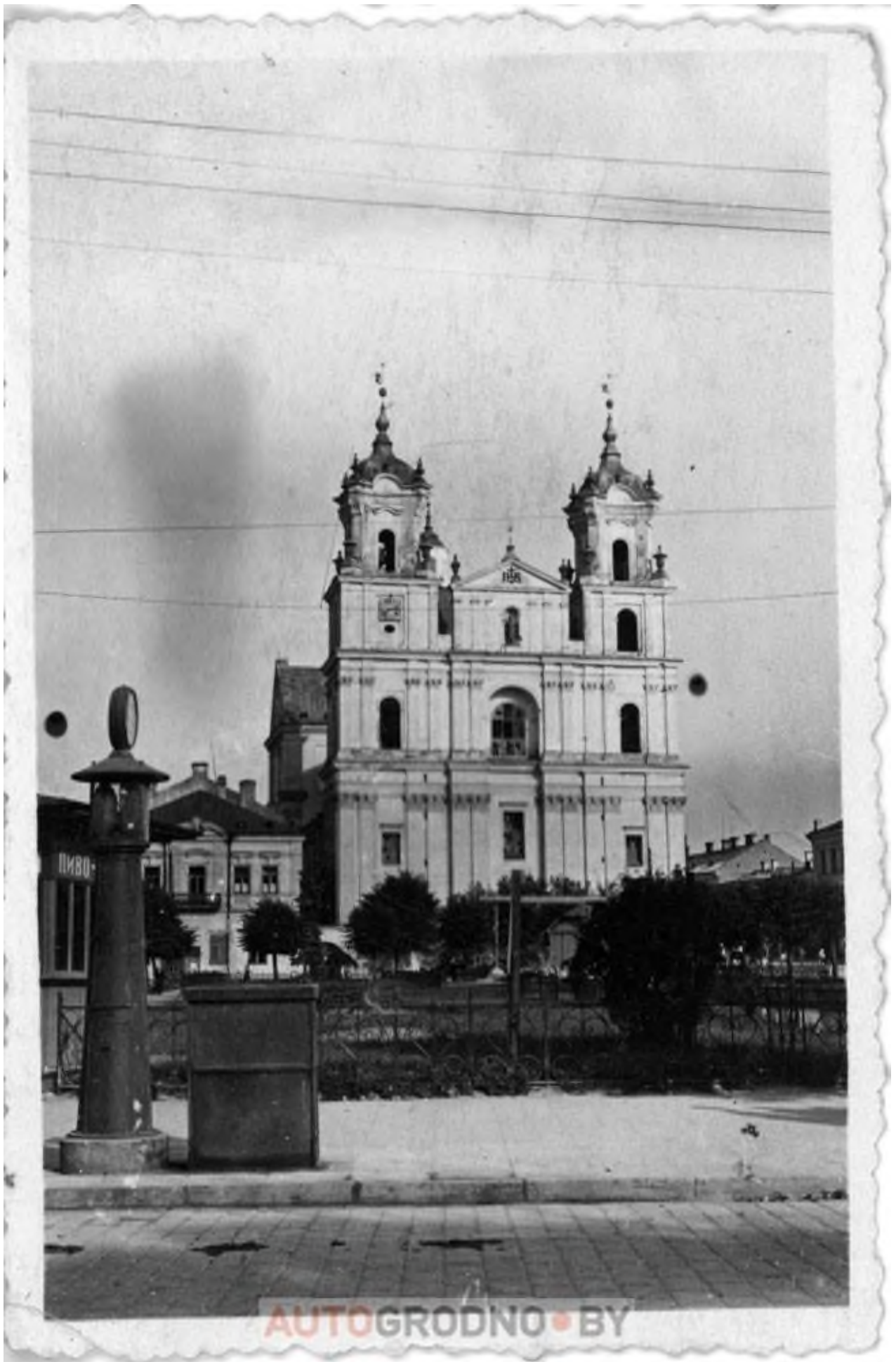
Нынешняя площадь Советская, Фарный костел, ларек «Пиво» и одна из первых бензакколонок Гродно! Эта фотография уже встречалась на АвтоГродно.