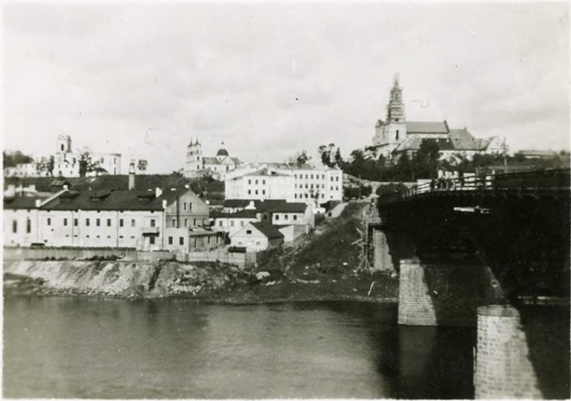
AUTOGRODNO • BY