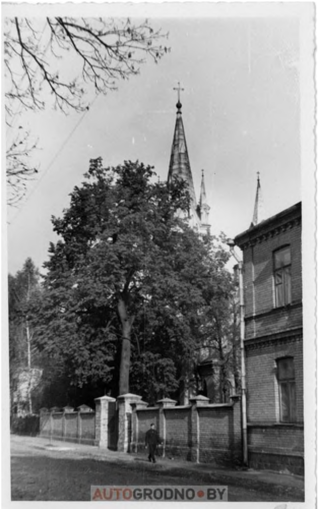
За деревом виднеется Кирха, что на улице Академической