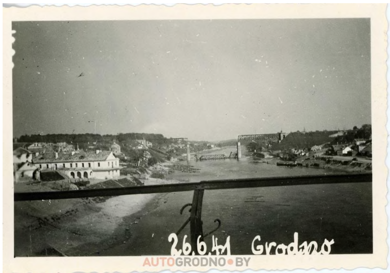
На снимке сохранилась дата – 26 июня 1941 года