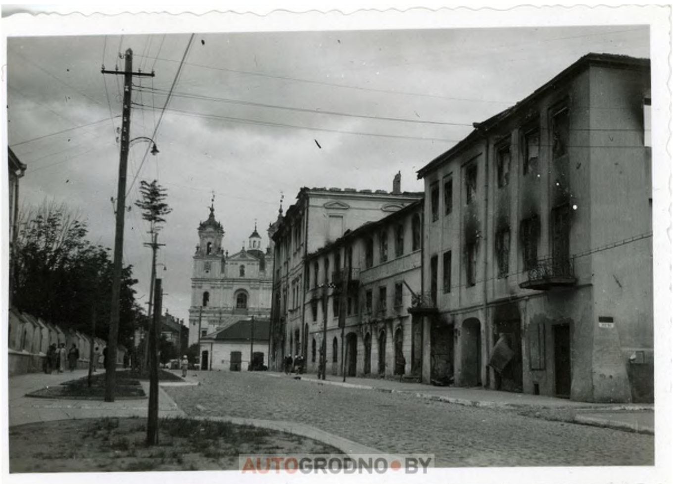
Улица Замковая в Гродно