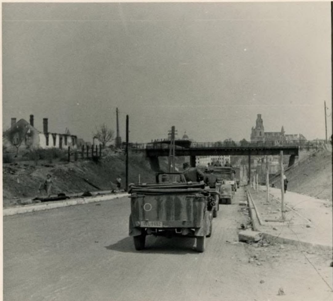
AUTOGRODNO • BY