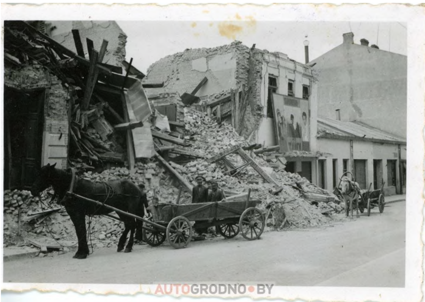
Улица Советская. То самое место, где теперь стоит здание универмага - Торгового Дома «Неман»