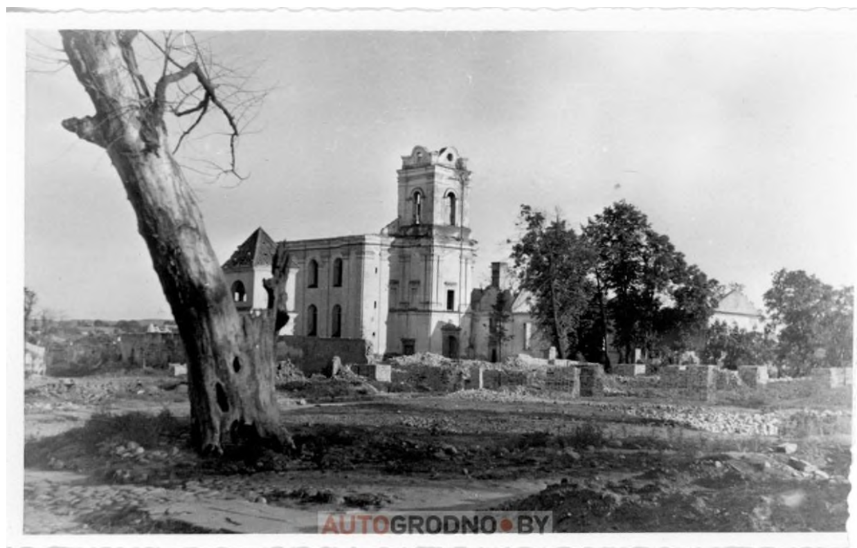
Разрушенный костел и монастырь, который ранее стоял на месте драмтеатра