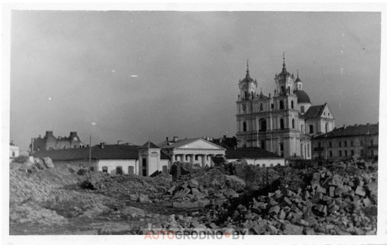
Современная улица Советская – видна ратуша, которая к сегодняшнему дню не уцелела, а также многочисленные руины зданий