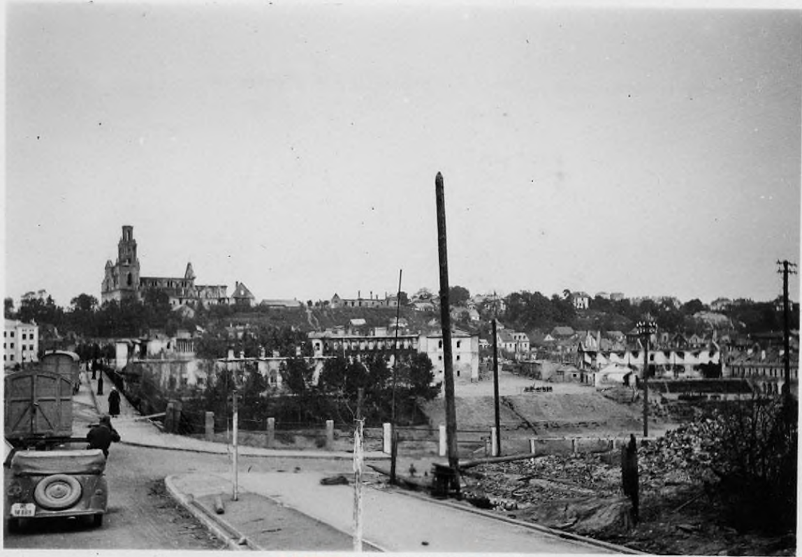
AUTOGRODNO • BY