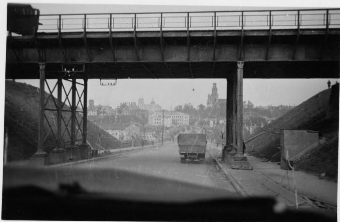
AUTOGRODNO • BY