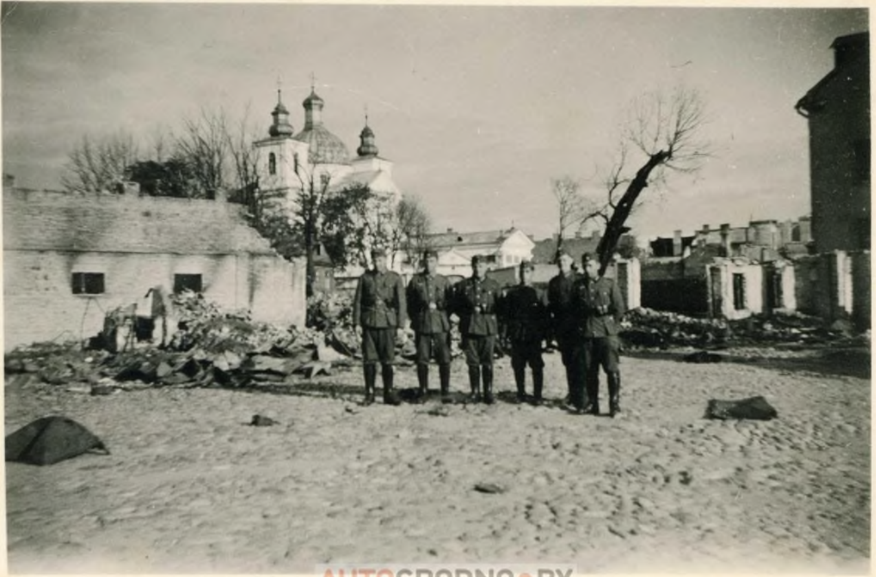
AUTOGRODNO • BY