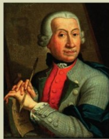
Ксаверий Доминик Геский. Автопортрет. 1750г.

украшали также канделябры и свисавшие с потолка 16 белых люстр. По предположению некоторых исследователей, четыре резных деревянных подсвечника из дворца Радзивиллов сохранились в интерьерах костела Обретения Святого Креста в Гродно.