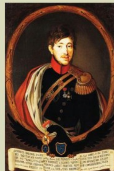
Доминик Иероним Радзивилл. Автор неизвестен. XVIII в.

Князь Радзивилл занимал различные должности в Речи Посполитой обоих народов. Он был мечником ВКЛ, старостой львовским, а в 1762 году стал воеводой виленским. По политическим мотивам несколько лет находился в эмиграции. В Дрездене он узнал о том, что Сейм лишил его должности