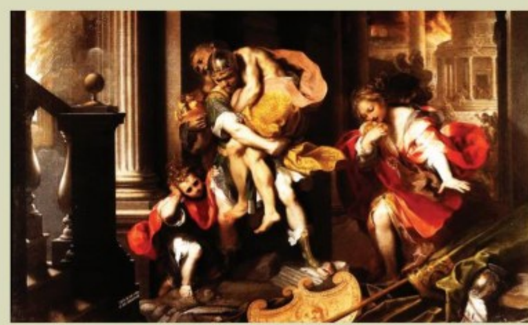
Картина «Спасение Энеем из Троянского огня отца своего». Автор неизвестен. XVIII в.