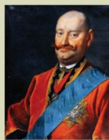
Кароль Станислав Радзивилл Пане Коханку. Автор неизвестен. XVIII в.