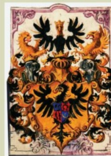
Родовой герб Радзивиллов.

Новый владелец – канцлер ВКЛ Кароль Станислав Радзивилл – родился в 1669 году в Кракове. Женился он на Анне Катерине Сангушко, что из рода Иеронима Сангушко и Констанции Сапег. В браке у них родились 7 детей, в том числе и Михаил Казимир по прозвищу Рыбонька.