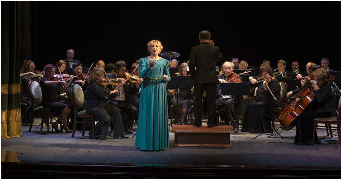
Салісты Нацыянальнага акадэмічнага Вялікага тэатра оперы і балета Беларусі і камерны аркестр Гродзенскай капэлы – канцэрт «Гала-опера». Гродзенскі абласны тэатр лялек, 2016 г.