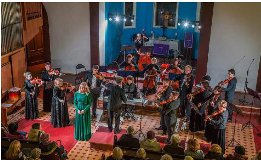
Канцэрт камернага аркестра. Лютэранская кірха, г. Гродна, 2019 г.

М. Агінскага (Літва, 2013), фестываль царкоўнай музыкі (Польшча, 2013–2014), «Камер-фэст» (Україна, 2016), рэспубліканскія фестывалі нацыянальных культур і інш.