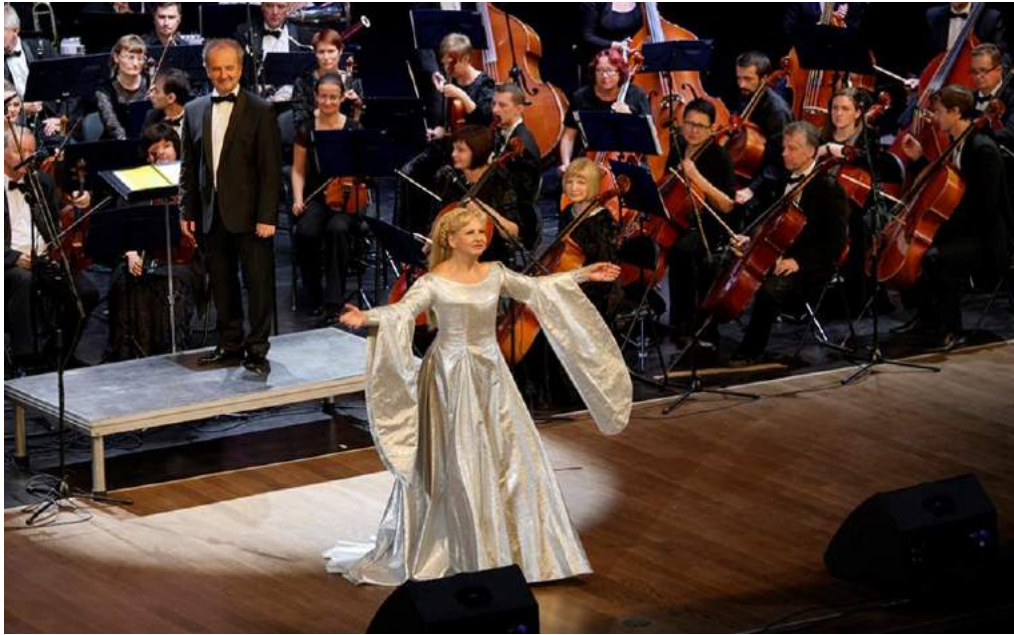
Канцэрт «Музычная Шэкспірыяда» ў Гродзенскай абласной філармоніі, 2019 г.