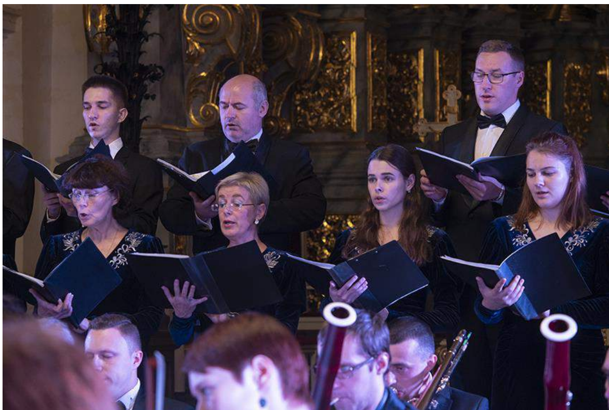
Камерны хор Гродзенскай капэлы, г. Гродна