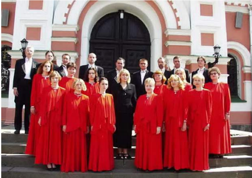
Камерны хор Гродзенскай капэлы, г. Гродна каля ўваходу ў Свята- Пакроўскі сабор

Камерны хор – лаўрэат фестывалю прываслаўнай музыкі «Каложскі дабравест», якія праводзіліся ў Гродне з 2002 г., міжнародных фестывалю і конкурсаў прываслаўнай музыкі і песнапенняў у Мінску.