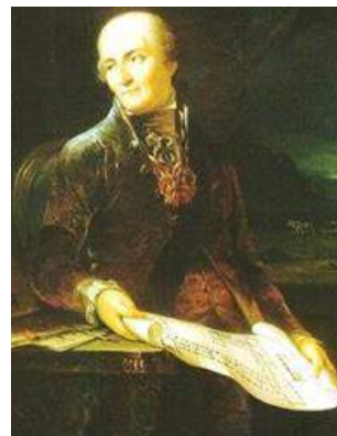
Антоній Тызенгаўз (1733–1785) – палітычны і грамадскі дзеяч ВКЛ, мецэнат, стараста Гродзенскі (1765–1776), ініцыятар будаўніцтва комплексу Гарадніца ў Гродне, стваральнік тэатра і тэатральнай школы, капэлы, заснавальнік батанічнага саду.

У 1765 годзе састаў капэлы быў невялікі, у 1776 годзе яна ўключала 22 выканаўцы і 8 вучняў, у 1777 годзе – 79, у гады росквіту калектыва – 30 музыкантаў і 7 вучняў.