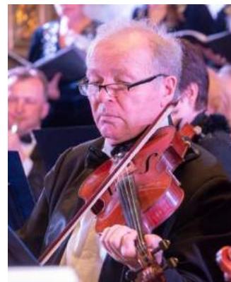
Камерны аркестр у Саборы Святога Францішка Ксаверыя сумесна з дзяржаўным камерным аркестрам і салістамі тэатра оперы і балета (г.Мінск). Дж. Пучыні. MESSA DI GLORIA. 2021 г.

Творчасць камернага аркестра была прадстаўлена на музычных форумах: фестывалі «Новая беларуская музыка» (Мінск, 1992), «Еўрапейскія музычныя сустрэчы» (Германія, 1994), «Фестываль хрысціянскай музыкі» (Нарвегія, 1994), «Мінская вясна» (Мінск, 1995, 2006), «Музыка І. С. Баха і А. Вівальдзі» (Расія, 1998), «Музыка Баха і Венскія класікі» (Расія, 1998), «Фестываль беларускай культуры» (Польшча, 2004), фестываль у г. Каліш (Польшча, 1992), «Белавежскія сустрэчы з арыяй» (2006–2015), «Маскоўскі Велікодны фестываль» (Масква, 2011), дні беларускай культуры ў Літве (2012), фестываль