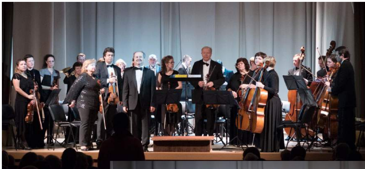
Выступ камернага аркестра і салістаў на сцэне канцэртнай залы Гарадскога цэнтра культуры, 2017 г. Гучалі творы Моцарта, Бяліні, Расіні і Чайкоўскага.