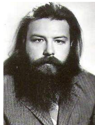
Андрэй Васільевіч Бандарэнка (1955) – кампазітар, педагог, член Саюза кампазітараў Беларусі, лаўрэат Дзяржаўнай прэміі (1994), Нацыянальнай прэміі «За духоўнае адраджэнне» (2003). Ініцыятар стварэння Гродзенскай капэлы, мастацкі кіраўнік капэлы (1992–1996). Узнагароджаны медалём Францыска Скарыны. У рэпертуары капэлы – сачыненні А. Бандарэнка: сімфонія для струннага аркестра, канцэрт-паэма для габоя, скрыпкі, віяланчэлі, фартэпіяна і камернага аркестра, «Прытча пра душу чалавечую» для салістаў, хора і аркестра, саната для флейты і фартэпіяна, струнны квартэт, шматлікія літургічныя сачыненні для хора і інш.

Андрэй Бандарэнка быў першым мастацкім кіраўніком капэлы (1992–1996).