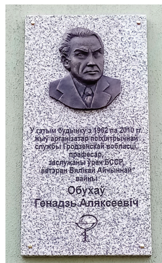
Мемориальная доска памяти