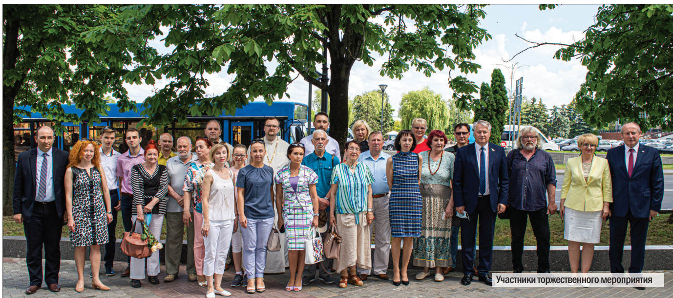
Участники торжественного мероприятия