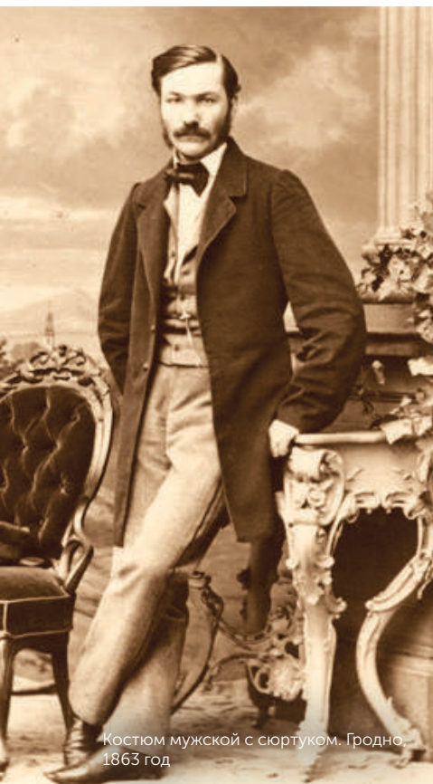
Костюм мужской с сюртуком. Гродно, 1863 год