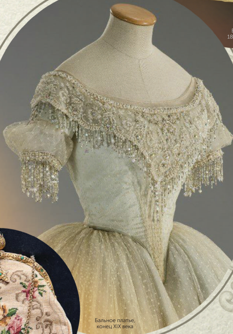
Бальное платье, конец XIX века