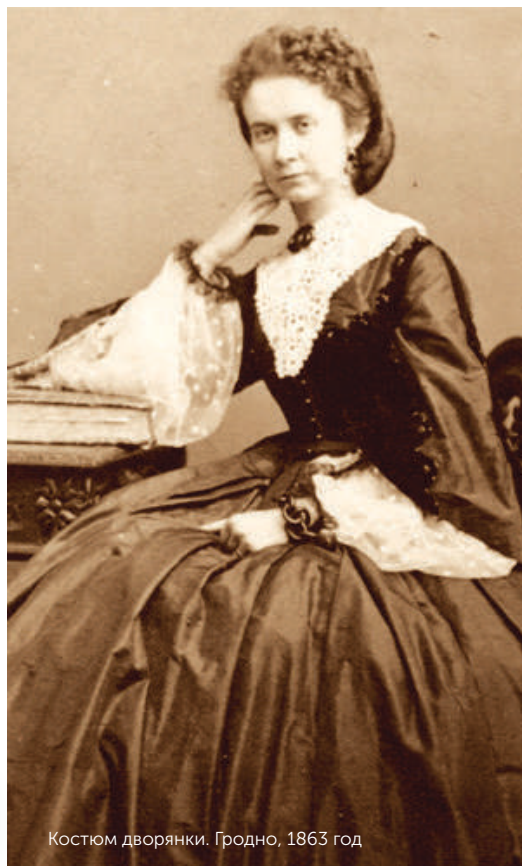
Костюм дворянки. Гродно, 1863 год