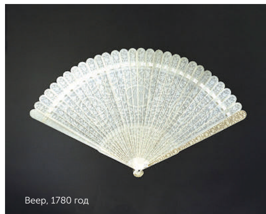
Веер, 1780 год

было трактовать по-разному: какое-то движение – буква или знак что-нибудь сделать. Резкое раскрытие веера и его быстрое закрытие означало «Уйди, не хочу тебя видеть», обмахивание левой рукой – запрет на заигрывание, а веер, поднесённый к губам, говорил, что спутнику не доверяют. Язык веера автоматически отсекал кандидатов, не находящихся в одном сословии с дамой: они просто не могли считать подаваемые им знаки.