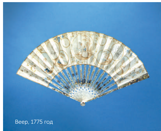
Веер, 1775 год