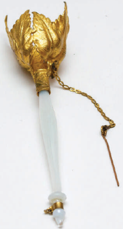
Портбукет, 1800 год

Дамы на балах часто пользовались специальными книжечками, куда вписывали названия танцев и имена кавалеров, которые их пригласили. Это было необходимо, чтобы не забыть и не пообещать один танец двум кавалерам – это не только считалось дурным тоном, но могло даже привести к дуэ-