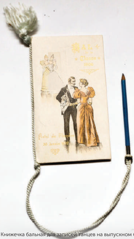
Книжечка бальная для записей танцев на выпускном балу, 1896 год