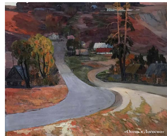
«Осень в Лососно»