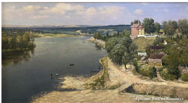
«Гродно. Вид на Коложу»