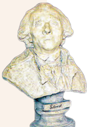
Бюст Жылібера, выкананы Андрэ ле Брунам, прыдворным скульптарам караля Станіслава Аўгуста Панятоўскага. Датуецца «пасля 1780-га». Неяк так ён і выглядаў, калі працаваў у Гродне.