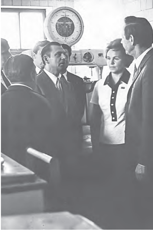
Первый секретарь ЦК КПБ Петр Машеров на одном из гродненских предприятий.

В 1967 году Указом Президиума Верховного Совета СССР за активное участие в партизанском движении, мужество и героизм, проявленные в борьбе с немецко-фашистскими захватчиками в годы Великой Отечественной войны, и успехи, достигнутые в восстановлении и развитии народного хозяйства, Гродненская область награждена орденом Ленина.