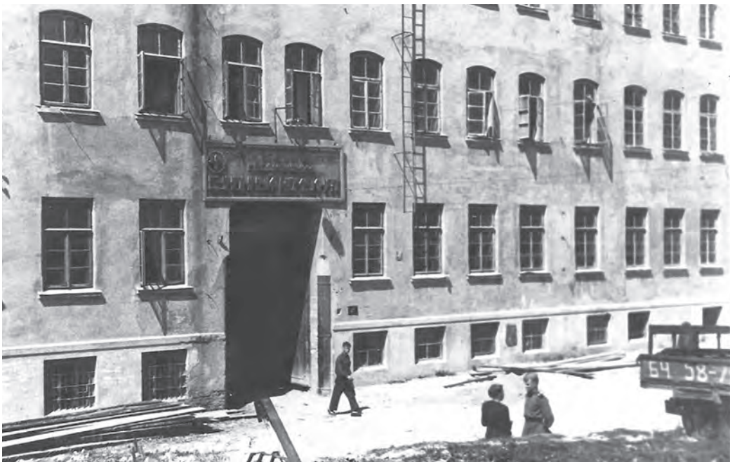
Гродненский тонкосуконный комбинат в 1950-е годы располагался на улице Мостовой.