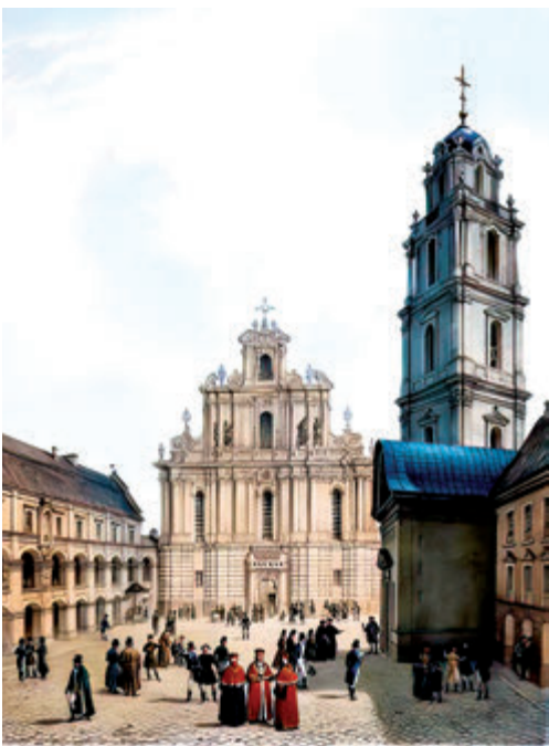
Касцёл Св. Яна Хрысціцеля і Яна Евангеліста, дзе маліўся ксёндз Юндзіл, выходзіць у двор універсітэта, дзе ён выкладаў.

«Не ў летуценніках мае патрэбу айчына, а ў стараных працаўніках на карысць асветы, якая ёсць галоўным інструментам адраджэння роднага краю», — гаворыць ён.