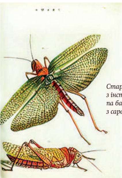
Старонка з інструкцыі па барацьбе з саранчай.

«У такіх акалічнасцях адважыўся я ўвесці ў курс Шчучынскай школы батаніку, пазбаўленую сухасці апісанняў, для чаго заклаў у Шчучыне батанічны сад, каб ён служыў спасціжэнню расліннай будовы і сістэматыкі. Гэта было маім першым і пакуль яшчэ слабым крокам, але...»