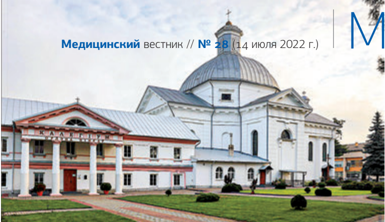
Шчучынскі калегіум, дзе выкладаў Станіслаў Баніфацый Юндзіл. Нашы дні.