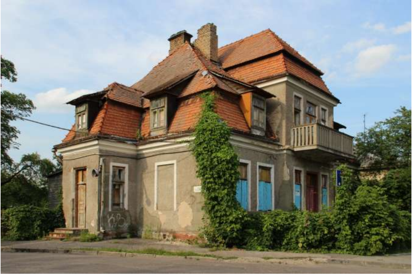
30. На жаль, у дадзены момант у будынку ідзе "рэканструкцыя" і мне страшна выкладаць здымкі цяпершняга стану дома, якія я выпадкова пабачыў у нэце. Лепей яшчэ раз паглядзім "якім ён хлопцам быў":