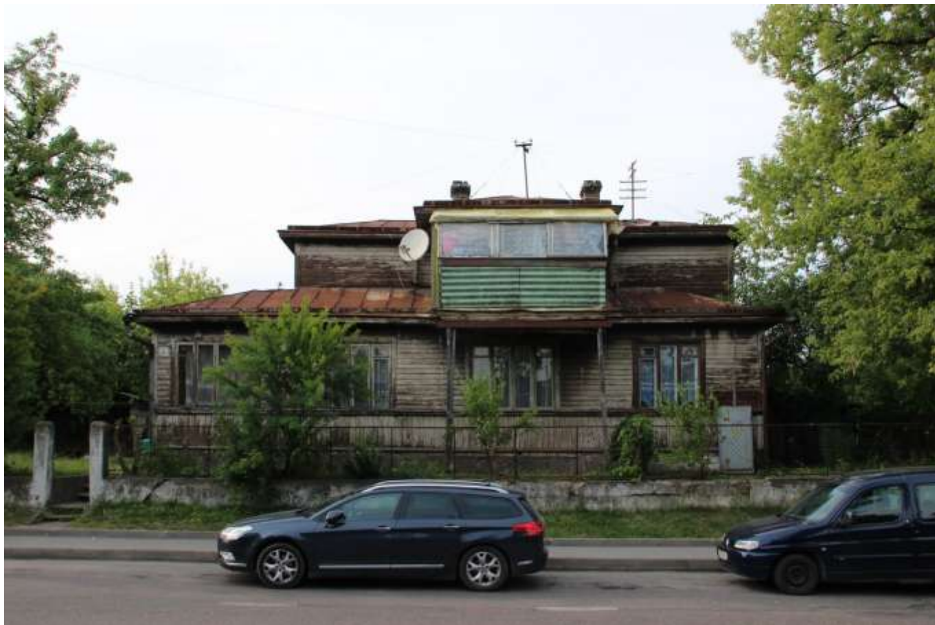
18. Яшчэ адзін мелкі бляхай крыты дамок вельмі падобны на міжваенны: