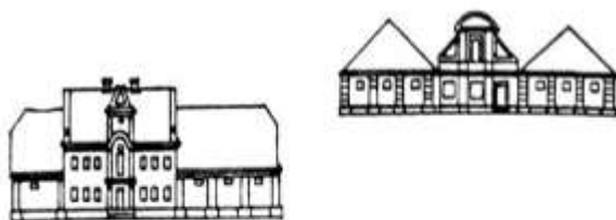
Гродзенскія корчмы «Галеча» (злева) і «Раскоша».

Пабудаваны ў 1770-я гады на галоўнай магістралі Гарадніцы (арх. Ю. Мёзер, Дж. Сака). Карчма «Галеча» складалася з кампактнага двухпаверховага мураванага будынка гасцініцы і выцягнутай прамавугольнай у плане драўлянай стайні з цагляным каркасам, якая прылягала да дваровага фасада гасцініцы. Будынкi былі накрыты высокімі двухсхільнымі дахамі. Уваход у гасцініцу вылучаўся цэнтральным рызалітам з фігурным франтонам.