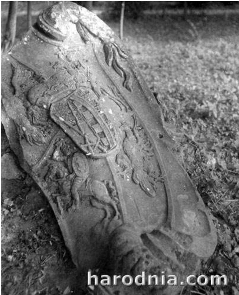
Герб Рэчы Паспалітай, выратаваны Ю. Ядкоўскім

Дзякуючы грашовай дапамозе гродзенскага старасты К.Рагалевіча, а таксама субсідыі Дэпартаменту мастацтва і крэдытам Аддзела мастацтва і культуры Беларускага ваяводства, ў памяшканнях, прызначаных для музея, быў праведзены рамонт. Урачыстае адкрыццё музея адбылося 9 снежня 1922 года з удзелам прадстаўнікоў Міністэрства веравызнання і публічнай асветы, гродзенскага старасты і сяброў Камісіі.