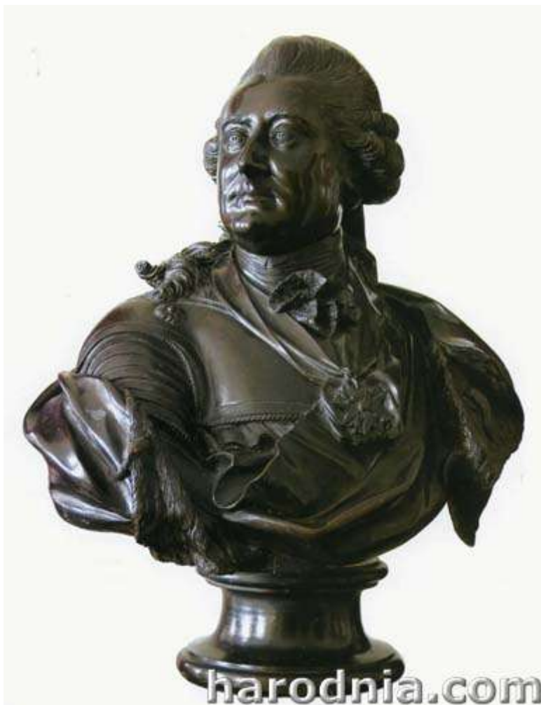
Бюст Станіслава Аўгуста Панятоўскага з дамініканскага касцёла

31 кастрычніка 1918 г. урадам Польшчы быў прыняты дэкрэт па апецы над помнікамі. Паводле яго на месцах ствараліся камісіі апекі над помнікамі. На пасяджэнні кіраўнікоў акруг і шэфам секцыі Грамадзянскага кіраўніцтва Усходніх зямель 22 студзеня 1920 г. была прынята пастанова аб арганізацыі нагляду над гістарычнымі помнікамі (у першую чаргу нерухомымі помнікамі). На падставе гэтага рашэння ў Гродне пры павятовым кіраўніцтве была створана Камісія апекі над помнікамі мастацтва і культуры.