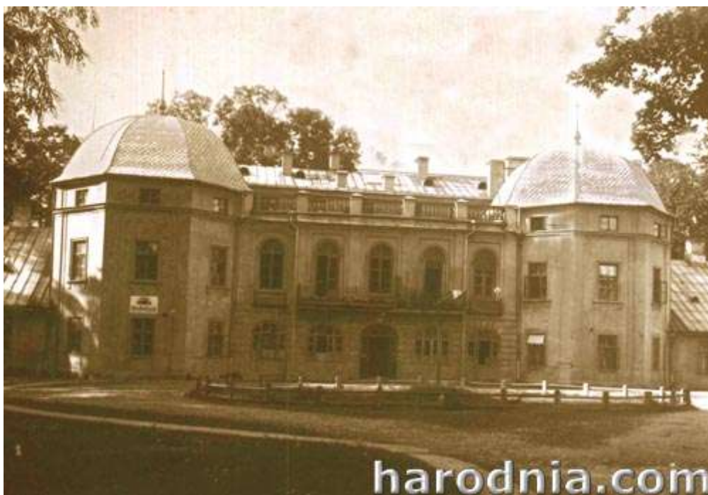
У гэтым будынку нарадзіўся Ю. Ядкоўскі

У артыкуле разглядаецца першы перыяд існавання музея, калі ён толькі пачынаў сваю дзейнасць: фарміраваў фондавыя калекцыі, ствараў першыя пастаянныя экспазіцыі, арганізоўваў выстаўкі, выдаваў справаздачы аб выніках працы, археалагічных даследаваннях і публікаваў навуковыя артыкулы, рабіў захады па пераводу і ўладкаванню музея ў Старым замку.