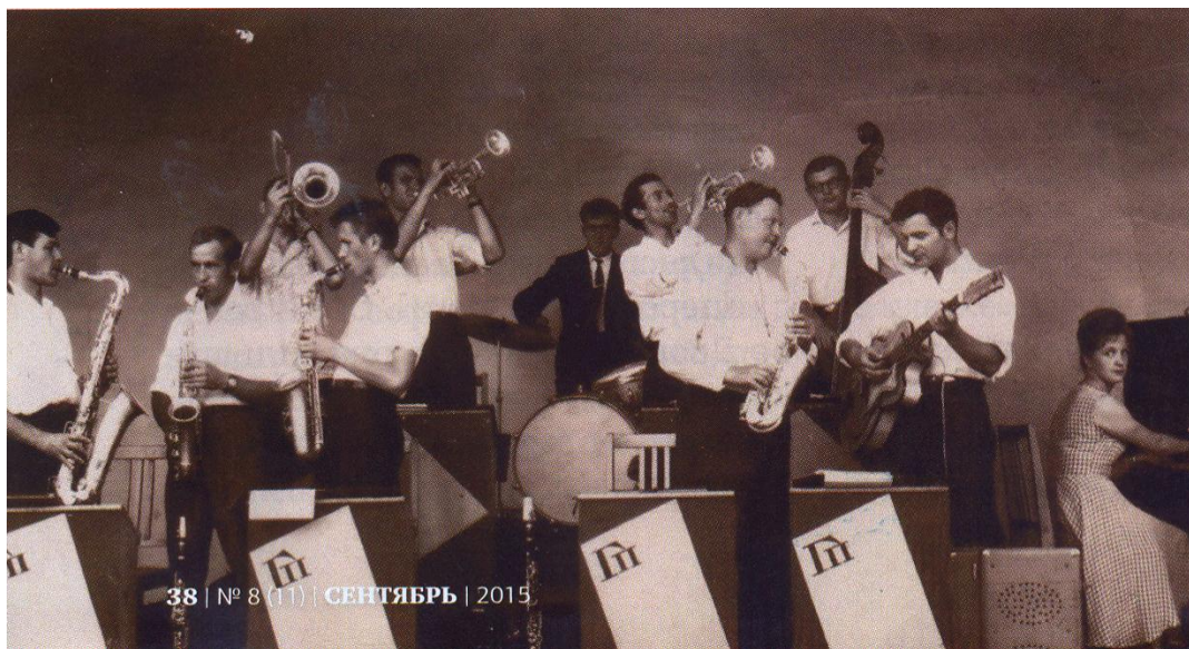
Эстрадный оркестр городского парка культуры и отдыха. Конец 1960-х гг.

В клубе строителей, называемом «стройкой», собиралась публика попроще, и нравы там царили демократичнее. Дом офицеров был причалом тех, о ком говорят: «Им за 30». Очевидно, по этой причине за весьма солидным в те годы клубным учреждением и закрепилось название «дом последних надежд». Ну а самая не обремененная интеллектом публика собиралась в «железнодорожниках», «стройматериалах».