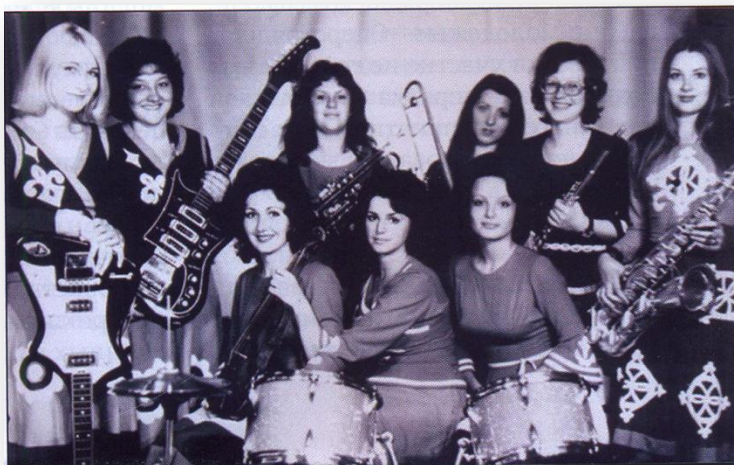
ВИА «Чараўніцы». 1970-е гг.