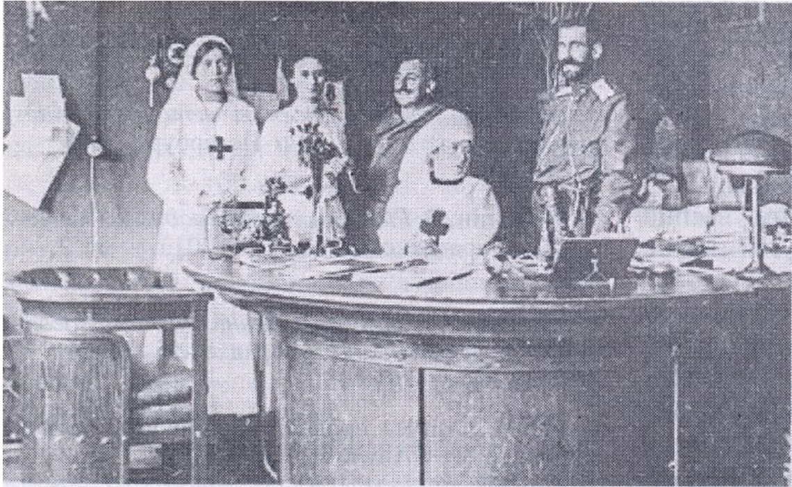
Прыезд Мікалая II у Гродзенскую крэпасць.

Асабліваю значнасць таварыства набывала ў перыяд ваенных дзеянняў, а менавіта падчас Руска-турэцкай (1877–1878), Руска-японскай (1904–1905), Першай сусветнай (1914–1918) войнаў. У гэтыя гады Таварыства ўдзельнічала ў арганізацыі медыцынскай дапамогі арміі, накіроўваючы падрыхтаваныя ім кадры, санітарны інвентар, правізію, вопратку, забяспечвала аказанне лячэбнай дапамогі і догляд у санітарных установах прыфрантавага боку, абсталёўваючы і ўкамплектоўваючы іх, выплочвала матэрыяльную дапамогу інвалідам вайны і сем'ям тых, хто загінуў.