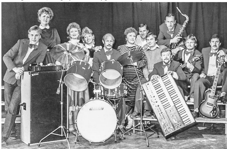
ВІА «Алыя зоры» завода «Радыёпрыбор». Канец 1970-х.

Асаблівае месца ў моладзевай культуры горада займалі ВІА, што гралі ў рэстаранах. У такіх калектывах выступалі таленавітыя хлопцы. Напачатку 1970-х вакальна-інструментальныя ансамблі рэстаранаў «Беларусь» і «Беласток» атрымалі права на прафесійную дзейнасць і пачалі выступаць як калектывы гастрольна-канцэртнага аддзялення Белдзяржфілармоніі. У рэстаране «Беларусь», які адкрыўся ў канцы 1960-х на вуліцы Горкага, безумоўным лідарам ВІА быў Віктар Маркаў. Спявак і музыкант, кар’ера якога пачыналася ў Гродне, стаў потым вядомым расійскім музычным прадзюсарам (у прыватнасці, прадзюсарам сваёй жонкі, вядомай спявачкі Таццяны Маркавай), кіраўніком гурта «Альфа».