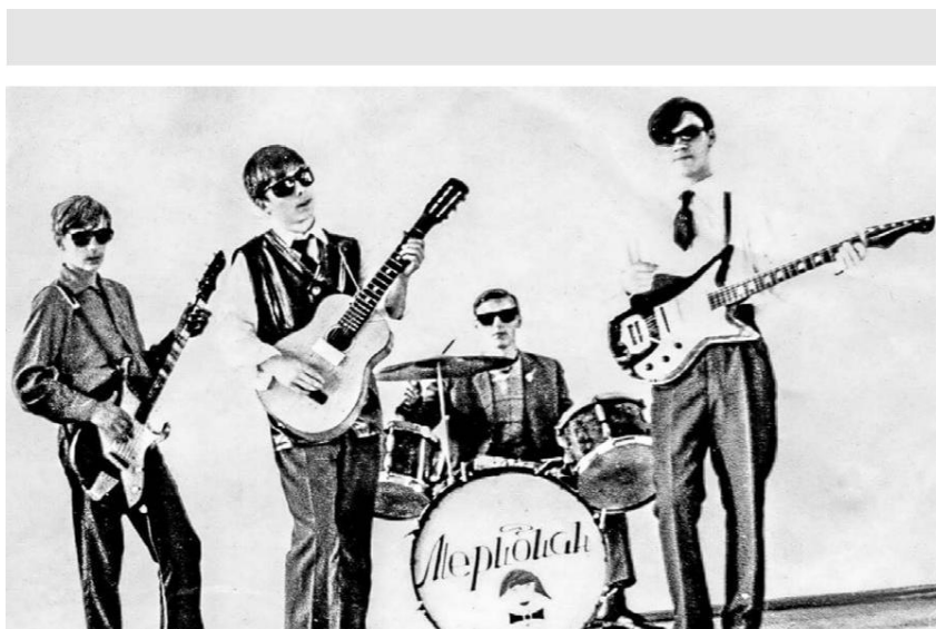
Гродзенскі Abbey Road. Пачатак 1970-х.

Як згадвае Міхаіл Гуленін, моладзь часта збіраліся ў лесапарку Пышкі на эстрадзе, дзе можна было падключыць апаратуру, паіграць і паспяваць. Але аднойчы там з'явіліся «аператрадаўцы» і ўсіх падстрыглі. Пасля такога вырашана было правесці акцыю пратэсту. Да рашэння далучыліся хіпі Вільнюса, Таліна, Рыгі. І вось у жніўні 1971-га па цэнтральных вуліцах Гродна прайшла дэманстрацыя хіпі. Чаму ў Гродне?