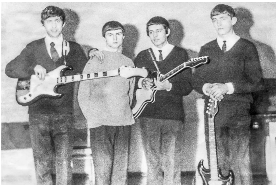
ВІА «Ліра». 1960-я.

Стары ўтульны парк сапраўды быў цэнтральным месцам адпачынку гараджан. Па вечарах, асабліва ў выхадныя дні, прайсціся па галоўных аляях парка можна было толькі добра працуючы локцямі. Атрымліваць асалоду ад цішыні, гуляючы па цяністых аляях, — гэта было справай дзённай. Вечарам выходзіла моладзь, і многія юнакі неслі ў руках пераносныя транзістарныя радыёпрыёмнікі «Селга» або «Спідола» вытворчасці рыжскага радыёзавода з высунутымі антэнамі. З усіх гэтых шматлікіх радыёпрыстасаванняў несліся мелодыі папулярных песень заходніх ВІА.