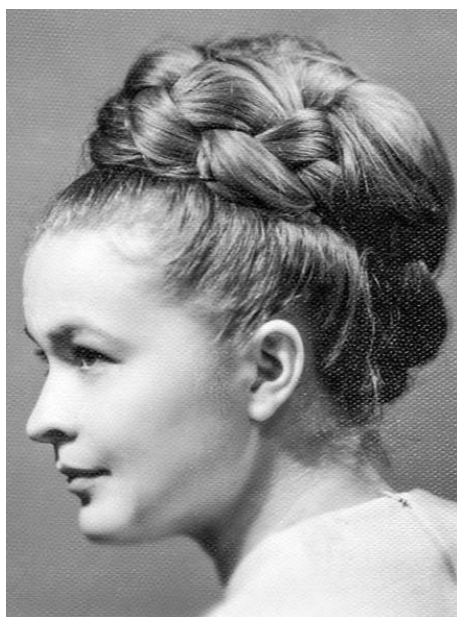
Аднакласніца Тоня з прычоскай «Бабета». 1960-я.

сярэдзіны 1960-х у СССР у моду ўвайшлі спадніцы-міні, самыя адважныя савецкія дзяўчаты насілі супер-міні.