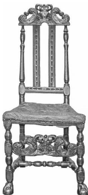
Разьба на крэсле выканана пад уплывам барочных форм, якія пачалі актыўна распаўсюджвацца ў аздобленні мэблі з сярэдзіны XVII стагоддзя.

Сядзенне трапецыяпадобнай формы, звужаецца ў накірунку да спінкі крэсла. Само сядзенне набіта конскім воласам і абцягнута тонкай, добра вырабленай, хутчэй за ўсё цялячай, скурай чорнага колеру. Скура прымацавана да каркаса крэсла дэкаратыўнымі цвічкамі з вялікімі плешкамі. Ніжняя аснова сядзення з тканіны і моцных тканых лянных палосаў.