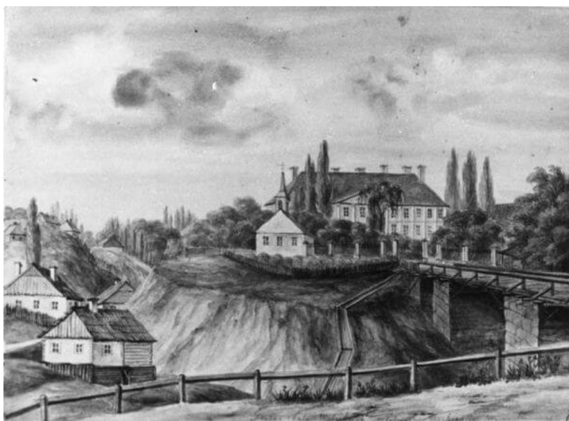
Дворец Тизенгауза. Рис. Наполеона Орды

Источник публикации: Канюк, Н. Машина времени: похищение на Городнице [Электронный ресурс] / Наталья Канюк // Вечерний Гродно: [Сайт]. — Режим доступа: http://vgr.by/home/society/19504-mashina-vremeni-pokhishchenie-na-gorodnitse . — Время доступа: 03.01.2017.