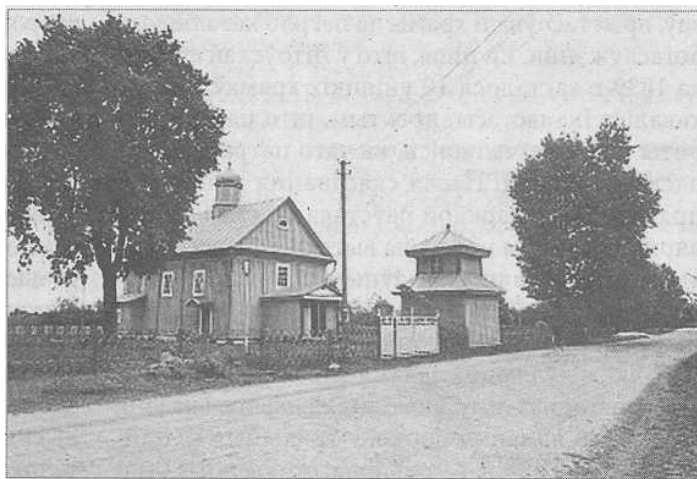
Царква Раства Божай Маці ў вёсцы Ляскавічы Іванаўскага раёна Брэсцкай вобласці. 1783 г.

Драўляная царква Раства Божай Маці ў вёсцы Ляскавічы Іванаўскага раёна, адкуль паходзяць гродзенскія саламяныя вароты, была пабудавана ў 1783 г. Да пачатку 1830-х г., як пісаў К. К-скі, царква “благодаря свому фундатору Оржешко, была вполне костелом” [5, с. 359] - гэта значыць, што яна была ўніяцкай. Царкву перарабілі для богаслужэння па грэка-ўсходнім абрадзе яшчэ перад скасаваннем уніі. Вядома, што ў 1832 г. тут мелася ўсё патрэбнае абсталяванне і аблачэнне па праваслаўным абрадзе, аднак не хапала іканастаса, і настояцель павінен быў знайсці сродкі для яго набыцця і ўсталявання [5, с. 359]. Напэўна, бедны сялянскі прыход не меў багатага фундатара і не здолеў сабраць грошы, неабходныя для вырабу разнаго і пазалочанага іканастаса, як было прынята ў праваслаўнай традыцыі. Іканастас рабілі ўласнымі сіламі прыходскіх вяскоўцаў, і царскія вароты былі сплечены з самага даступнага матэрыялу – з жытняй саломкі, чый колер нагадвае сапраўднае золата.