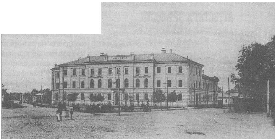
Паштоўка “Яраслаўская мужчынская гімназія”.

На жаль, пра другога аднакласніка і найлепшага сябра Максіма Багдановіча, якога называе Ц. Гodneў, інфармацыі няма. Атэстат сталасці адсутнічае, гэта можа сведчыць пра тое, што гімназіст Ушакоў застаўся на другі год і скончыў гімназію пазней, чым М. Багдановіч, сябра мог кінучь вучобу і не атрымаць атэстат сталасці. Аднакласнік паэта мог пераехаць у іншы горад, працягваць навучанне ў іншай установе.