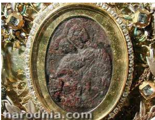
Абраз Маці Божай Жыровіцкай

Айца Ігната Кульчынскага, архімандрыта гродзенскага базыльянскага Каложскага манастыра, справядліва лічаць заснавальнікам беларускага краянаўства. Яго творы па гісторыі Каложскай царквы і Жыровіцкай іконы Маці Божай з’яўляюцца важнымі крыніцамі па гісторыі гэтых святыняў.