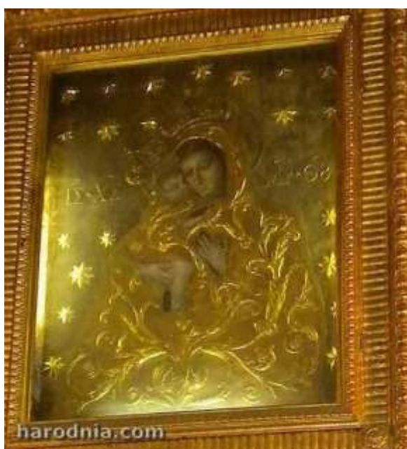
Абраз Маці Божай Жыровіцкай. Цудатворная рымская копія, захоўваецца ў Рыме, у грэка-каталіцкай царкве св. Сергія і Вакха

Прысутнасць гісторыка і царкоўнага дзеяча ў Рыме супала з узрастаннем культу Маці Божай Жыровіцкай. У жніўні 1718 годзе ў рымскай царкве Сергія і Вакха падчас рамонту пад тынкам на адной са сцен выпадкова быў выяўлены абраз Маці Божай, які ідэнтыфікаваны як копія іконы Маці Божай Жыровіцкай. Сярод рымскага людю абраз стаўся вельмі папулярным пад назвай Madonna del Pascolo .