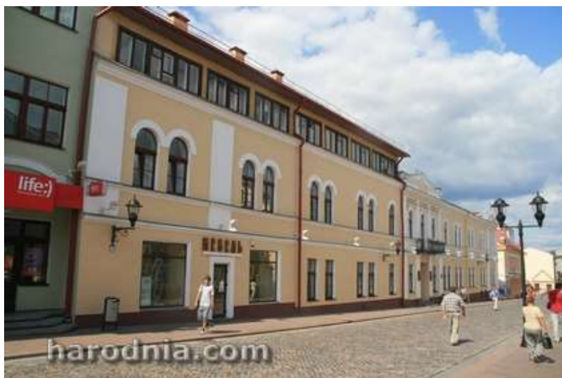
Сённяшні выгляд кляштара Святога Духа

У візітацыі 1662 г. сцвярджаецца, што касцёл св. Тройцы быў спалены Масквой (а Moschis combusta) 60. Калі не захавалася аўгусцінцаў і францішканцаў, а найверагодней не засталася і касцёла, яго прыбыткі пераняў прытулак св. Духа. У візітацыі 1662 г. фундацыя прытулку св. Тройцы была ўпісана да фундацыі прытулку св. Духа, было загадана ўтрымліваць агулам у абодвух прытулках 30 жабракоў 61. Частку прыбыткаў св. Тройцы перадалі мансіянарыям. У 1662 г. згадваецца ўласнасць касцёла св. Тройцы, які больш не дзейнічаў, – 16 зямельных надзелаў з садоўнікамі, якія мелі з кожнага надзелу адпрацоўваць 12-дзённую адпрацоўку і плаціць па палове залатога чыншу. Гэтыя прыбыткі былі прызначаны мансіянарыям 62. У 1673 г. афіцыйна быў скасаваны гарадзенскі кляштар аўгусцінцаў 63.