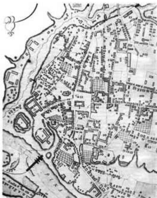
Касцёл св. Духа (8) на плане цэнтральнай часткі горада 1795 года

19 кастрычніка 1550 г. у Варшаве каралева Бона прызначыла фундацыю горадзенскаму касцёлу і прытулку св. Духа, каб паклапаціліся жабракамі і пакрыўджанымі. У Гародні быў выдзелены ўчастак Puskarzewska з пабудовамі, дзе меў быць заснаваны прытулак, каб жыць 24 жабракам любога полу і іх абслугоўваючым. З горадзенскага маёнтку ім штогод на харчаванне мелі даваць 40 бочак жыта, 8 бочак гароху, 10 бочак звычайнага зерня на суп, 4 посуды солі, 20 бочак звычайнага зерня на піва. На сала, масла і сыр 15 коп грошай. 4 посуды салёнай рыбы, 5 бочак канаплянага семя, 1 бочка маку, 7 посудуў квашанай капусты, 14 посудуў свежай капусты, 18 бараноў, 16 галоў буйной рагатай жывёлы. Таксама на Вялікдзень даваць 28 навесаў (каптуроў),