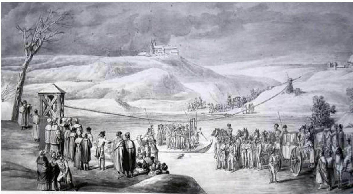
Прыезд караля ў Гродна, студзень 1795 г.

Кароль жыў на другім паверсе Новага Замка з агульнай світай каля 200 чалавек. Гэта былі лекар, сакратар і камердынер, а таксама шматлікая служба. Палац строга ахоўваўся расійскімі жаўнерамі. Дзяжурны афіцэр пастаянна складаў рапарты для начальніка гродзенскага гарнізона князя Цыцыянава. Забаронены былі любыя сходы, каралеўская перапіска кантралявалася. Нават ночу ў суседнім ад каралеўскай апачывальні пакоі знаходзіліся каралеўскія шамбеляны.