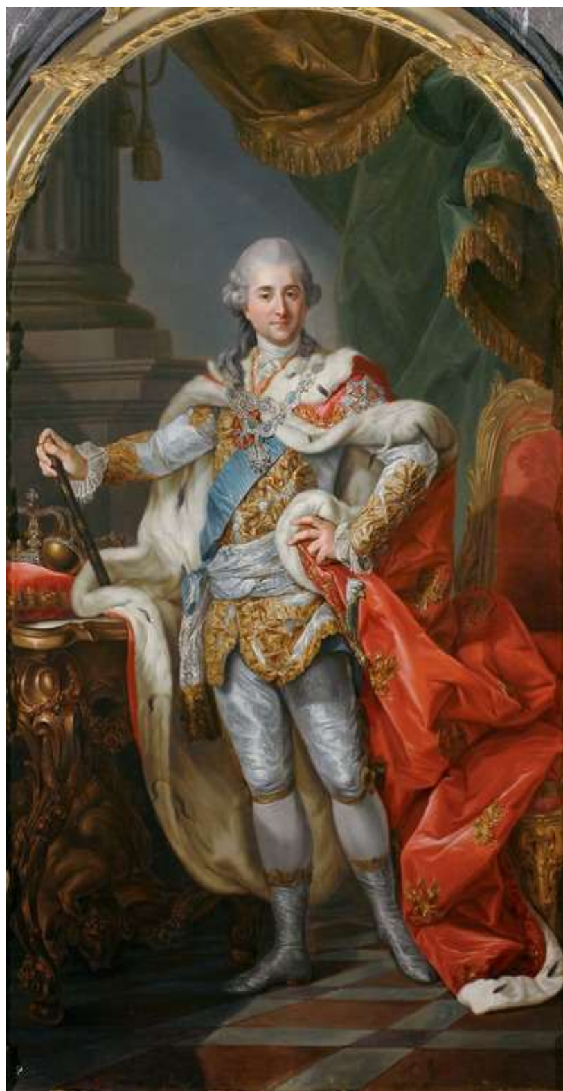
Станіслаў Аўгуст Панятоўскі