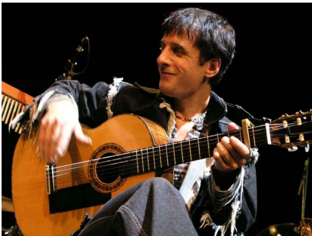
Валерий Дидюля. Белорусский гитарист и композитор, лидер группы «Дидюля». Родился в 1969 году

Наш с вами современник не нуждается в представлении. Дидюля является автором более 120 инструментальных композиций, сочетает в одном лице композитора, исполнителя собственных произведений и продюсера проекта «Дидюля». «Дидюля» является самым гастроллирующим инструментальным коллективом России (120 концертов в год).