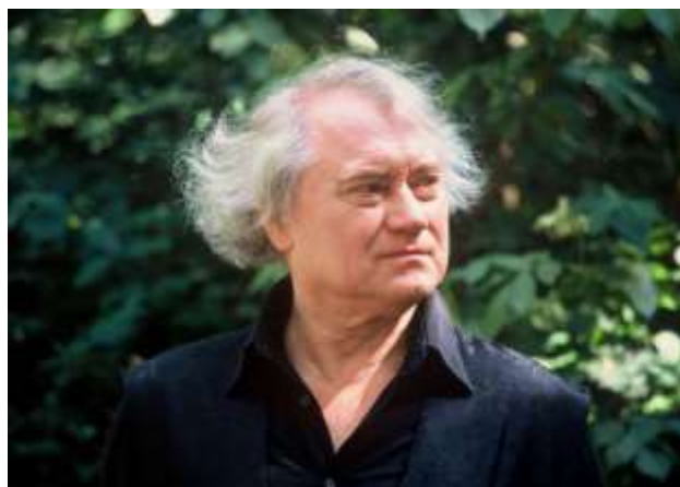
Ежи Максимиук. Польский дирижёр, композитор и пианист. Родился в 1936 году

С 1983 по 1993 год Ежи Максимиук исполнял обязанности главного дирижёра Шотландского симфонического оркестра BBC, с которым ежегодно принимал участие в променадных концертах в лондонском Альберт-холле. Записи этого оркестра под управлением Максимиука дважды становились лучшими записями года по версии журнала Gramophone. Максимиук