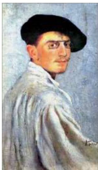
Леон Бакст. Художник, сценограф. 1866-1924

В мировую историю он вошел как Великий русско-французский театральный художник. Если кто еще помнит со школьной программы «Русские сезоны» Дягилева, которые прославили русский балет на весь мир, то знайте всю сценографию (декорации и т.п.) создал художник еврейского происхождения родом из Гродно. И что еще вам будет интересно знать: у Бакста учился сам Шагал. Бакст даже запрещал ему переезжать в Париж. Мол, искусство его там не будет востребовано, а театральными декорациями такому таланту заниматься не с руки. Тот его не послушал и добился еще большего успеха, чем учитель.