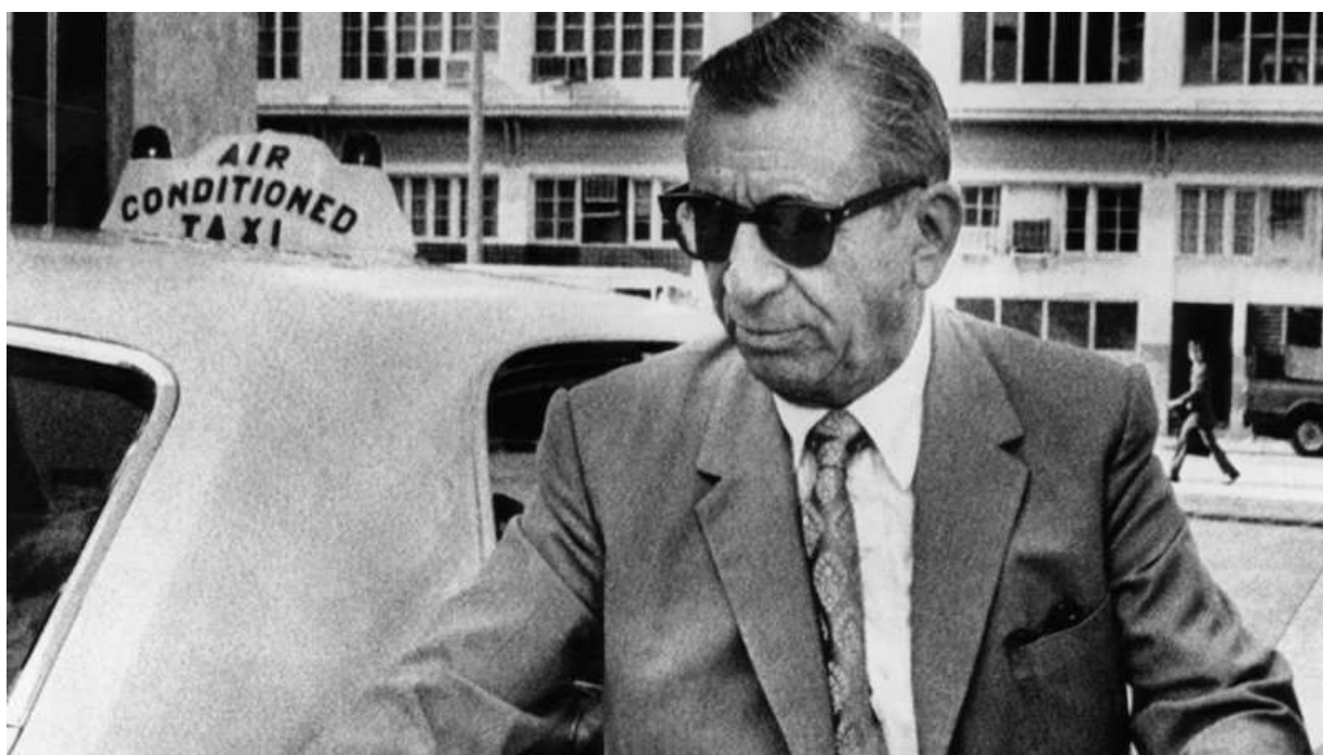
Меир Лански. Лидер американской мафии. 1902-1983