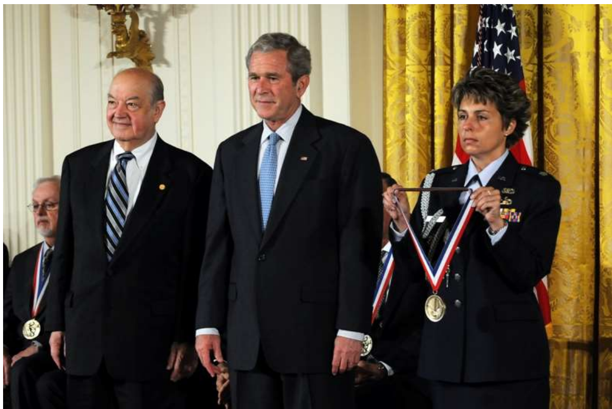
Пол Бэрэн. Один из создателей Интернета. 1926-2011. Пол Бэрэн на фото слева

Вся жизнь Врублевского может служить прекрасным примером редкой настойчивости в достижении задуманного и в добросовестном исполнении принятых на себя обязанностей. Замешанный в смуте 1863 года он был вынужден 18-летним юношей оставить Киевский университет и отправиться в ссылку в Сибирь. После ссылки учился сначала в Берлине, затем в Гейдельберге. Уроженца Гродно пригласили на кафедру физики в Краков, где совместно с Каролом Ольшевским впервые в истории получил в измеримых количествах жидкий кислород.