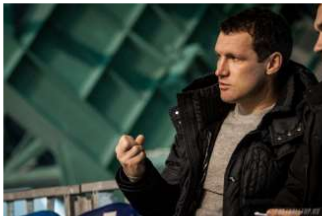
Сергей Гуренко. Футболист. Футбольный тренер. Родился в 1972 году

Пожалуй, самый известный и успешный футболист родом из Гродно. Был капитаном сборной Беларуси. Успел поиграть в Италии (Рома, Парма, Пьяченца), Испании (Реал Сарагоса), а в московском Локомотиве болельщики клуба признавали его лучшим игроком сезона. Признавался лучшим игроком Беларуси 1999 года. За карьеру успел завоевать кубок Беларуси, Испании, Италии, стать чемпионом России, Суперкубка и трижды кубка этой страны.