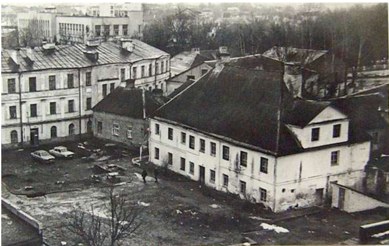
Будынак лясной адміністрацыі

Адным з іх з'яўляецца будынак былой лясной адміністрацыі. Паводле адшуканага беларускім архітэктарам-рэстаўратарам Валянцінам Калніным плане Гарадніцы, падрыхтаваным каля 1780 г., згаданы будынак знаходзіўся на задворках паўночнай часткі забудовы цэнтральнай плошчы Гарадніцы. Ён стаяў на задворках тэатральнай афіцыны, якая ў літаратуры шырока вядома пад назвай Крывой афіцыны, і меў выконваць функцыю стаеннай афіцыны.