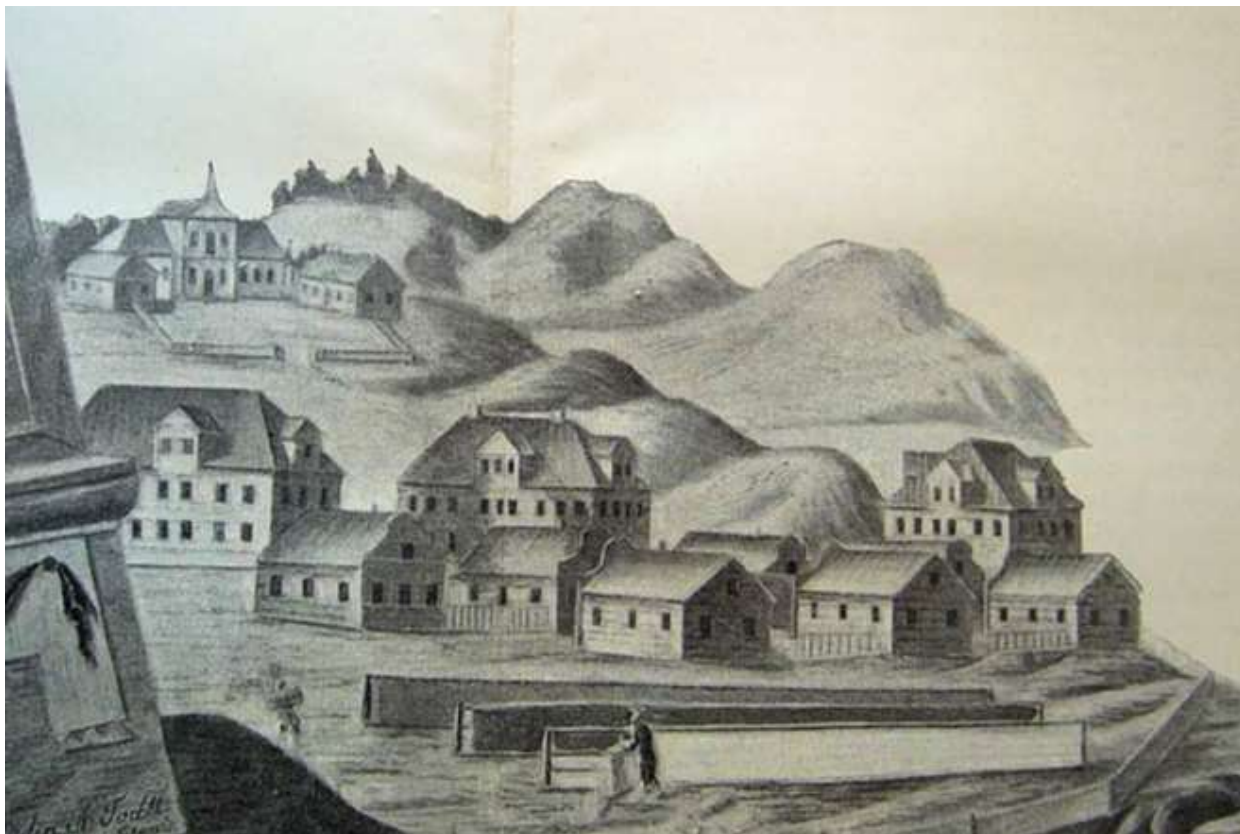
Гарадніца ў 1789 г.

Гарадніца – выдатны прыклад шырокамаштабнага горадабудаўнічага комплексу XVIII ст. Менавіта тут упершыню ў 70-х гады XVIII ст. былі выкарыстаны новыя метады праектавання. Гарадзенскае прадмесце Гарадніца ператварылася ў сучасны асяродак, а аб высокіх тэмпях будаўнічых прац сведчыць забудова каралеўскага двара 85 будынкамі адміністрацыйнага, культурнага, жылога і прамысловага прызначэння. Праектам распланавання і забудовай гарадніцкага ансамбля займаліся дрэздэнскі архітэктар Іаган Георг Мёзэр і італьянец з Вероны Джузэпе Сака.