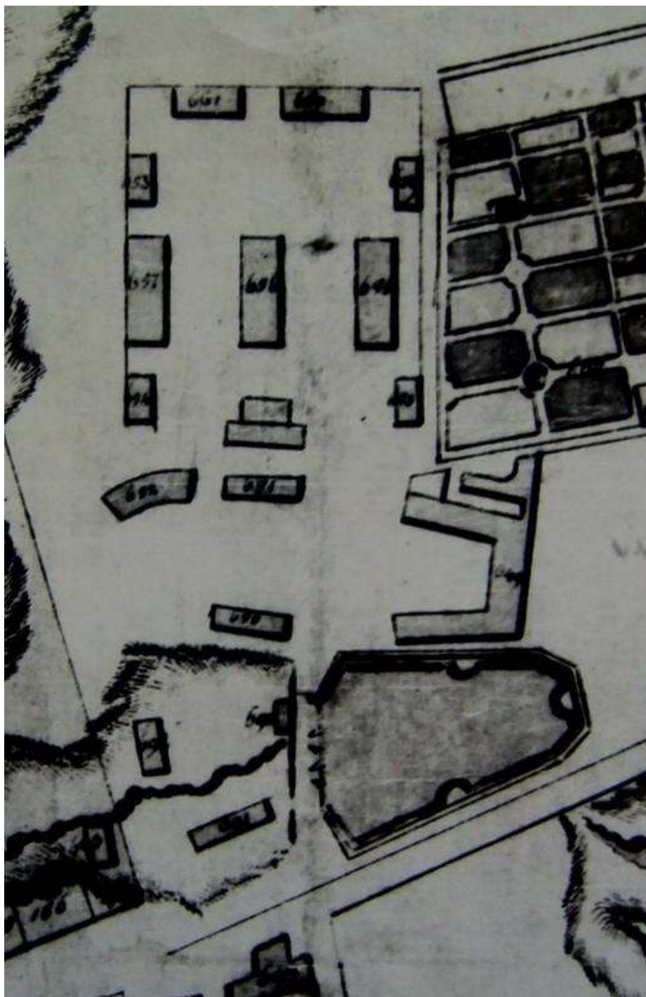
Забудова цэнтральнай плошчы Гарадніцы. План 1780 г.

Прыклад рэстаўрацыі забудовы Гарадніцы – нешматлікія. Ім з’яўляецца будынак былых складоў на вуліцы Дзяржынскага, перабудаваны ў рэстаран Стары лямус. Гэты ўдалы прыклад накірункаў развіцця горадабудаўнічага комплексу Гародні.