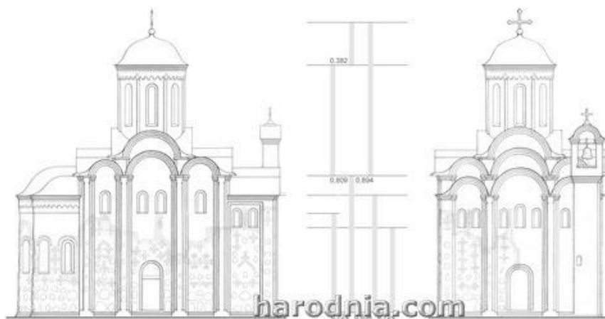
Выгляд Каложы па версіі Ул. Бачкова

Усе гэтыя варыянты маюць некаторыя агульныя рысы, але наогул вельмі моцна адрозніваюцца адзін ад другога. І гэта зразумела – нават першыя выявы царквы на гравюрах другой паловы XVI ст. ужо паказваюць нам храм, які страціў свой пачатковы выгляд за чатыры стагоддзі існавання. У дадатак да ўсяго ў сярэдзіне XIX ст. храм настолькі моцна разбурыўся, што мы страцілі магчымасць нават даследаваць гісторыю перабудоваў паўднёвай і часткі заходняй сцяны будынка, а таксама раскапаць ягоныя падмуркі ў гэтым месцы. Ацалела толькі некалькі малюнкаў Каложскай царквы, зробленых незадоўга да разбурэння. Усе яны, калі паглядзець на заходні фасад храма, адлюстроўваюць адну вельмі цікавую акалічнасць – гэты фасад царквы быў не сіметрычны. З правага боку (калі стаць тварам да храма) добра відаць вельмі шырокую, нехарактэрную для царквы лапатку. З левага ж боку лапатка звычайная, вузкая, такая самая як і на іншых сценах Каложы. З даследчыкаў, якія спрабавалі аднавіць выгляд храма, на гэтую акалічнасць звярнуў увагу, здаецца, толькі Ул. Бачкоў, які на сваёй рэканструкцыі прадоўжыў гэтую лапатку-плоскаць невялікай плоскай вежачкай, якая “вырастае” са сцяны. Такія “плоскія” званіцы характэрныя для пскоўскай архітэктуры, на такую званіцу нельга было ўзлезці, званар стаяў на зямлі.