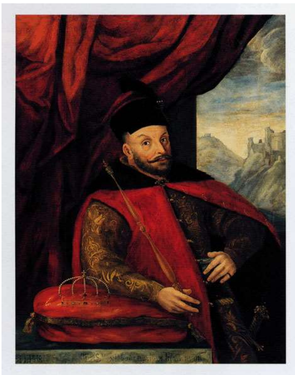
Кароль Стэфан Баторый акурат са згаданым Кіхэлем пяром чаплі ў шапцы

самотная корчма, у якую мы трапілі недзе ў 2 гадзіны дня і пакармілі коняў. Адтуль давялося ехаць 4 мілі. Мы не маглі марудзіць, бо не заставалася ніякіх запасаў яды, а коням ад гарачыні зрабілася кепска. І так 25-га [чэрвеня] добрым часам прыйшлі мы ў Горадню – адкрыты горад без муроў, проста пад якім працякае рака Мемель (Нёман), што вядзе да Коўна, гораду ў Літве. Згаданай ракой можна трапіць да Караляўца. Яго вялікасць польскі кароль мае ў гэтым гарадку Горадня свой дом, які загадаў пабудаваць зусім нанова. І хоць той яшчэ не даведзены да канца, кароль тут многа спыняецца, бо мае добрую магчымасць папаляваць. Да апошняга у яго каралеўскай вялікасці асаблівае жаданне і ахвота, так што нярэдка на працягу 8 дзён [ён] не вяртаецца у горад.