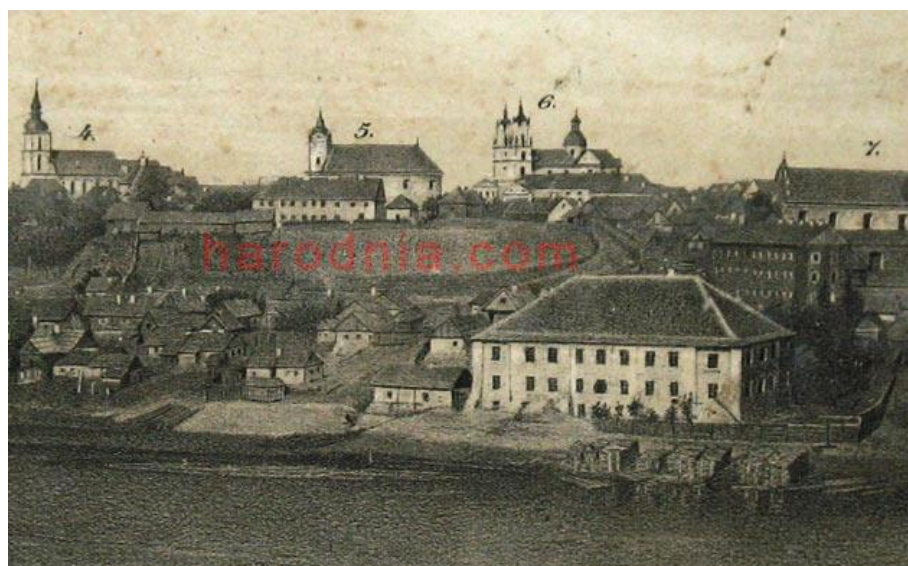
Вуліца Садоўніцкая з палацам Сапегаў (цяперашнім піўзавадам). 1860-я гг.