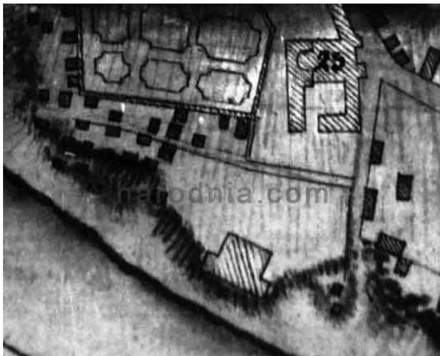
Забудова Садоўніцкай вуліцы. На беразе Нёмана - палац. Фрагмент плана Гародні 1812 г.

J. Rozmus, J. Gordziejew, Smentarz farny w Grodnie 1792-1939, Krakow 1999, s. 1023.