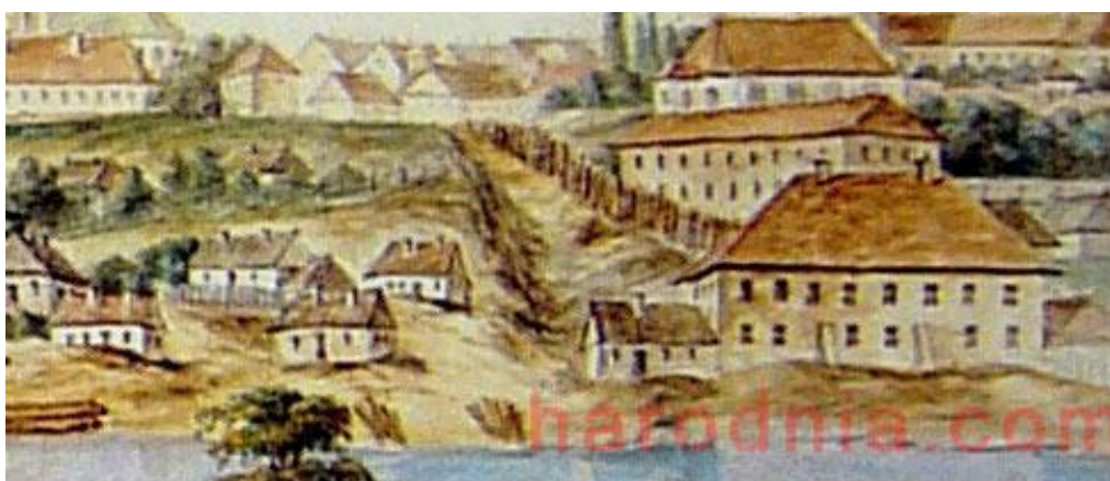
Забудова даўняй вуліцы Садоўніцкай Фрагмент малюнка Напалеона Орды. 1860-я гг.