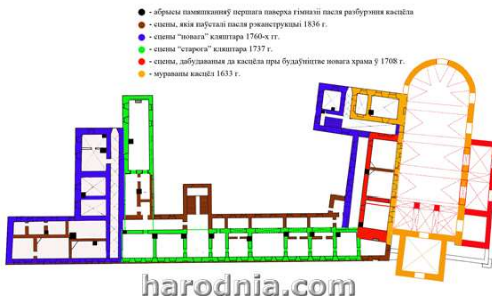
План комплексу дамініканскага кляштара ў Гродне (частка па вуліцы Савецкай).

1. Этапы будаўніцтва дамініканскага касцёла і кляштара. Рэканструкцыя Ігара Лапехі