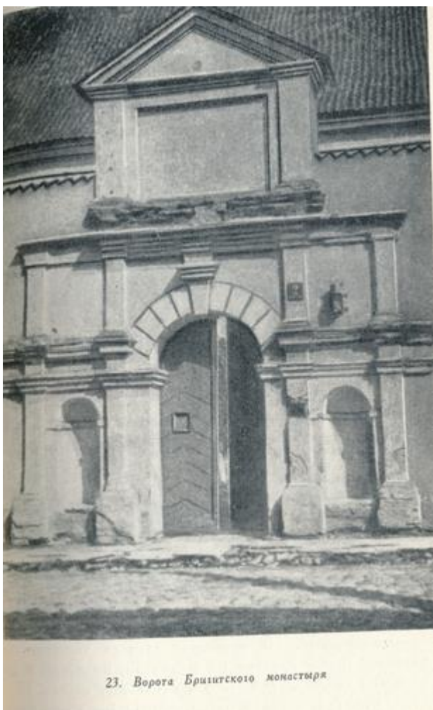
23. Ворота Бригитского монастыря

При основном западноевропейском характере архитектуры храма мы видим здесь проникновение духа национального народного творчества белорусских мастеров, проявившегося в оригинальной обработке капителей и пилястр и в богатстве резных декоративных украшений интерьера. Нам не известны имена мастеров-резчиков, работавших в этом костеле, но можно не сомневаться в том, что среди них были прославленные в свое время белорусские мастера.