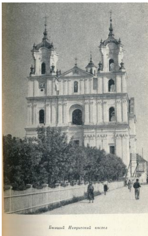
Бывший Иезуитский костел

Центр города в XVII веке был укреплен сооружением двух громадных костелов (Фарного и Иезуитского и ратуши). На главных взаимно-перпендикулярных улицах, переходивших в дороги на Вильнюс и Каунас, были расположены Бригитский и Доминиканский монастыри с костелами, на Занеманском форштадте, на высоком берегу перед мостом встал Францисканский