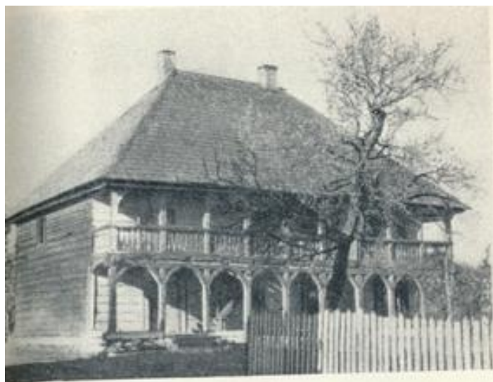
24. Деревянное строение XVII века во дворе Бригитского монастыря

В комплексе Бригитского монастыря обращает на себя особое внимание деревянное строение XVII века, находящееся глубине монастырского двора. Это здание было построено раньше каменного кляштора с костелом и предназначалось в качестве общежития монашенок-бригиток. Сохранившись до настоящего