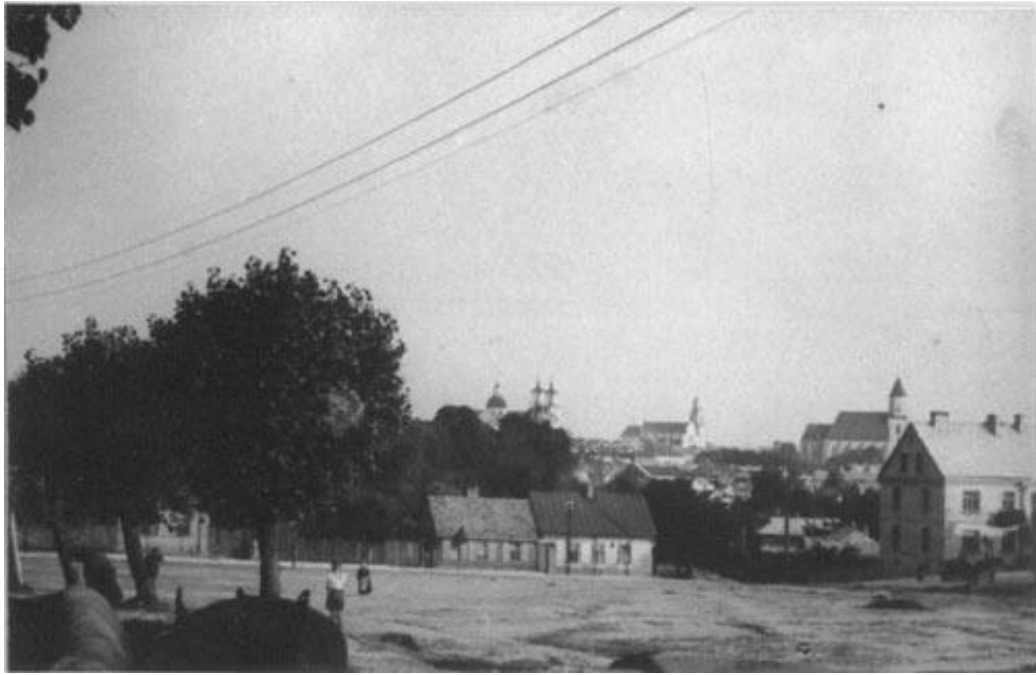
Дроўны рынак канец 1930-х гг.