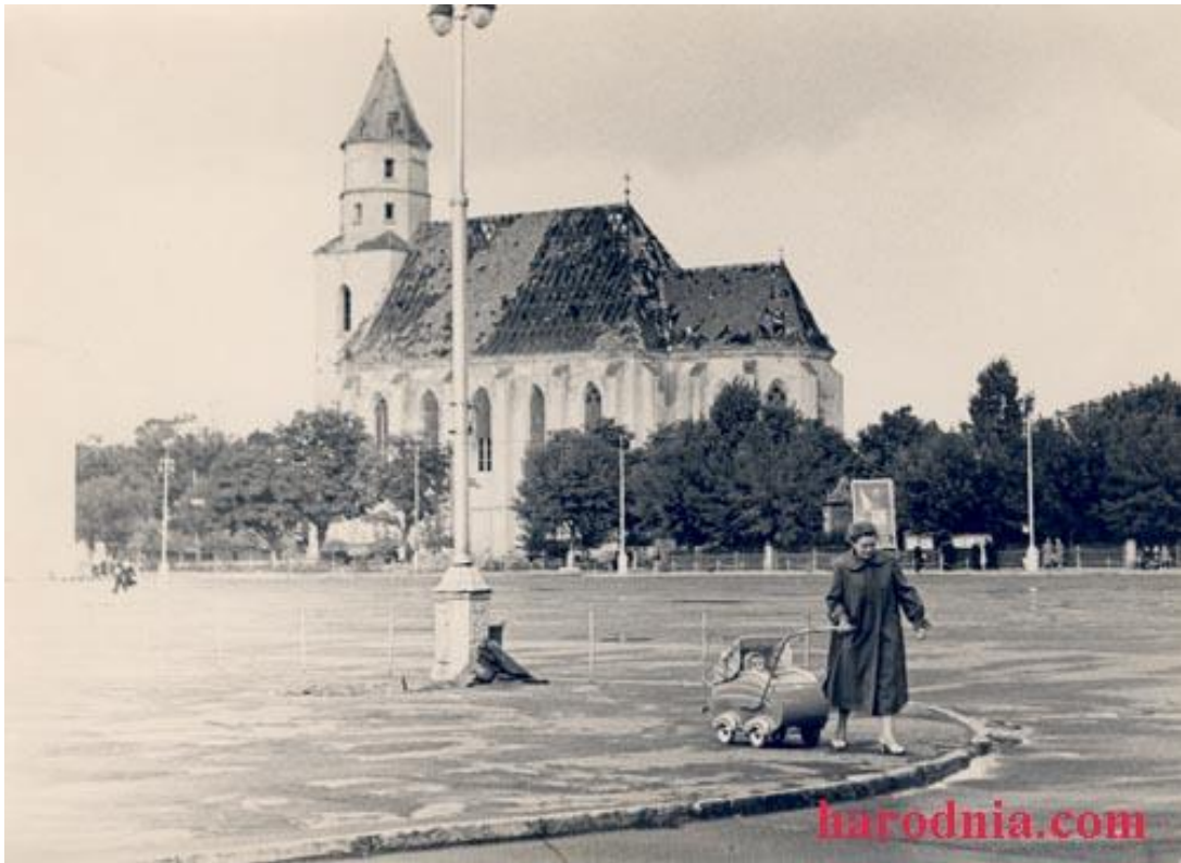
Так выглядала галоўная святыня горада незадоўга да знішчэння