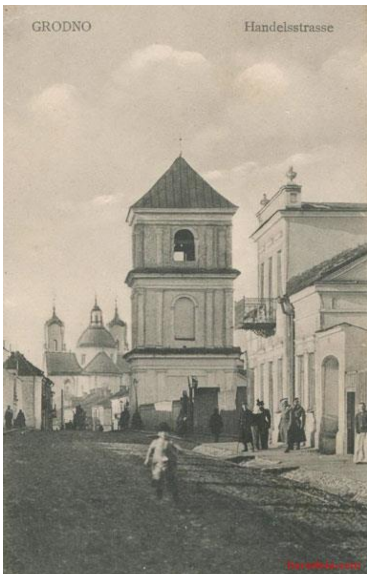
Званніца Брыгіцкага касцёла