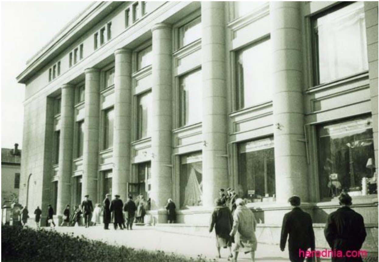
Здание универмага, построенное на месте гостиницы «Европа»

Культурная жизнь города послевоенного периода была насыщенной. Объявления в газете сообщали о гастролях Краснознаменного имени А.В. Александрова ансамбля песни и пляски Советской Армии, Ровенского музыкально-драматического и Каменец-Подольского театров, Одесского государственного цирка. А во дворе кинотеатра «Красная звезда» была открыта танцевальная площадка. Зрители имели возможность перед сеансом отдохнуть на скамейках на свежем воздухе, послушать музыку и потанцевать.