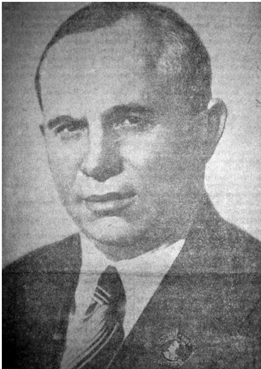
Н. Хрущев в 1950 году