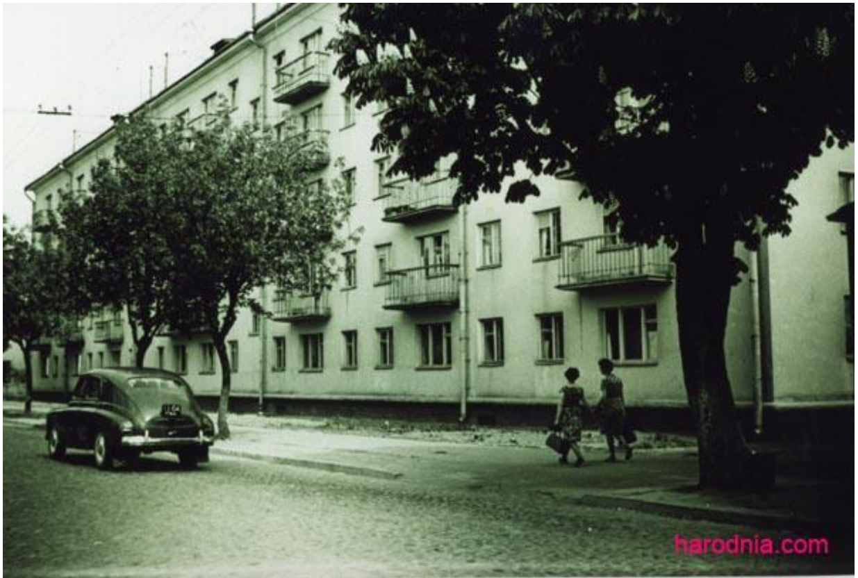
Автомобиль «Победа» на улицах города