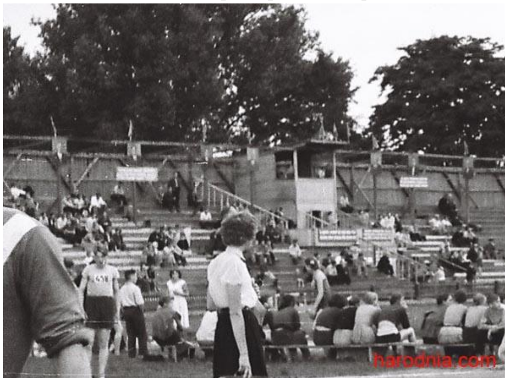
Главная трибуна стадиона «Локомотив»