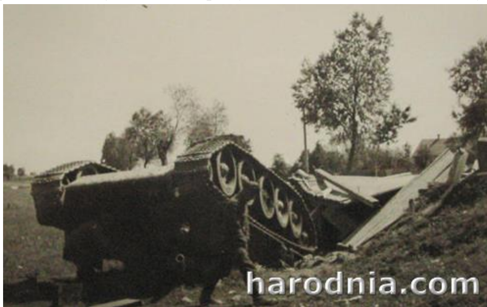
Адзін з нешматлікіх Т-34. Раён Гродна. Чэрвень 1941г.

Савецкія страты 29-й танкавай дывізіі ў баю з нямецкай пяхотай былі вельмі вялікімі. Згодна нямецкай інфармацыі савецкі бок згубіў у гэтым баю ад 70 да 150 танкаў і бронетранспарцёраў. Паводле дакументаў нямецкай 8-й пяхотнай дывізіі, толькі яна знішчыла да 110 танкаў. Значная іх частка была падбіта штурмавымі гарматамі 1-й батарэі 184-га дывізіёна. Адна са штурмавых гармат, паводле сцвярджэння Х. Слязіны, знішчыла 8 савецкіх танкаў. Пры гэтым немцы знішчалі і новыя танкі — Т-34 і КВ-2. Адзіным вынікам савецкіх танкавых атак было затрыманне наступлення баявой групы 84-га пяхотнага палка, якая магла ўжо вечарам 22 чэрвеня ўварвацца ў Гродна! Адкінуць іх да дзяржаўнай мяжы нямецкія сілы не ўдалося.