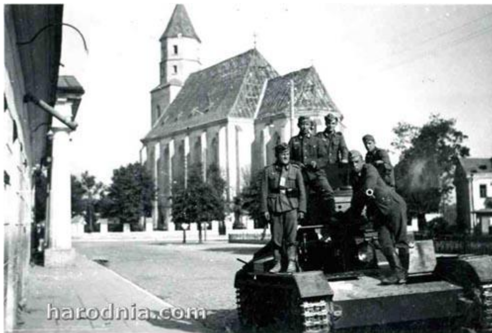
Савецкі танк Т-26 з 29 танкавай дывізіі перад Фарай Вітаўта. Гродна. Чэрвень 1941.