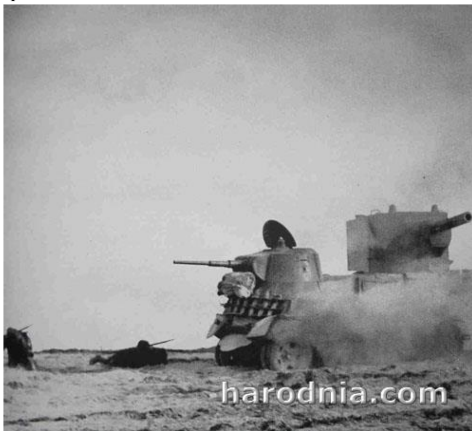
22 чэрвеня. Бой 29-й тд каля в. Канюхі. Бачны танк КВ-2

Нельга, на жаль, сказаць пра яго больш за тое, што ўжо было напісана. У асноўным мы маем справу з інфармацыяй, атрыманай з некалькіх успамінаў савецкіх ветэранаў танкавай дывізіі. Аднак гэтай інфармацыі далёка недастаткова. Акрамя таго, зусім не ўлічвалася інфармацыя з супрацьлеглага боку (г. зн. немцаў), а таксама ўспаміны мясцовых жыхароў. Ніжэй я выкладу версію гэтых баёў, атрыманую з выкарыстаннем якраз такой інфармацыі.