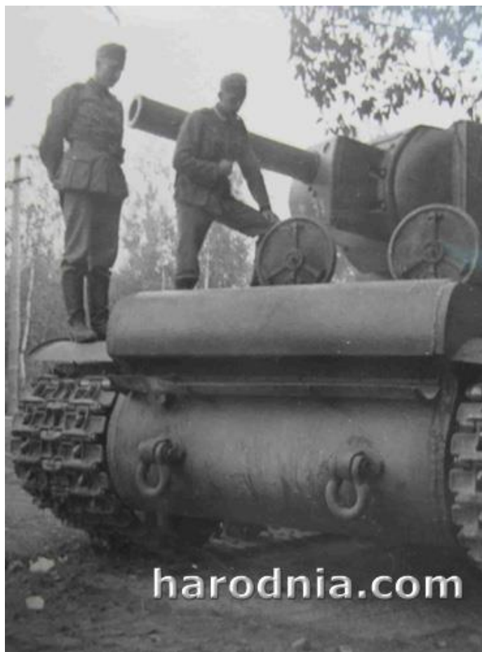
КВ-2 29-й тд на захад ад Гродна.