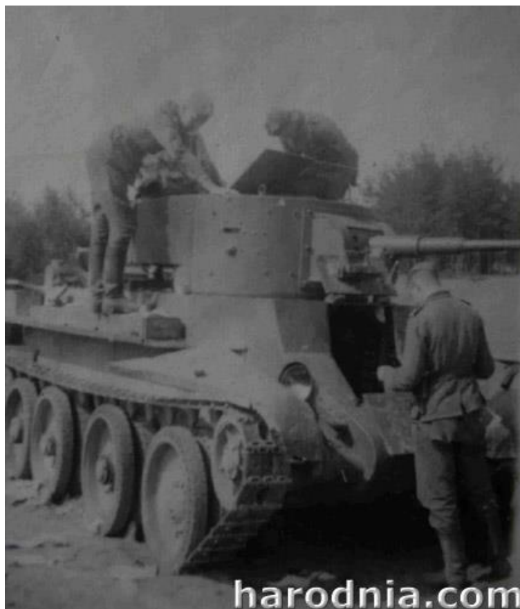
Лёккі савецкі танк БТ-7 з цыліндрычнай вежай. Раён Гродна.

Гэта азначае, што два стралковыя і два артылерыйскія палкі 85-й дывізіі 22 чэрвеня ў баях не ўдзельнічалі. Толькі вечарам, да наступлення цемры з пазіцый дывізіі ў бінокль былі бачныя нямецкія часткі, якія набліжаліся да горада. Нямецкія крыніцы таксама не згадваюць пра баі на Ласосне 22 чэрвеня.