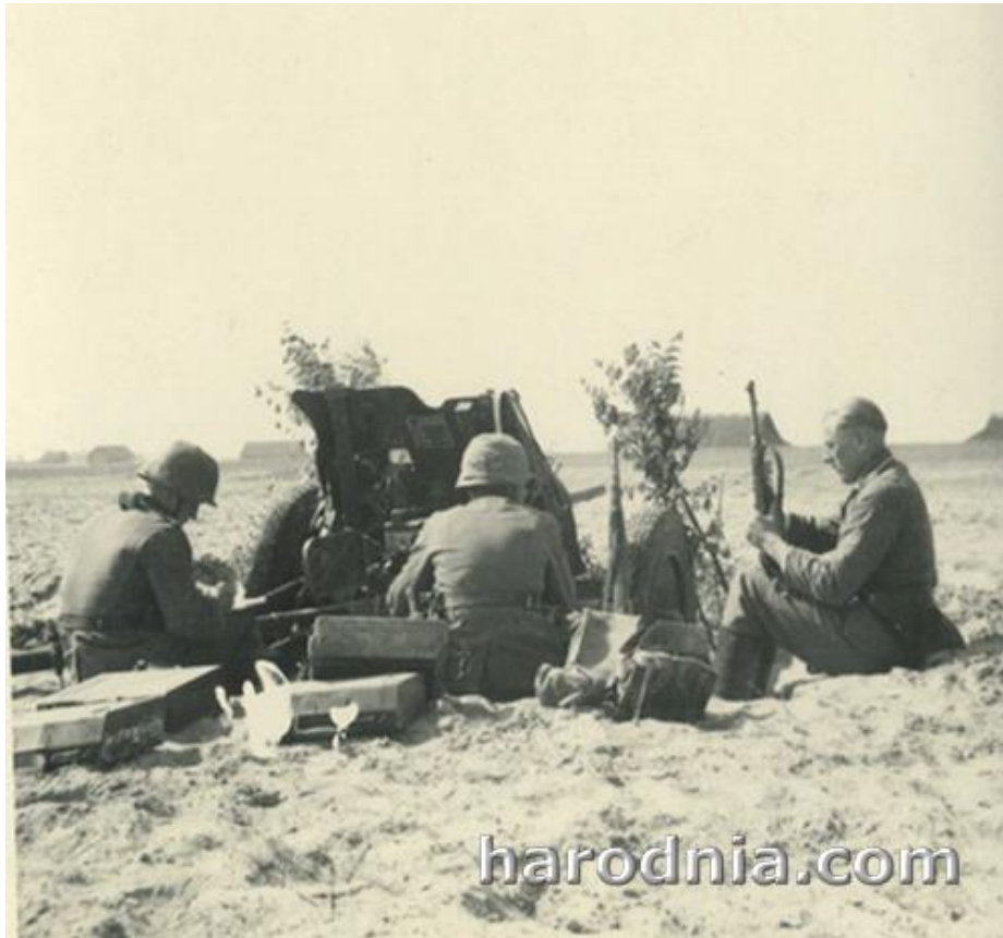
Нямецкая супрацьтанкавая 3.7 см гармата і разлік. Раён Гродна. Чэрвень 1941 г.

Толькі вечарам батальёны 103-га стралковага палка падышлі з боем у раён былога дывізіянага лагера каля вёскі Солы. Бой на гэтым рубяжы працягваўся і з надыходам ночы. Паводле ўспамінаў удзельнікаў баёў, разам з савецкай пяхотай дзейнічалі і танкі 29-й танкавай дывізіі. Нямецкі журналіст Х. Слязіна, які знаходзіўся ў 84-м палку 8-й пяхотнай дывізіі, апісаў сітуацыю, у якой ішлі баі вечарам 25 чэрвеня ў прадмесцях Гродна: