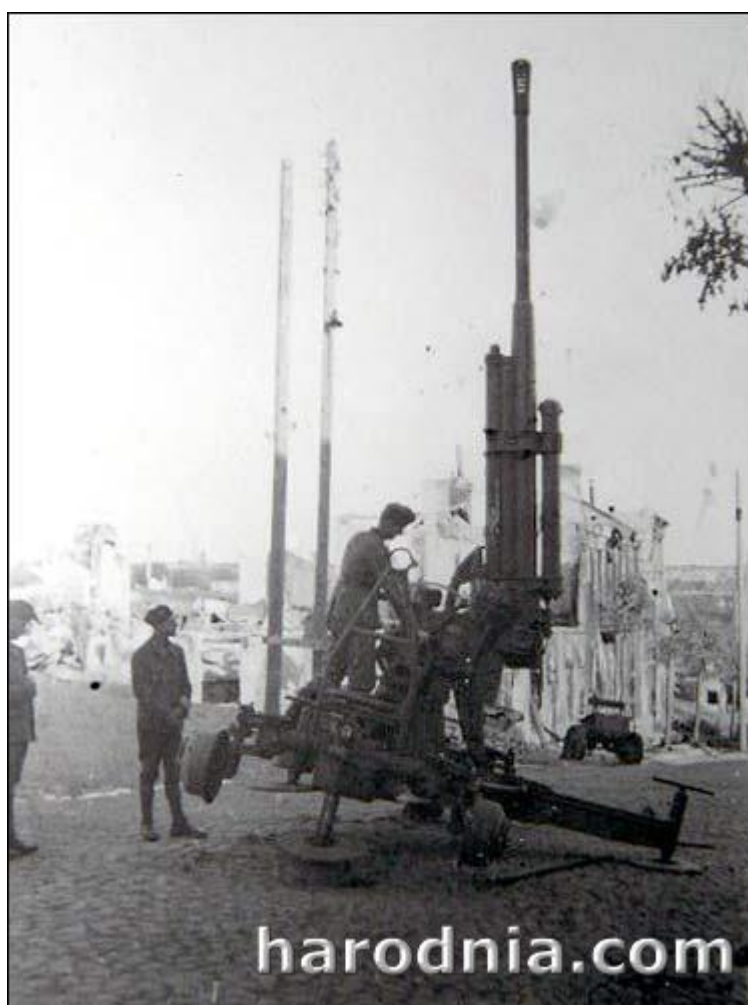
Нямецкія салдаты разглядаюць знішчанаю 85-мм савецкую зенітную гармату. Гродна.

Падзеі 22–25 чэрвеня 1941 г. былі катастрофічнымі не толькі для 3-й арміі. Разгромленымі аказаліся большасць савецкіх злучэнняў. Прычыны гэтай катастрофы трэба шукаць не толькі і не столькі ў няскончаным пераўзбраенні Чырвонай Арміі. Савецкае камандаванне заўсёды імкнулася задавіць ворага масамі сваёй тэхнікі, авіяцыі і пяхоты, і, нажаль, вельмі слаба падымалася пытанне адносна якаснай падрыхтоўкі камандзіраў і чырвонаармейцаў, сяржанцкага складу. Адпаведна не было пастаўлена пытанне аб належнай эксплуатацыі аўтамабіляў, танкаў і т. п. Войскам не хапала зладжанасці, ініцыятыўнасці каманднага складу. У выніку Чырвоная Армія ўзору 1941 г. была небаяздольнай. Масы тэхнікі проста бяздумна кідаліся супраць нямецкай пяхоты і цяпелі паразу за паразай. Салдаты і афіцэры паказвалі ўзоры гераізму ў адзіночку ці невялікімі групамі, у той час як буйныя злучэнні нагадвалі непаваротлівых сляпых чарапах.