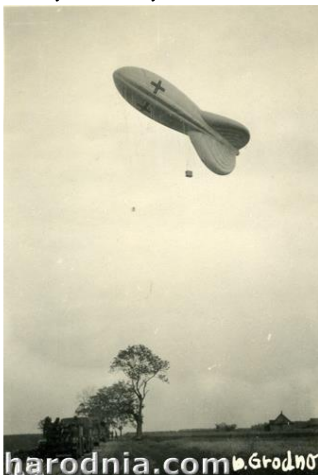
Нямецкі аэрастат ў раёне Гродна. Чэрвень 1941г.