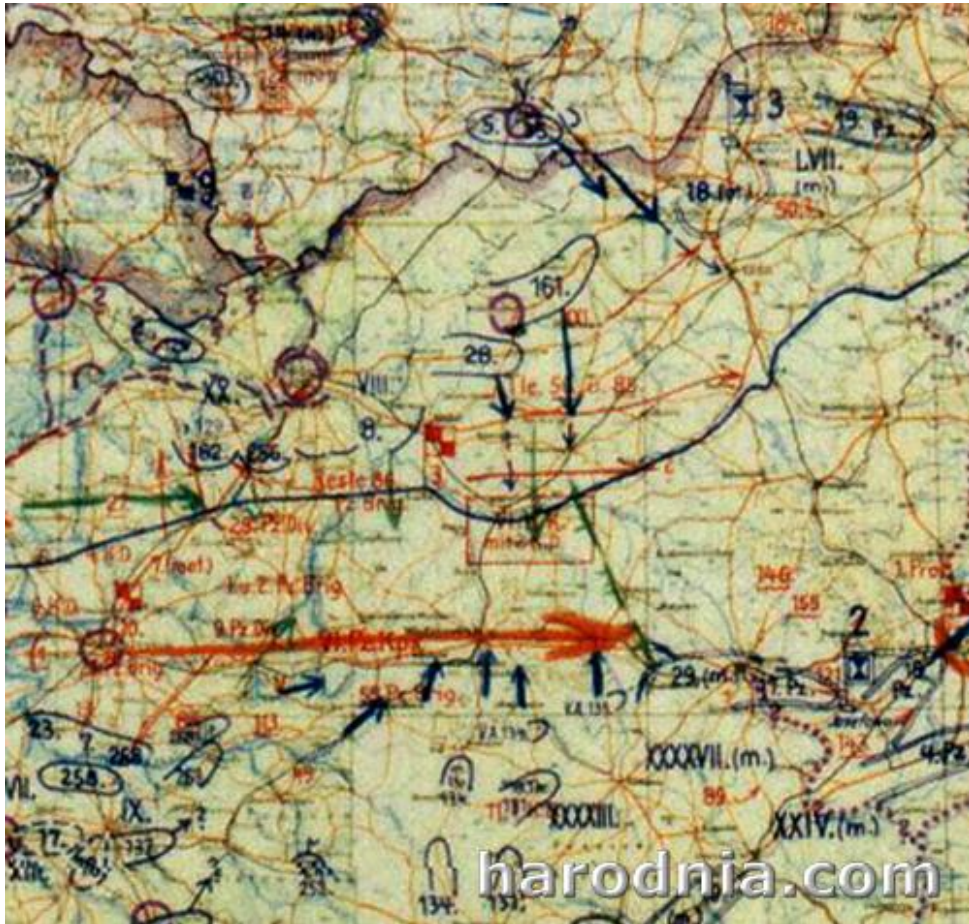
25 чэрвеня 1941г. Фрагмент нямецкай карты. Становішча на фронце. Гродна абведзены кругам

На працягу 25 чэрвеня мотастралковыя палкі 204-й матарызаванай дывізіі працягвалі весці баі на тых жа рубяжах. 657-ы артылерыйскі полк з пазіцыяй каля вёскі Капцёўка аказваў агнявую падтрымку пяхоце. Апошнія танкі дывізіі палкоўніка Студнева ізноў атакавалі на фронце Пагараны—Гібулічы. Толькі вечарам атакі гэтых падраздзяленняў скончыліся. Гродна так і не быў узяты. Страты 29-й і 204-й дывізіяў былі вельмі вялікімі. У танкавай дывізіі засталася каля 300—400 чалавек і да 30 танкаў, у матарызаванай — каля двух батальёнаў і некалькі бронеаўтамабіляў. Фактычна гэтыя падраздзяленні перасталі існаваць.