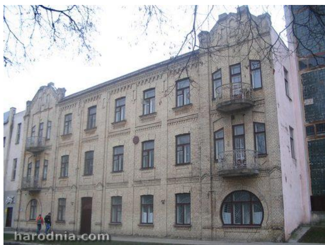
Фабрыка кавы і мармелада на вуліцы Паўночнай (цяпер Валковіча)

У 1913 годзе “Нёманская фабрыка” (тады яна насіла такую назву) мела аж 230 супрацоўнікаў а яе ўласнікі валодалі капіталам большым, чым у 120 тысяч царскіх рублёў.