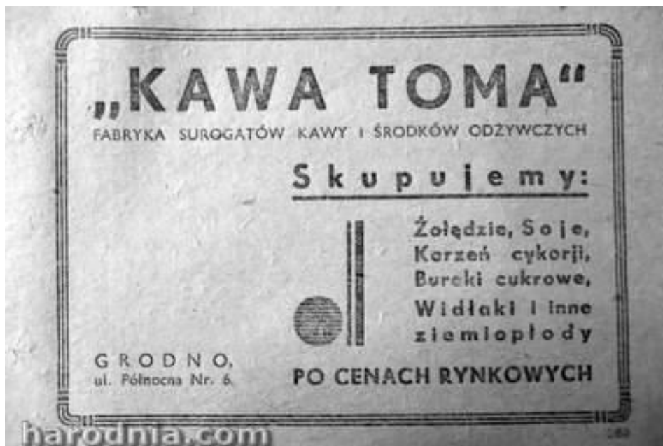
Рэклама фабрыкі кавы, 1930-я гг.

кавы і цукерак на вуліцы Паўночнай (цяпер Валковіча). Дакладна невядома, калі была заснавана гэтая фабрыка, але можна дапускаць, што да яе паўстання спрычыніліся ў 1915 – 1918 гг. нямецкія акупацыйныя ўлады. Немцы падчас ваенных дзеянняў адчувалі востры недахоп натуральнай кавы і пачалі яе масавую прадукцыю з жалудзёў, ячменя і іншых заменнікаў. Гэтая фабрыка існавала да 50-х гг. XX ст. у дадатку да штучнай кавы выпускала вельмі добрыя карамельныя цукеркі і мармелад, якія заўсёды можна было знайсці ў гарадзенскіх крамах.