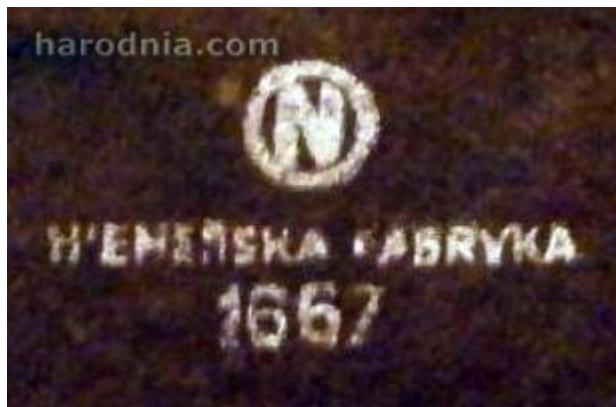
Гандлёвы знак Нёманскай фабрыкі пераплётных вырабаў міжваеннага часу