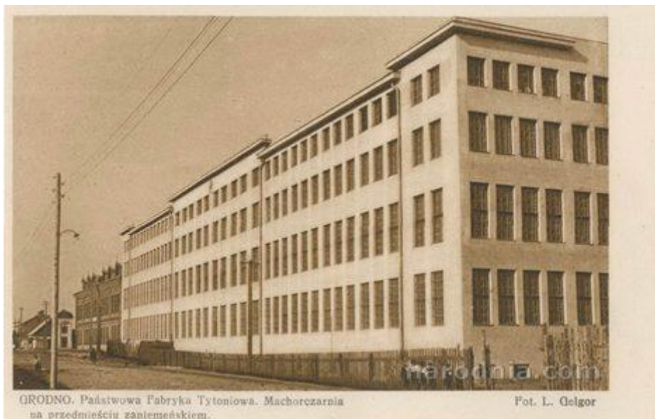
Пабудаваныя ў пачатку 1930-х гг. махарчарня і склады Гродзенскай тытунёвай фабрыкі

Пасля Другой сусветнай вайны цягам яшчэ каля дваццаці гадоў фабрыка часткова забяспечвалася сыравінай мясцовымі земляробамі. Аднак попыт курцоў на цыгарэты ўсе вышэйшай якасці зрабіў вырошчванне тытуню на Гродзеншчыне непрыбыткавай справай. У нашым даволі суровым клімаце можна вырошчваць тытунь толькі махорачных сартоў, з якіх можна вырабіць махорку, але не добрыя цыгарэты.