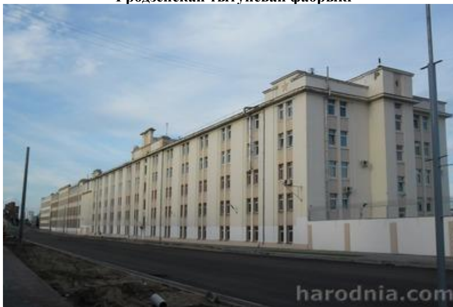
Пабудаваныя ў пачатку 1930-х гг. махарчарня і склады Гродзенскай тытунёвай фабрыкі (2012 год)

Верагодна, дзякуючы мэтанакіраванай працы селекцыянераў можна было б вывесці цыгарэтны тытунь для вырошчвання і ў нас, але каго гэта цікавіла, калі ў часы СССР можна было прывозіць сыравіну нават з Сярэдняй Азіі не лічачыся асабліва з расходамі. На сённяшні дзень Гродзенская тытунёвая фабрыка з'яўляецца хіба што адзіным з прадпрыемстваў горада, рабочыя якога могуць з гонарам казаць,