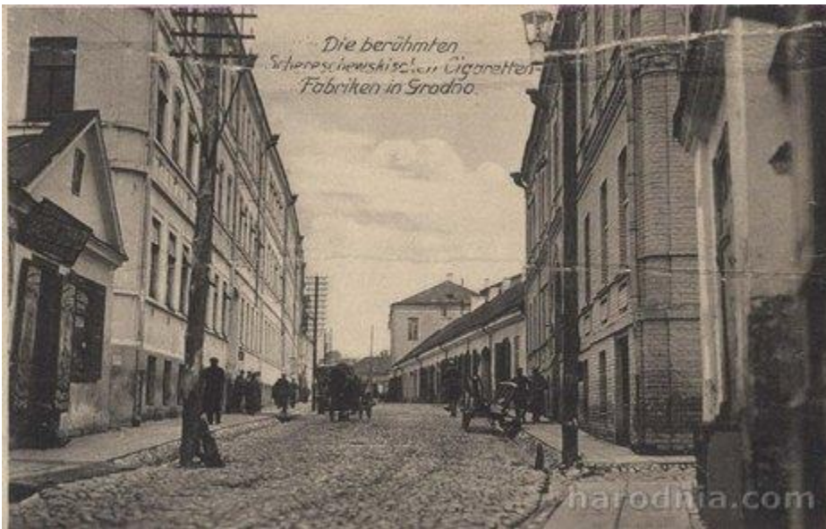
Вуліца Маставая. Злева - фабрыка Шэрэшэўскіх, пач. XX ст.

асабіста разам са сваімі працаўнікамі вырабляў цыгарэты ў дамку на вуліцы Купецкай (цяпер Маркса), але ўжо пад канец 60-х гадоў XIX стагоддзя справу ўдалося сур'ёзна пашырыць. Фабрыка некалькі разоў змяняла свой адрас, а з 1878 года пастаянным месцам размяшчэння фабрыкі стала вуліца Маставая, дзе было