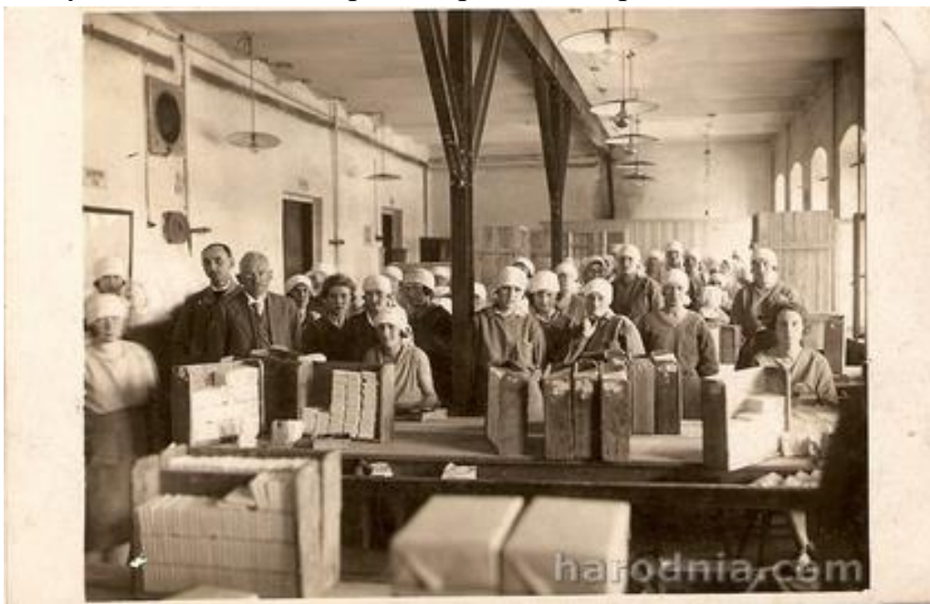
Супрацоўніцы Гродзенскай тытунёвай фабрыкі, 1920-я гг.

нямецкія акупацыйныя ўлады выдалі спецыяльны загад, дзе рэгламентавалі вырошчванне тытуню ў Гродзенскай акрузе. Кожны, хто планаваў пасадзіць, больш чым дзесяць тытунёвых сажанцаў, павінен быў паведаміць аб гэтым акупацыйным уладам. Тыя вызначалі плантатару норму для асабістага спажывання, рэшту ён павінен быў па вызначаным кошце прадаць тытунёвай фабрыцы, якая, зразумела, працавала галоўным чынам на патрэбы германскай арміі.