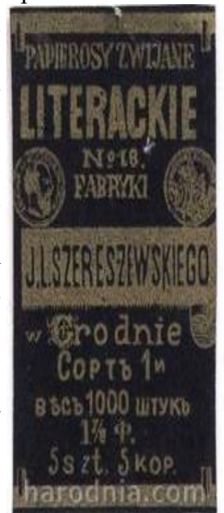
Этыкеткі фабрыкі Шэрэшэўскага пачатку XX ст.

Прадукцыя фабрыкі хутка набірала папулярнасці па-за межамі Гродзеншчыны.