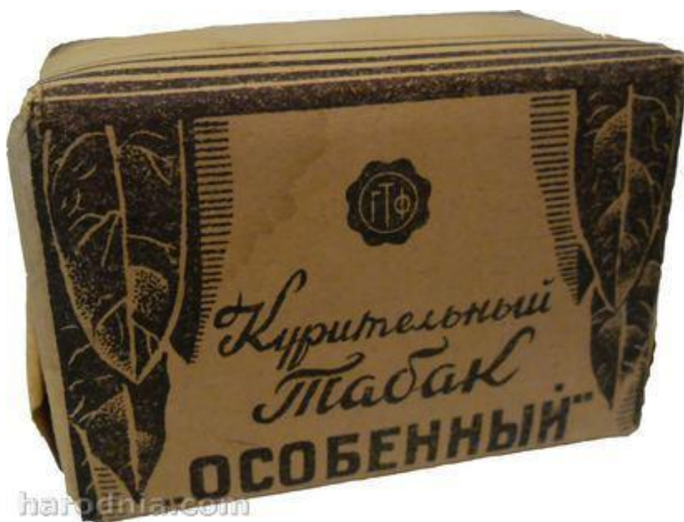
Пачка тытуню, зробленая на гродзенскай фабрыцы, 1940-я гг.