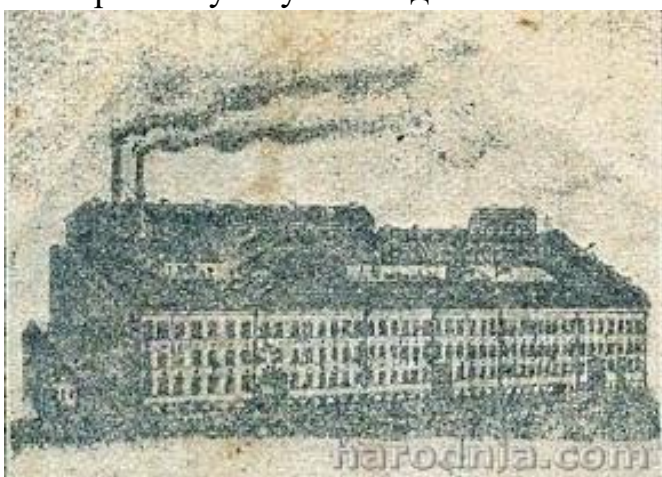
Тытунёвая фабрыка Шэрэшэўскіх, пач. XX ст.

У канцы XIX і пачатку XX стагоддзяў курэнне тытуню было чымсьці большым, чым проста сумніўным задавальненнем. Яно было часткай культуры, дэманстравала