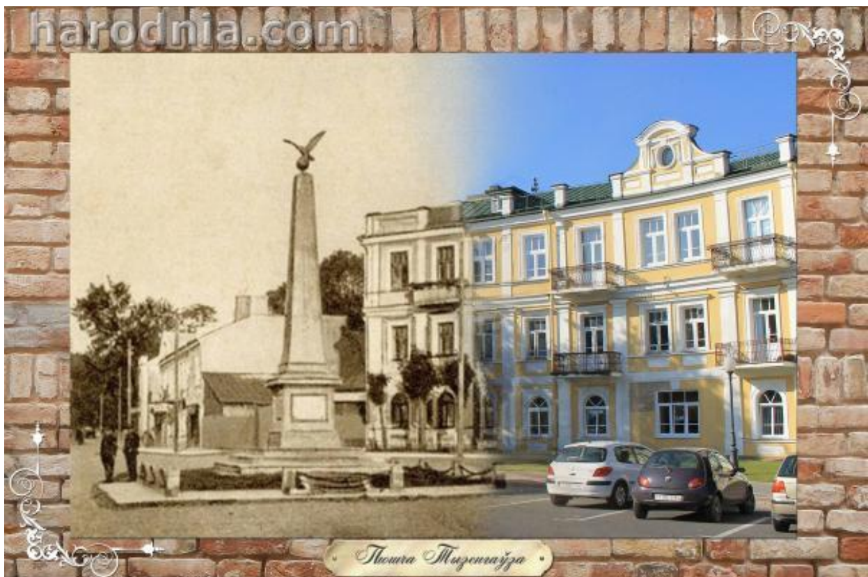
Плошча Тызенгаўза, стэла Свабоды