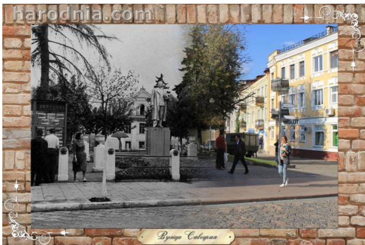
Вуліца Савецкая, помнік Сталіну (на яго месцы зараз – помнік маршалу Сакалоўскаму)