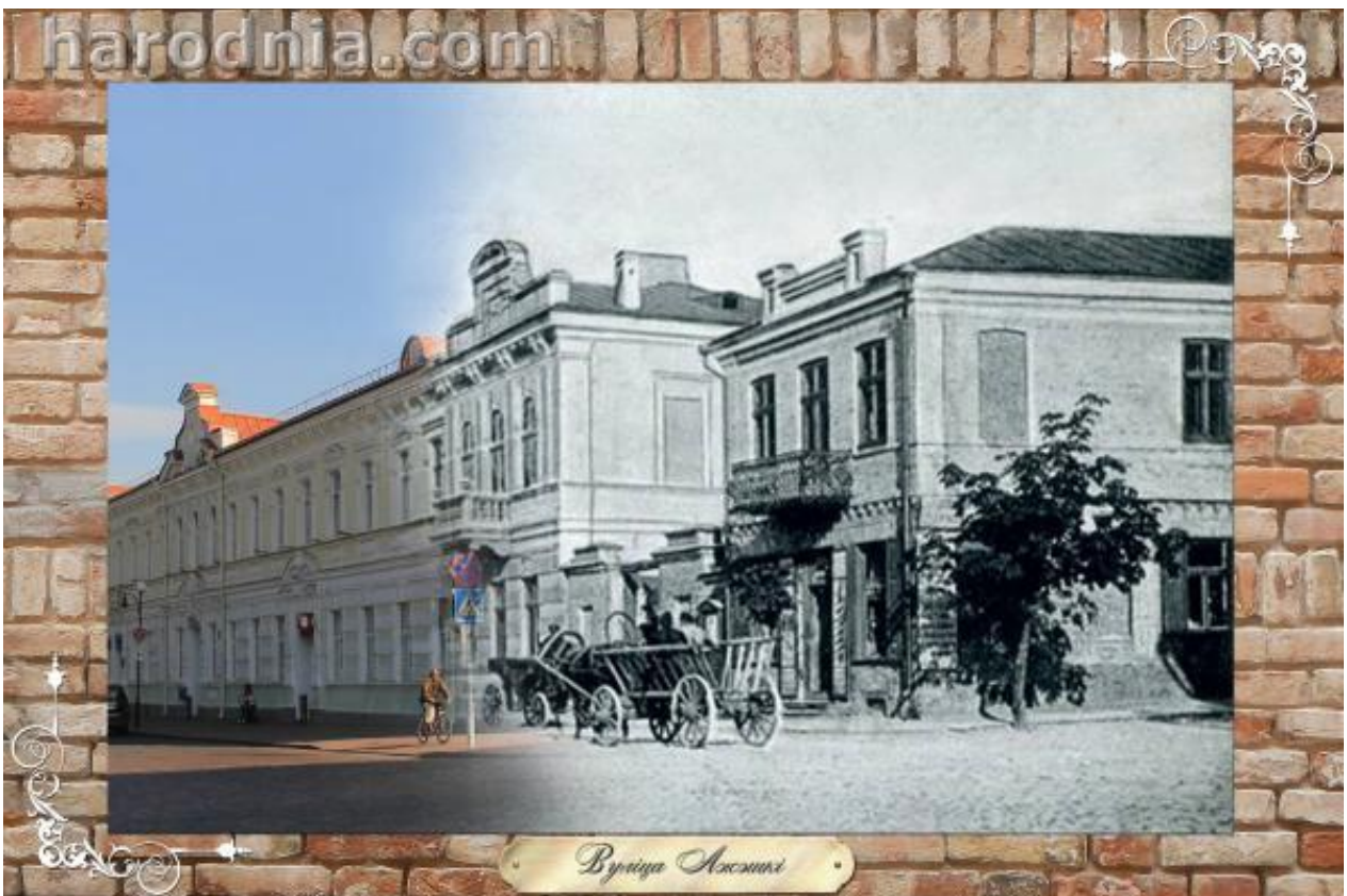
Вуліца Ажэшкі. Перакрыжаванне з вул. Сацыялістычнай