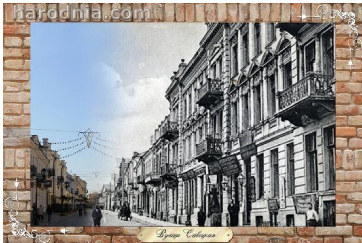
Вуліца Савецкая, гатэль “Еўропа” (з правага боку)