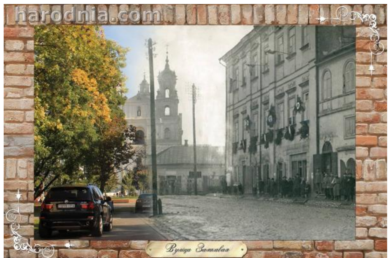
Від на рынок (Савецкая плошча) з боку Замкавай вуліцы