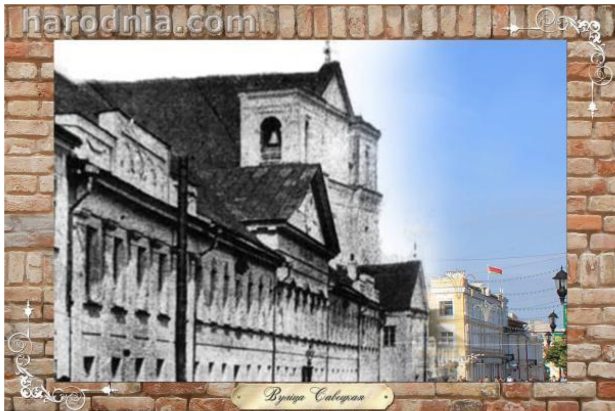
Вуліца Савецкая, дамініканскі кляштар і касцёл (злева)