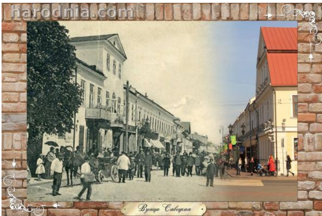
Пачатак вуліцы Савецкай