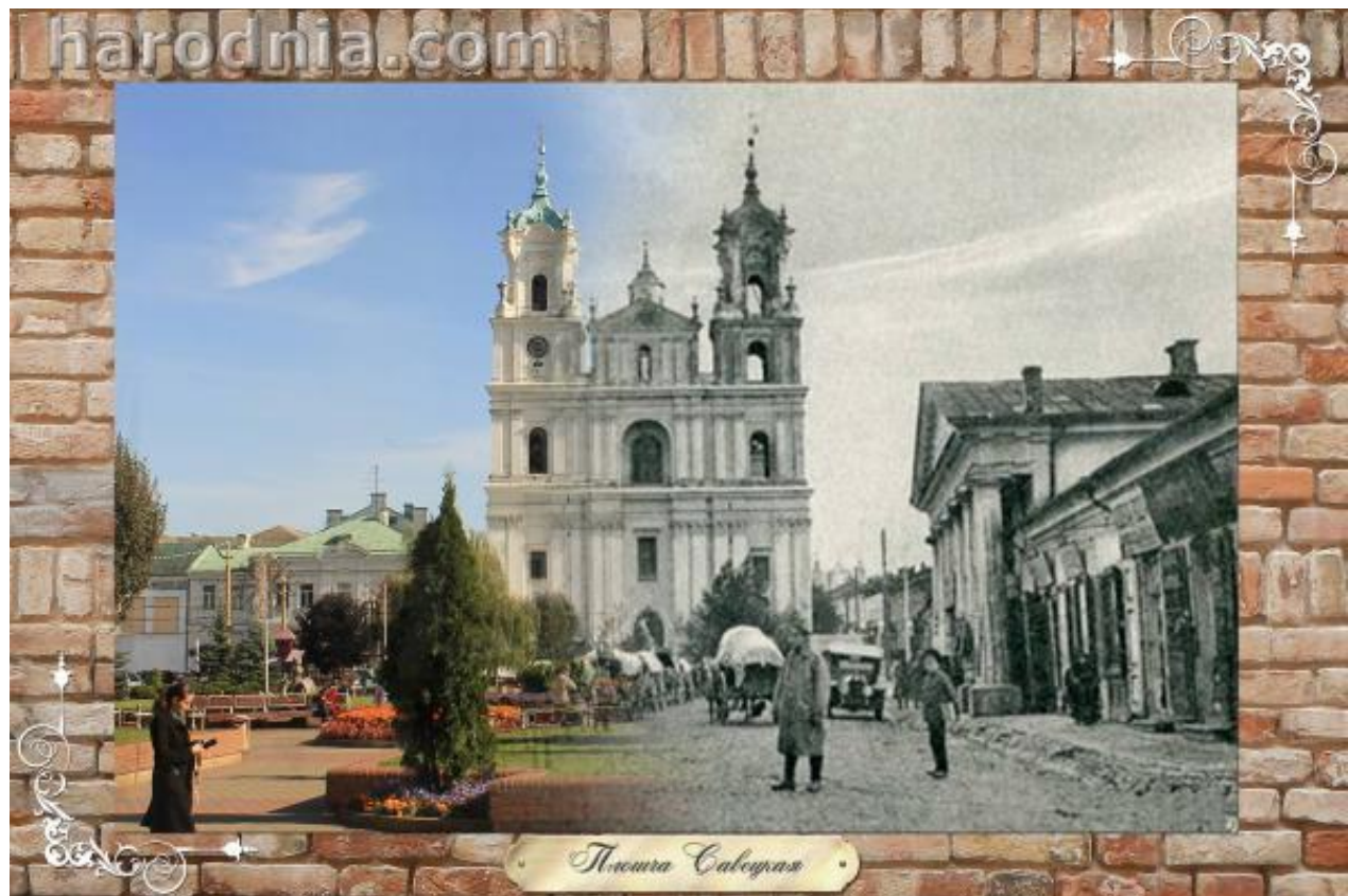
Плошча Савецкая. Фарны паезуіцкі касцёл і гарадская ратуша