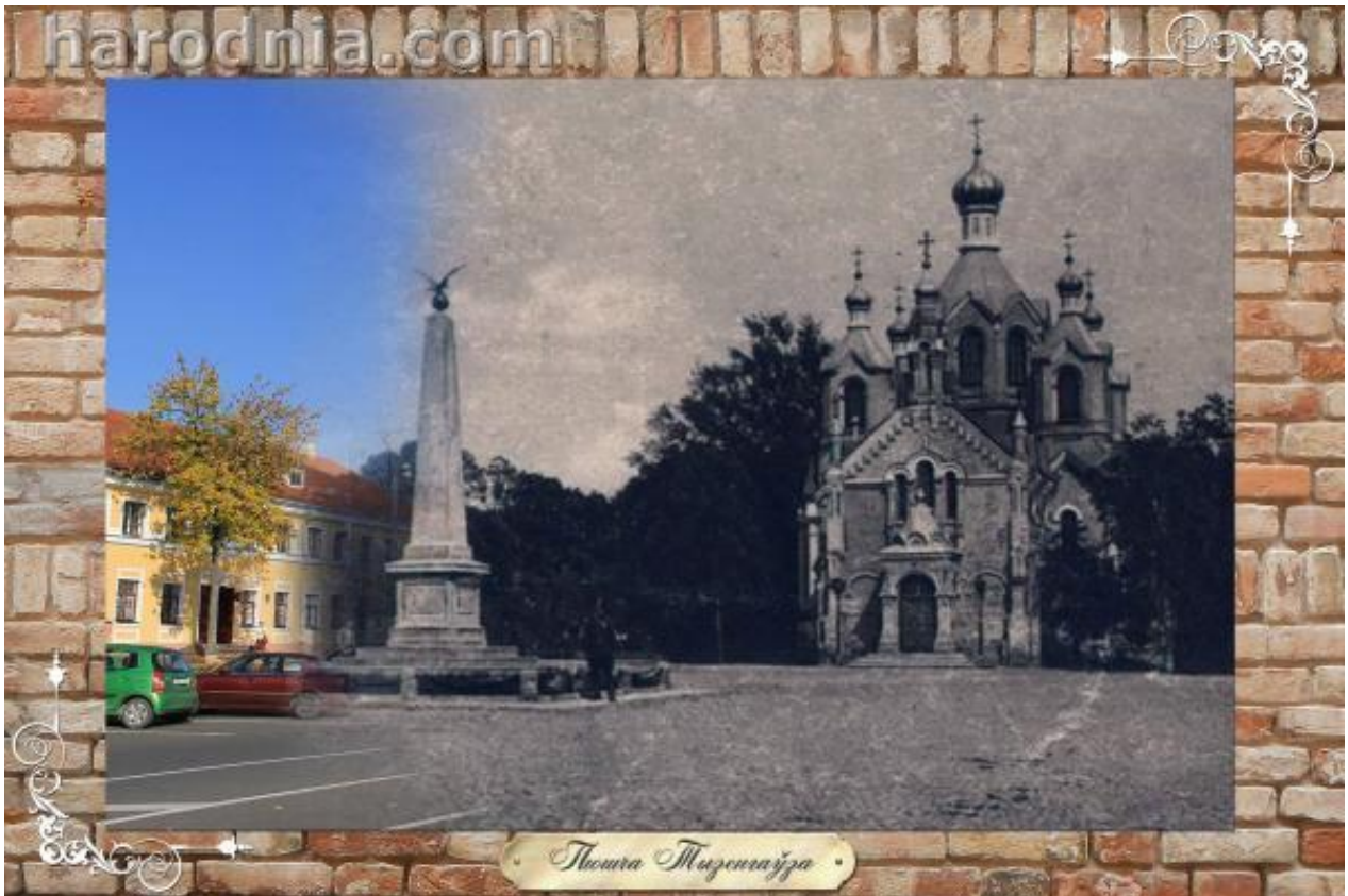
Плошча Тызенгаўза. Стэла Свабоды і царква Аляксандра Неўскага