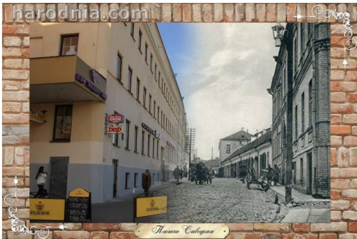
Вуліца Маставая. Тытунёвая фабрыка Шэрашэўскага (злева)