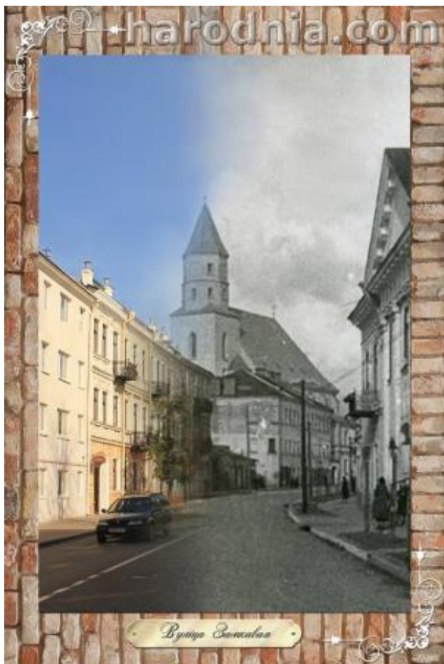
Замкавая вуліца. Від на гарнізонны касцёл (Фара Вітаўта)