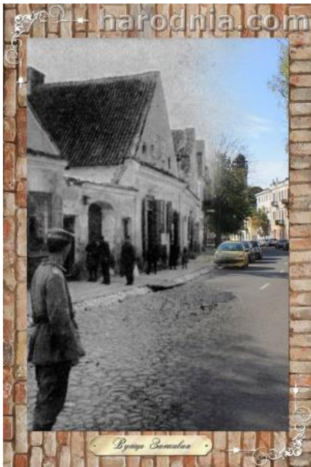
Замкавая вуліца, пажарная каланча (на заднім плане)