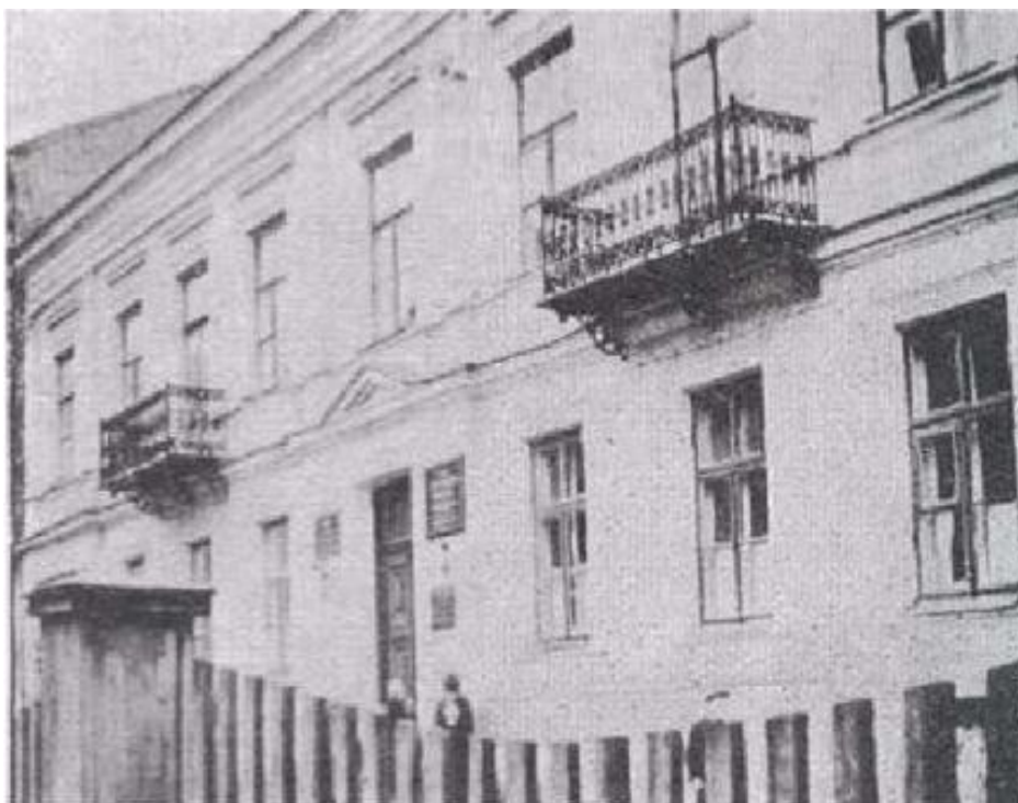
Дом в Гродно, где жил Заменгоф