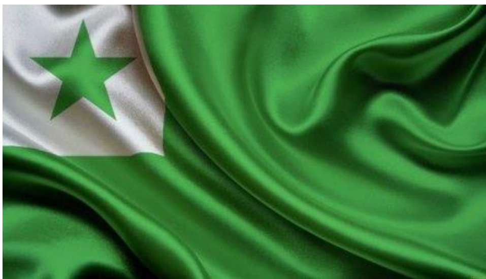
Флаг эсперантистов мира

Потребовалось проведение специальных исследований, чтобы уточнить эти данные. В "Памятных книжках Гродненской губернии" на 1896 и 1897 гг. Л.М. Заменгоф значился в числе частнопрактикующих врачей. Более точные и полные сведения были получены нами при изучении материалов Национального исторического архива Республики Беларусь, находящегося в Гродно. Особый интерес представляет сохранившаяся в фонде врачебного отделения губернского правления "Регистрационная карточка на врача Л.М. Заменгофа" от 22 октября 1893 г. Как установлено, это был подлинный документ, собственноручно написанный автором. Из хорошо сохранившегося автографа следует, что его специальность - глазные болезни, он имеет жену и двоих детей, недвижимым имуществом не владеет. В нем также указана дата его рождения: 3 декабря 1859 г. По новому стилю это соответствует 15 декабря. Не зная этого, отдельные энциклопедические издания допустили ошибку, переводя еще раз эту дату на новый стиль.