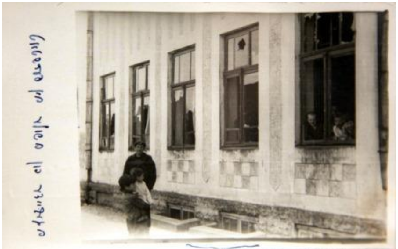
Будынак на Фарштаце з выбітымі падчас пагрома вокнамі

Ранкам наступнага дня горад чакаў працягу эксцэсаў. “Пагром... Яўрэйскі пагром... – пісала ў сваім дзённіку яўрэйская дзяўчынка з Гродна, – выбітыя вокны, палкі, нажы, камяні... Гуманныя метады... Цывілізацыя... Цэлы свет прынізіўся перад купкай людзей без Айчыны – спрадвечных іншаземцаў. Выбралі добры момант, Вы, сярэдневяковыя варвары! Хто быў у стане бараніцца ад шайкі азвярэлых “людзей”, узброенных камянямі і нажамі? Гляджу на пакой. Шкло... Шкло... Паўсюль шкло... А на сярэдзіне пакая ляжыць камень... Звычайны шэры камень, толькі трохкі запэцканы зямлёю. Вецер вые праз пустыя ваконныя рамы. На парапеце ляжыць разарваная фіранка. А на падлозе пабіты вазон. Здаецца, што на камяні кроў. Аднак не, так толькі падаецца. У шмат якіх яўрэйскіх дамах ляжаць параненыя. У шпіталь прывозяць новых пацыентаў. Яўрэйская кроў сцякае з нажоў і крывава чырванее на камянях... Не першы раз, і не дзясяты раз... Кожную хвіліну адгукаецца тэлефон – паўсюль тыя ж самыя словы: “У нас кепска”. Паўсюль кепска. Няма аніводнай добрай навіны... Ужо позна... Але ніхто з дваццаці тысяч гродзенскіх яўрэяў не спіць...”.