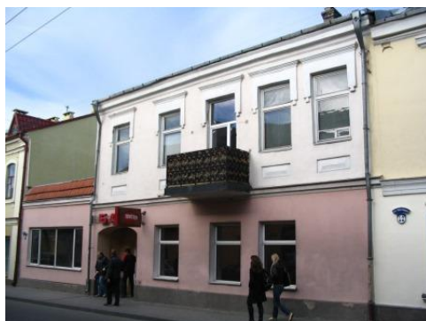
Дом, дзе жыў У. Кушч

Чаму ж падзея, якая павінна была стаць толькі эпізодам у крымінальнай хроніцы Гродна, прывяла да яшчэ больш трагічных наступстваў, у выніку якіх загінула яшчэ як мінімум два чалавекі і паўстала своеасаблівае вежа ў гісторыі адносін хрысціянскай і яўрэйскай абшчын Гродна? На гэтае пытанне, а таксама на пытанне, ці можна назваць падзеі 7 чэрвеня 1935 г. у Гродне яўрэйскім пагромам, мы і паспрабуем адказаць у гэтым артыкуле.