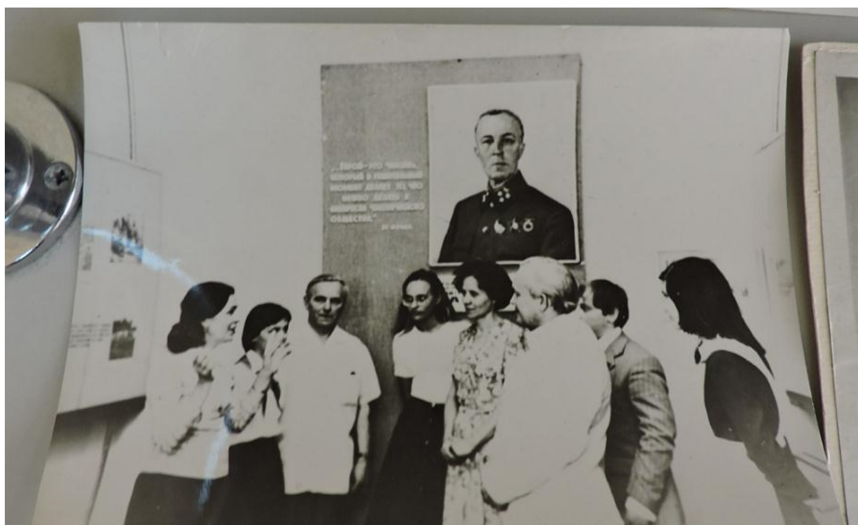
Дмитрий Карбышев: "Я солдат и остаюсь верен долгу"