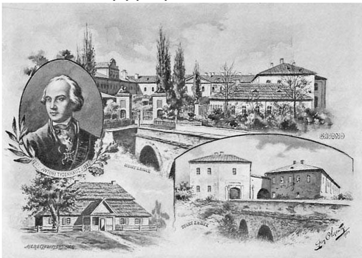
Граф Антоний Тизенгауз

Впрочем, в поисках ещё одного из старейших наших памятников далеко и много ходить не придётся. В самом центре древнего Гродно, на Советской площади, сменившей в прежние эпохи множество названий, в Кафедральном соборе святого Франциска Ксаверия находится обелиск конца XIX столетия, увековечивающий имя Антония Тизенгауза (1733–1785), известного политического и общественного деятеля Великого княжества Литовского, мецената и реформатора.