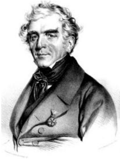
Граф Константин Александр Тизенгауз

Как следует из вышеупомянутой надписи, мемориал Антонию был создан по инициативе его родственника — внучатого племянника графа Константина Александра Тизенгауза (1786–1853), бывшего полковника армии Наполеона, а позднее — учёного, известного белорусского орнитолога.