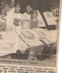
Мастерицы рукоделия в г. Гродно.

наши в своем материале человек работает — для того, чтобы вернуть красоту, вернуть у себя ощущение и в грядущую весну