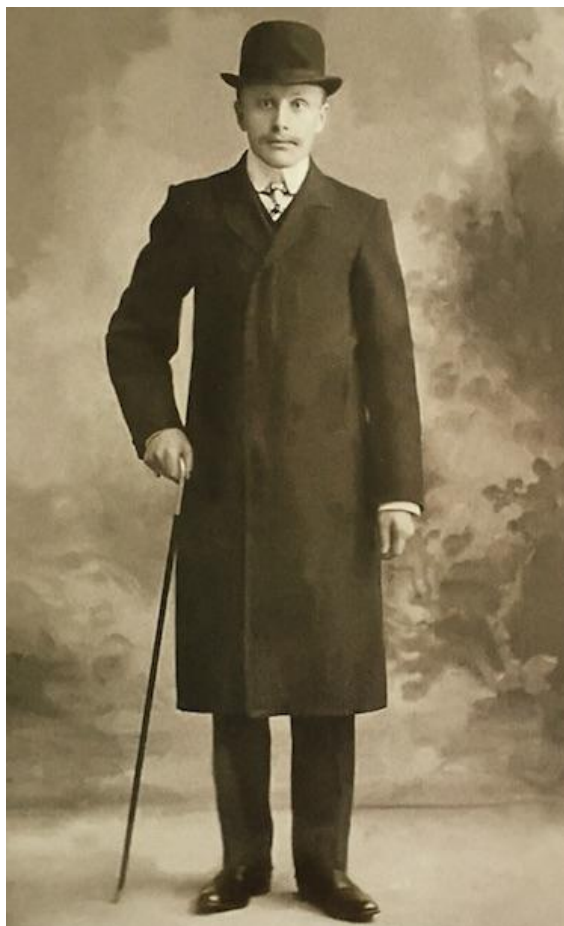
Витебск, конец 19 — начало 20 века

Так, костюм дворян и чиновников соответствовал европейской моде, отличался высоким качеством материалов и безукоризненностью аксессуаров. Приобреталась такая одежда за границей либо шилась на заказ из зарубежных тканей по иллюстрациям модных журналов.