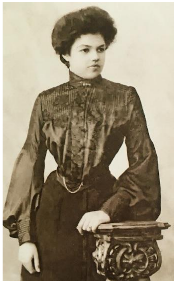
Минск, 1911 год

В вечерней моде господствовали глубокое декольте, узкие юбки и богатый декор.