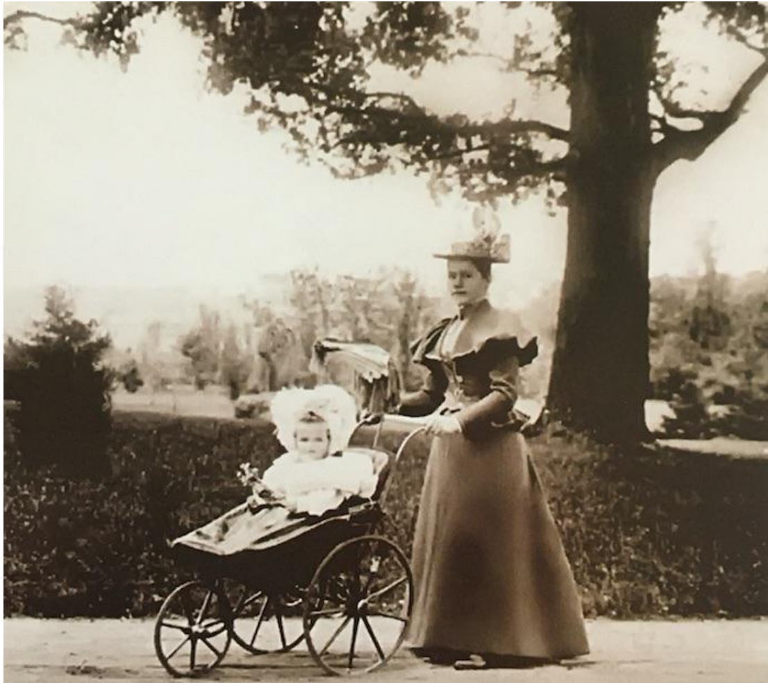
Беловежа, 1897 год

В начале 20 века пришла мода на одежду без корсета, что значительно изменило женский силуэт. Шиком считалось заполучить в свой гардероб блузу с широкими рукавами и высоким воротником, к которому пришивались кружева и броши.