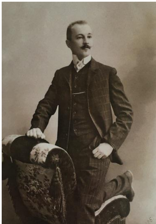
Гродно, 1905 год