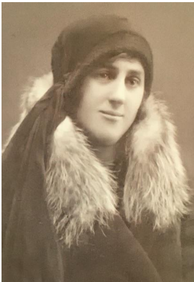
Пинск, 1932 год