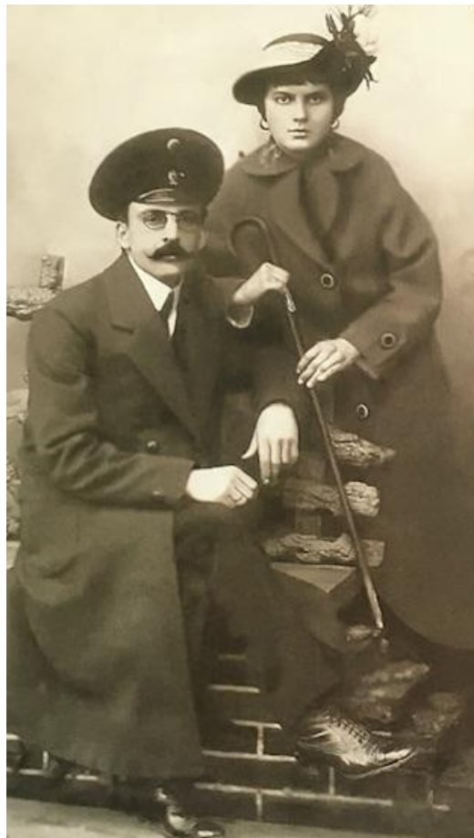
Мозырский повет, начало 20 века

В начале 20 века все большее внимание уделяли аксессуарам, в том числе и мужским. Именно они могли рассказать о достатке человека, значимости занимаемой должности, отношению к тому или иному сословию.