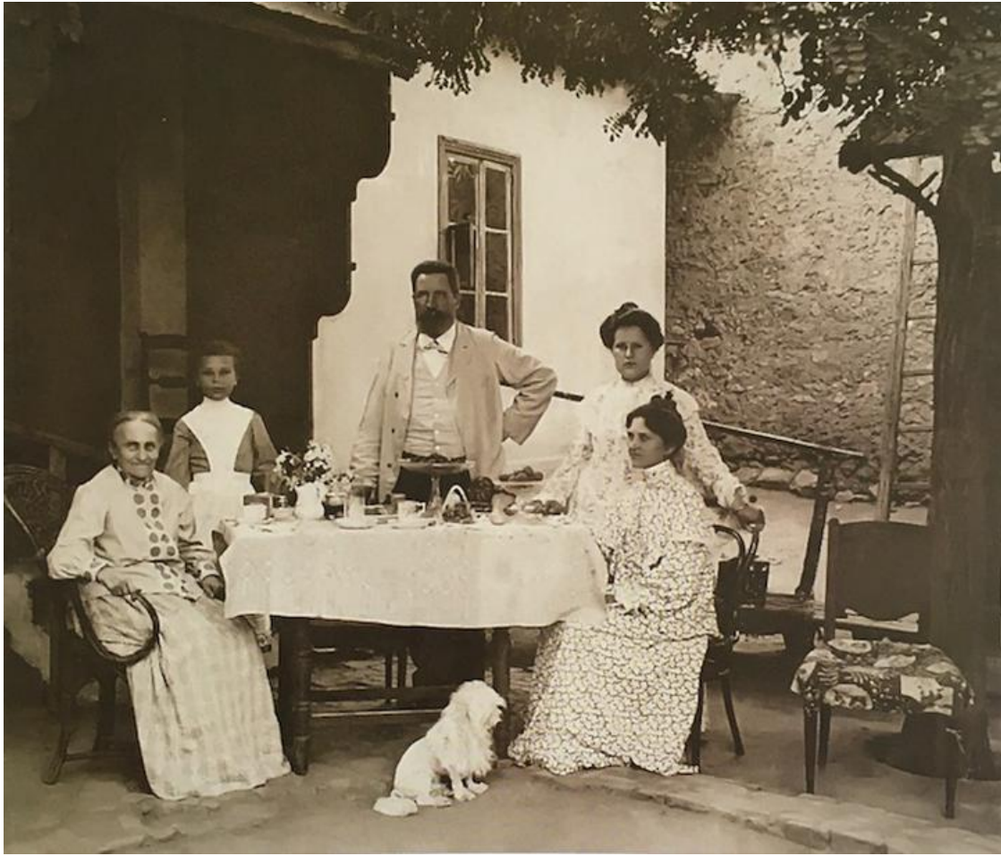
Дачная одежда. Мозырь, 1910 год

В одежде господствовала французская мода, за которой следили по парижским журналам. Они распространялись лишь в крупных городах Беларуси.