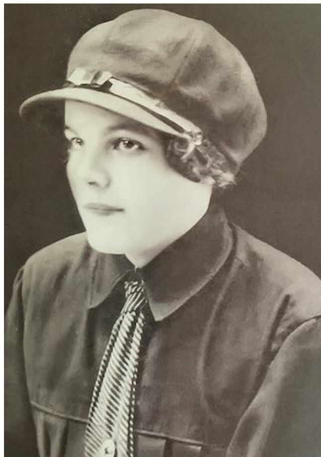
Мозырь, 1930 год

Надеемся, архивные фотографии дадут вам еще один повод гордиться своей историей!