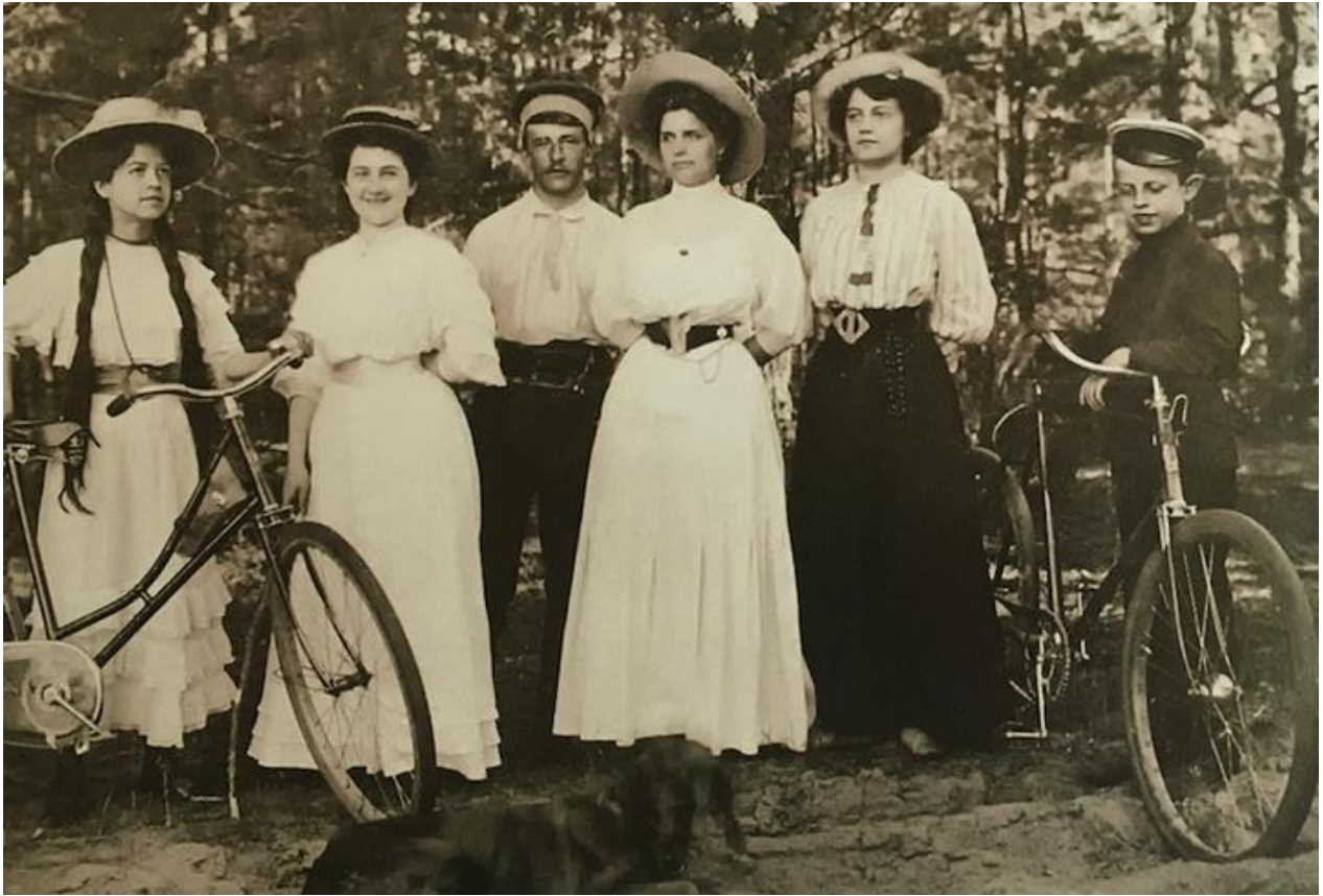
Гродно, начало 20 века

В начале 20 века все большее внимание уделяли аксессуарам, в том числе и мужским. Именно они могли рассказать о достатке человека, значимости занимаемой должности, отношению к тому или иному сословию.