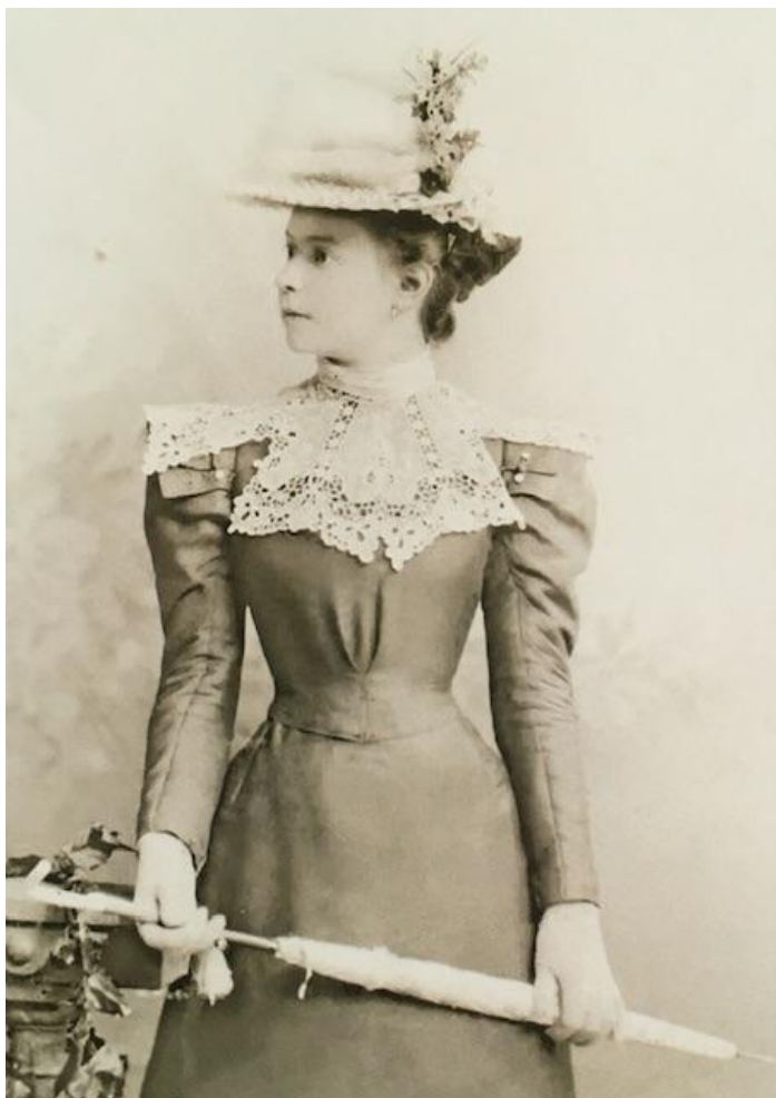
Минск, начало 20 века