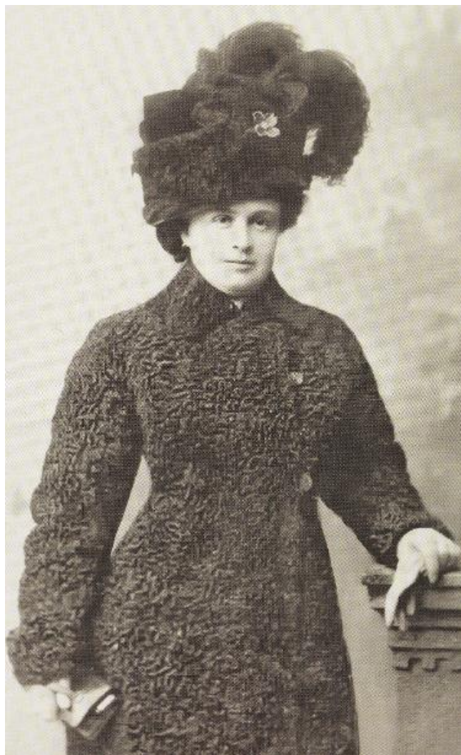
Минск, 1911 год

Шляхтенка, которая жила в городе, обязательно должна была иметь туалеты четырех видов, обладать навыком вовремя и к месту выбрать каждый из них. К ним относились: утренние костюмы для дома, дневные туалеты для визитов и домашних приемов, дорожные комплекты для поездок и прогулок, вечерние образы для званых обедов, концертов, походов в театр.