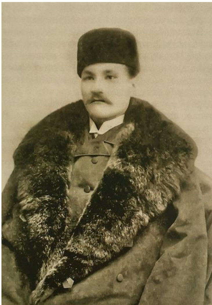
Гродно, 1891 год