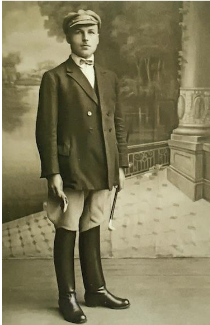
Ошмяны, 1920–1930 годы

Согласно переписи 1897 года в городах Беларуси проживало 6,8% дворян, 0,6% — духовенства, 1,4% — купцов, 68,5% — мещан, 21% — селян, 0,3% — иностранных подданных, 1,4% — других. К городской верхушке относились мещанско-дворянское сословие, крупные чиновники, банкиры, купечество. Интеллигенцию составляли художники, архитекторы, врачи, ученые, музыканты, учителя, среднее духовенство и чиновники. Каждая из этих групп имела свои специфические особенности в одежде.