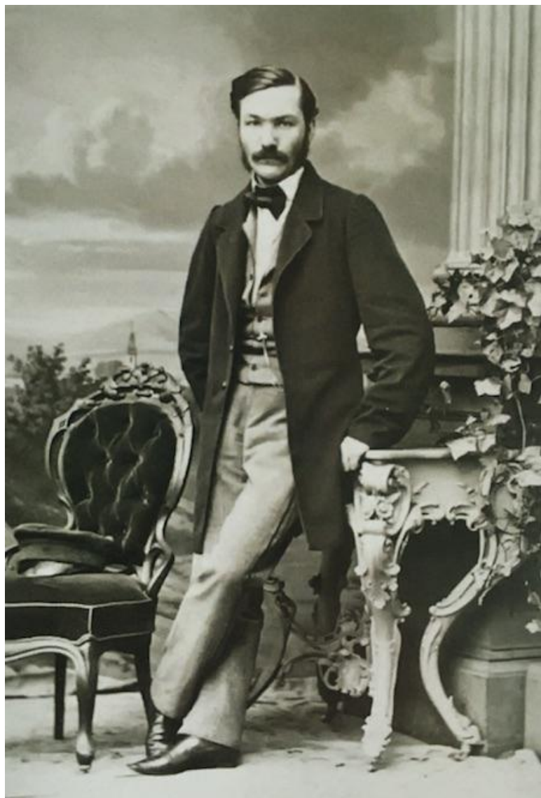
Гродно, 1863 год

Сохранились исторические документы, согласно которым богатые люди выписывали себе костюмы и аксессуары и из-за границы.