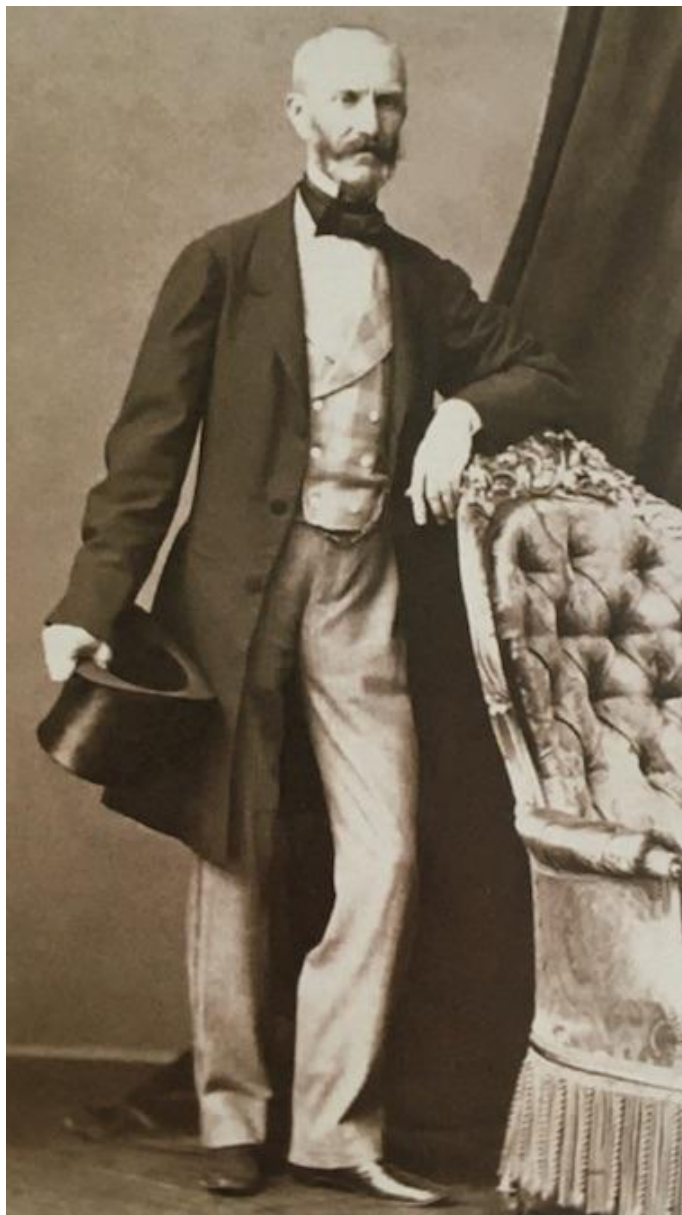
Гродно, 1863 год

В середине 19 века обрела популярность фотография. Чтобы достойно запечатлеть себя на века, люди выбирали свои лучшие образы. Для снимка высокого качества модникам приходилось продолжительное время неподвижно стоять на одном месте. Поэтому очень часто на фотографиях того времени люди опираются на столики, спинки кресел, колонны. Фотографы были настоящими художниками, выстраивали композицию с особой эстетикой.