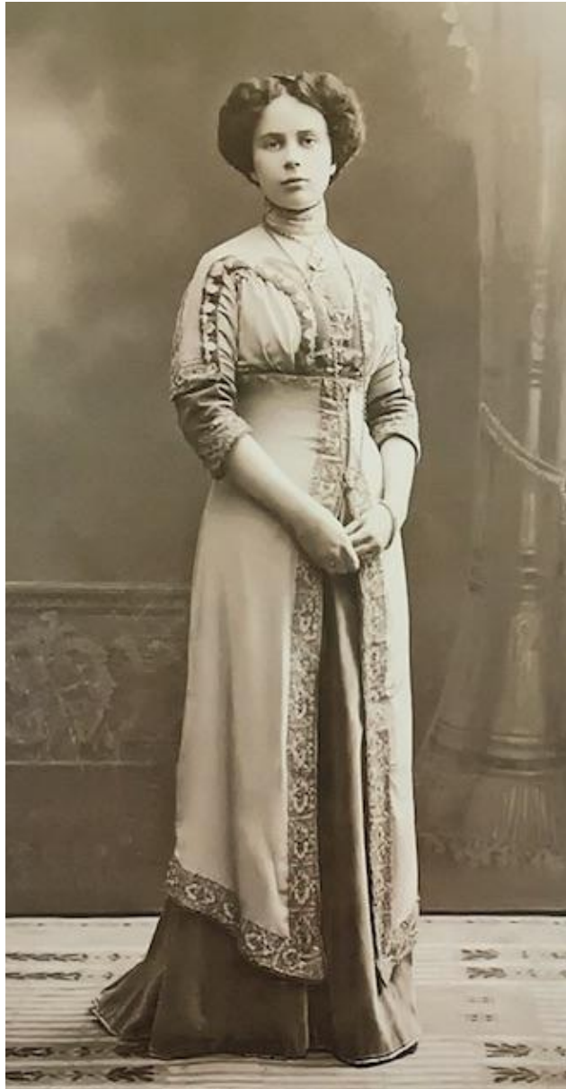
Гродно, конец 19 — начало 20 века

Женщины привилегированных сословий меняли наряды по два-три раза на дню. А так как у платьев были сложные конструкции, переодеться самостоятельно было достаточно сложно. У каждой обеспеченной модницы была прислуга, которая помогала как снимать, так и надевать платья.