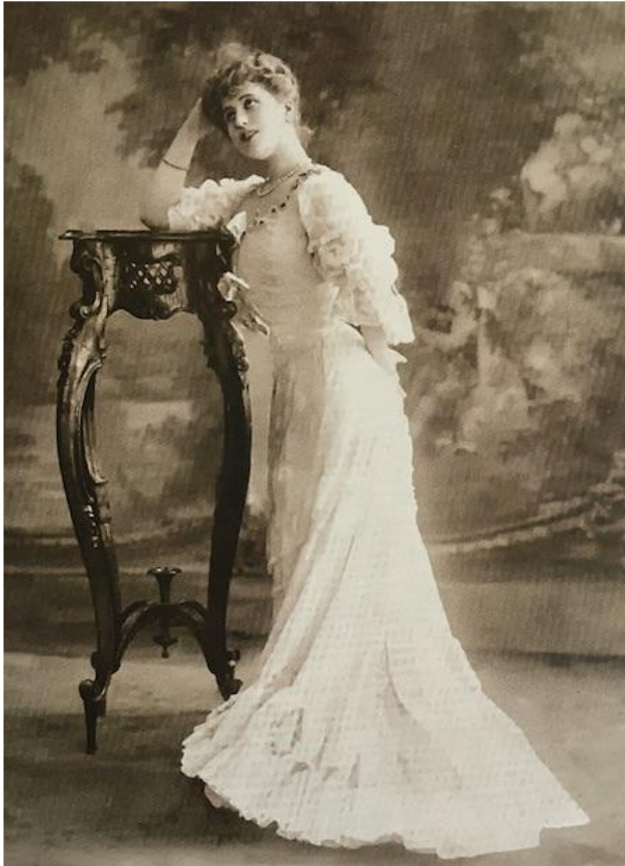
Минск, начало 20 века

Отдельно стоит отметить любовь белорусок к необычным головным уборам. Вы только взгляните на стильных девушек Полесья!