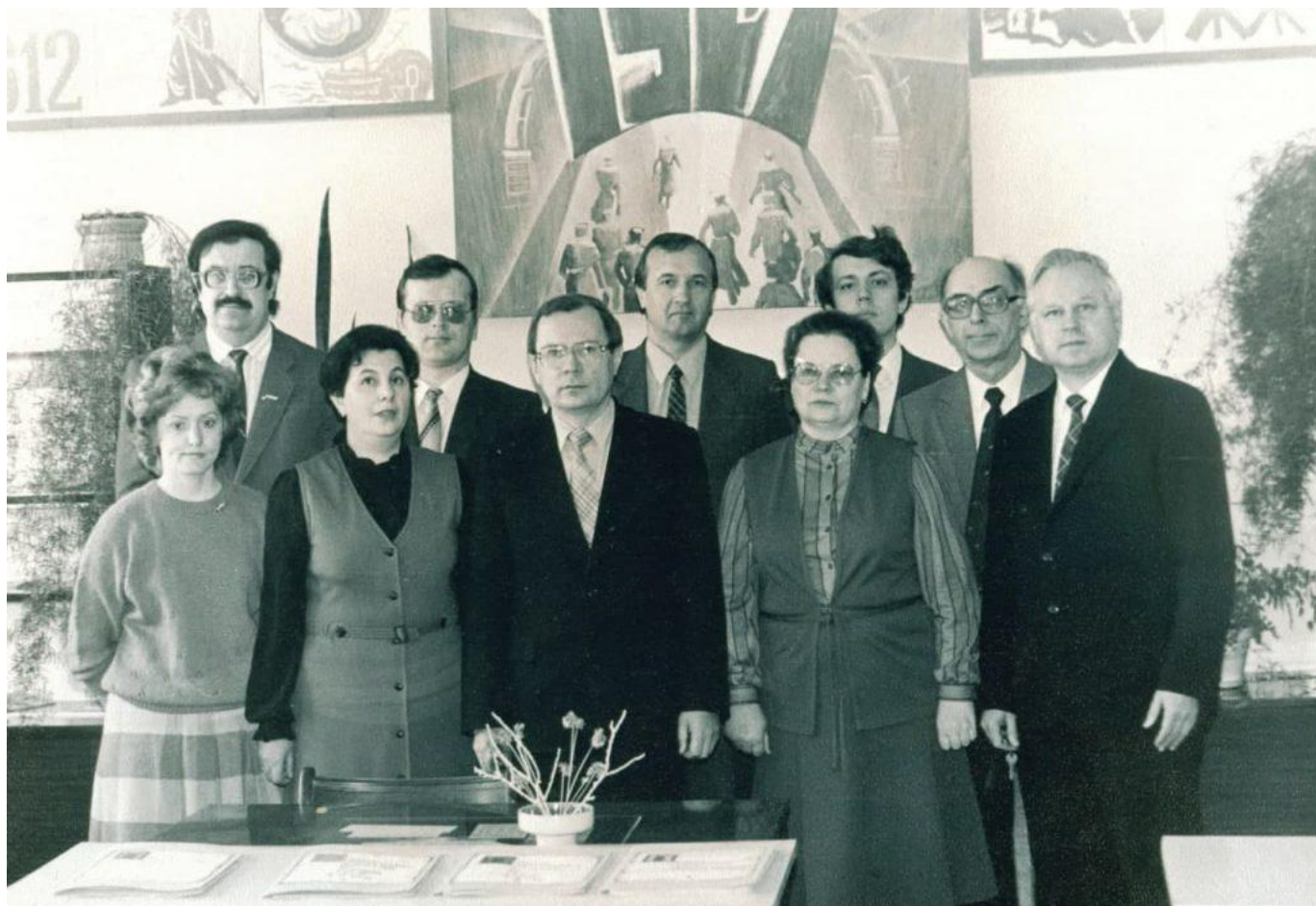
Кафедра истории славянских государств, 1980-е годы