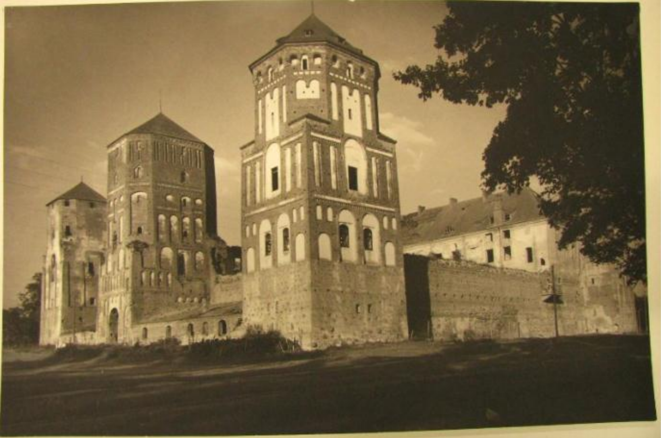
Березовическая цер. в Мир-Белорус. [XIV]