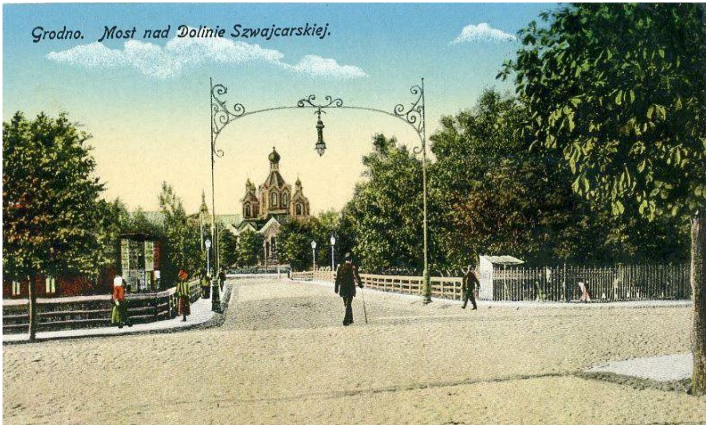
Grodno. Most nad Dolinie Szwajcarskiej.