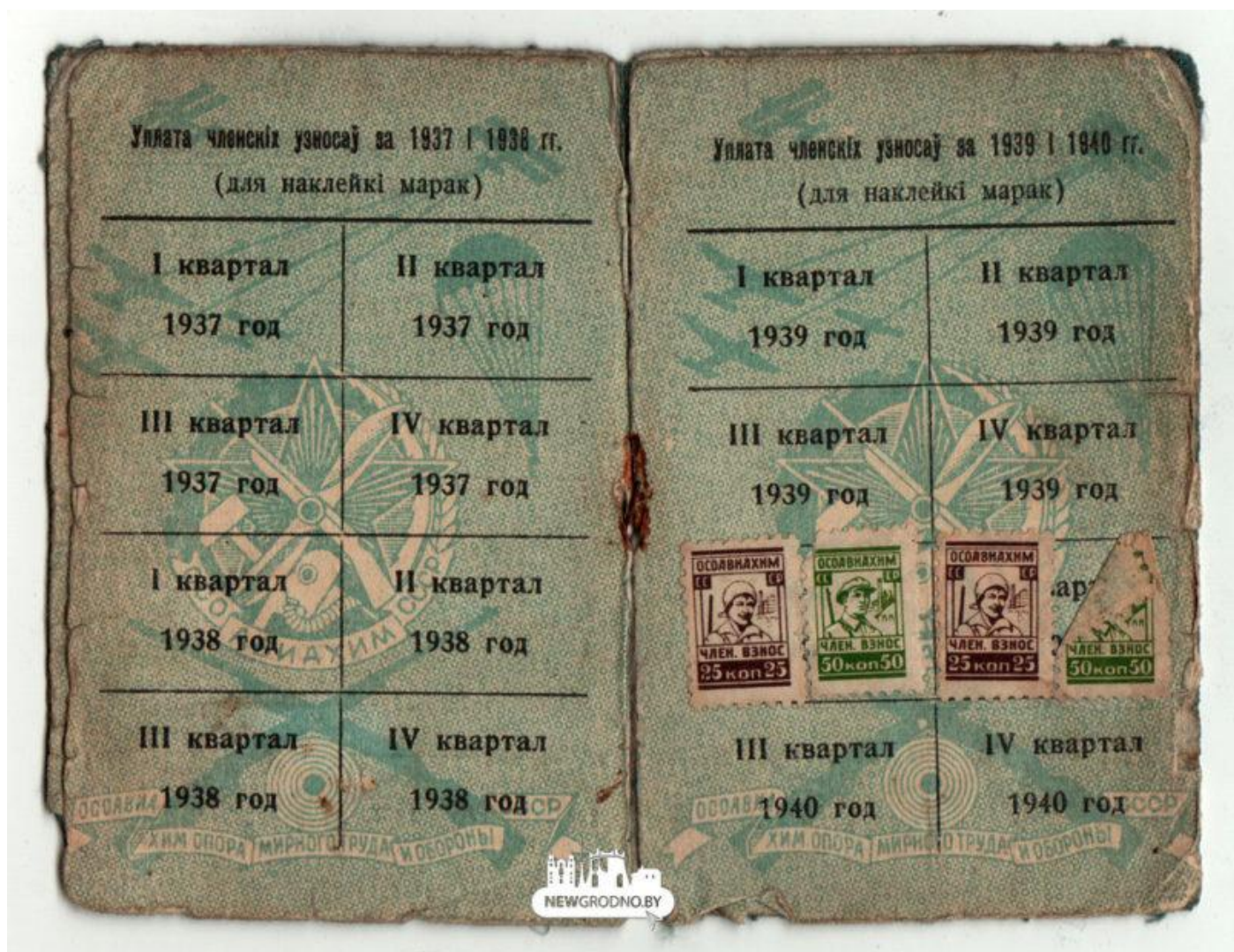
Фотография выпуска инструкторов противовоздушной обороны табачной фабрики: