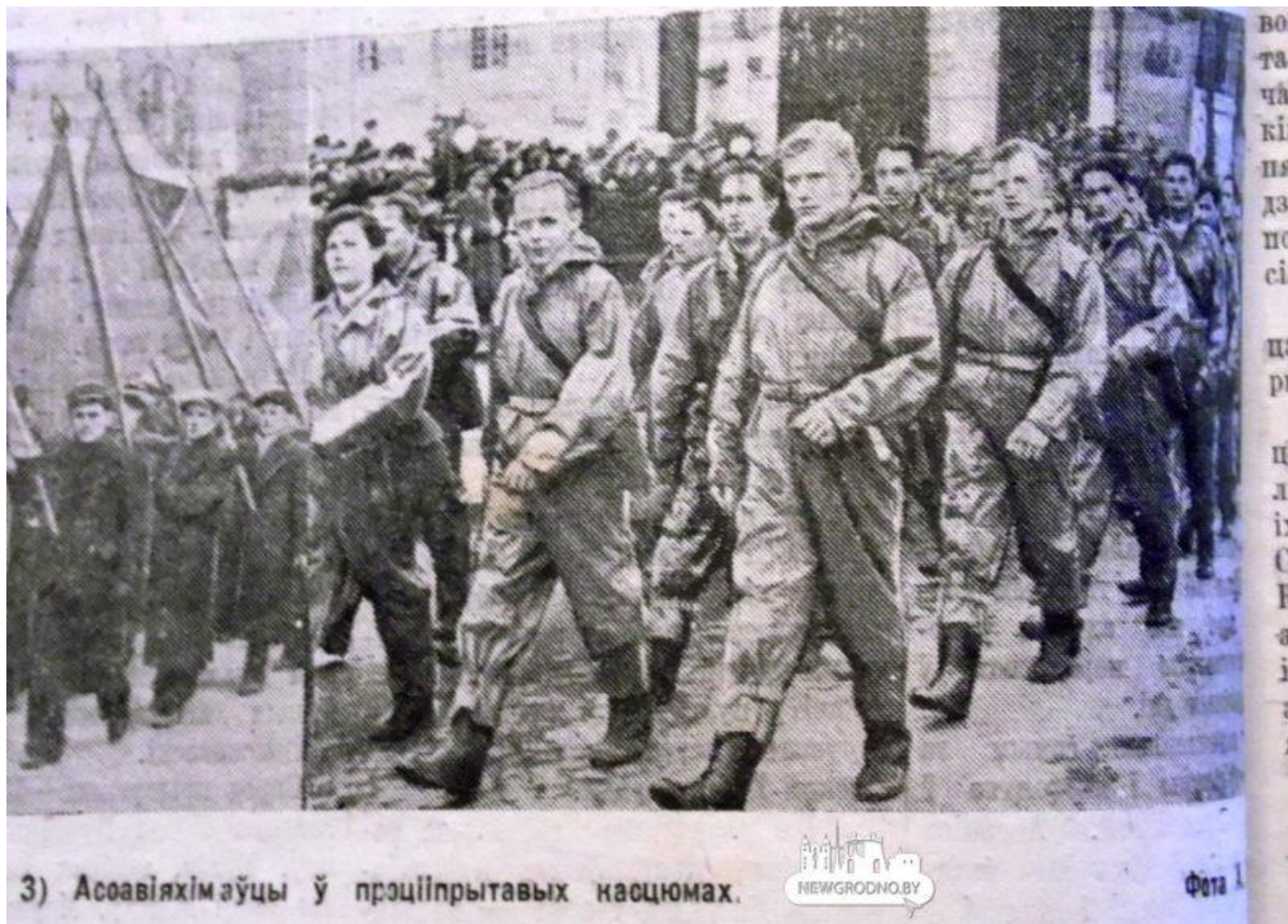
3) Асоавіяхімаўцы ў прэціпрытавых насцюмах.