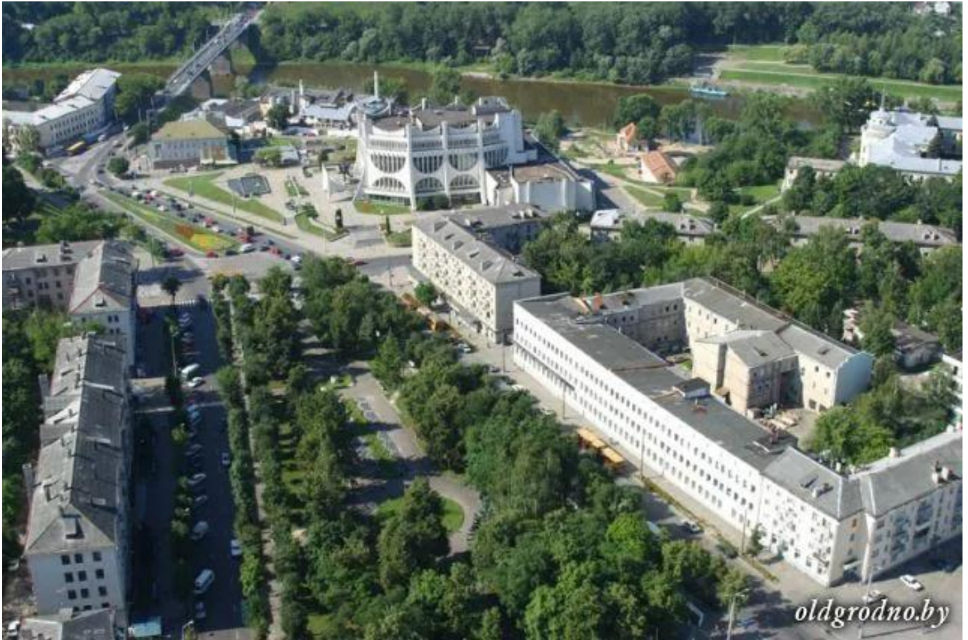
Площадь Советская: до и после

Раньше она была маленькой, камерной и уютной, а стала серой и непропорционально огромной — ничем не отличающейся от других городов. Реконструкция не пощадила и скверы — деревья спилили за несколько дней.