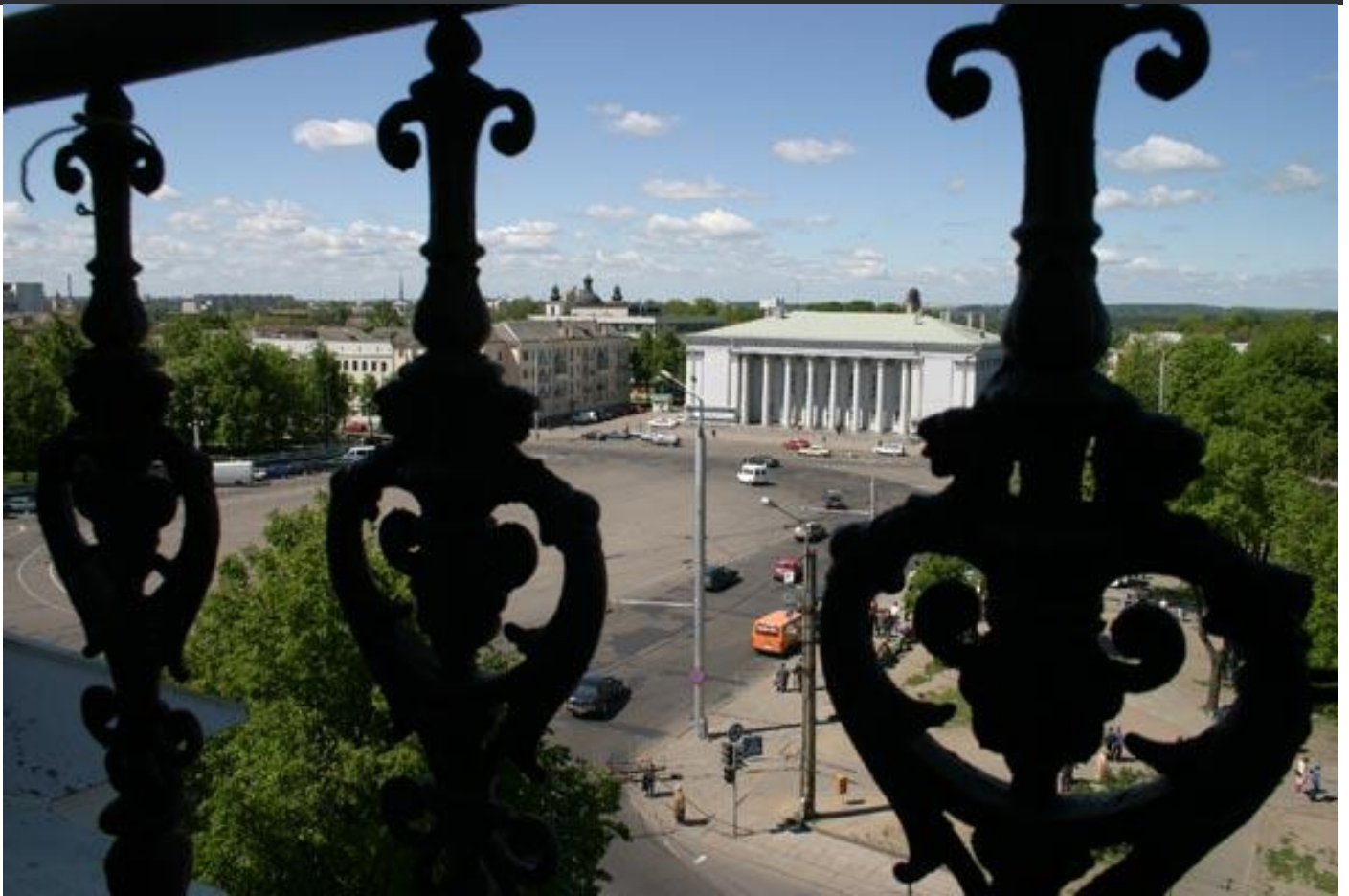
Площадь Советская: до и после

«Мне тут друзья из Минска звонят, кричат, почему мы (гродненцы) им руки еще не поотрывали. Я лично стараюсь площадь обходить, смотреть на это спокойно невозможно, разве что на раскопки напроситься. Сначала так называемая Швейцария, теперь Советская. Что дальше?»